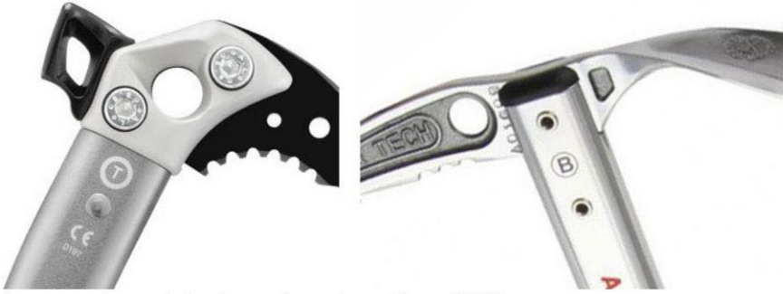
Piolets marcats amb les homologacions tipus T i B