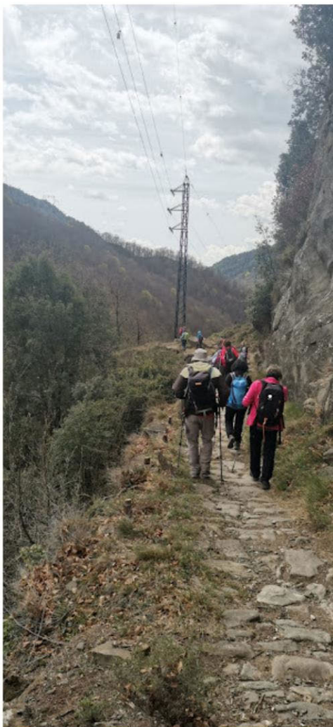
Camí ral de Sant Pere de Torelló a Vidrà.

L' autocar ens deixa a Bracons, ja a 1132 metres d'altitud. Tot i que encara no són les 9 del matí, hi ha molts cotxes aparcats, cert moviment de persones i un punt d'avituallament (ep! que ens han preparat l'esmorzar?). La gent de Torelló està fent la cursa "Pels camins dels matxos". Res, de quatre recorreguts, el més curt són 48 km i 4500 m de