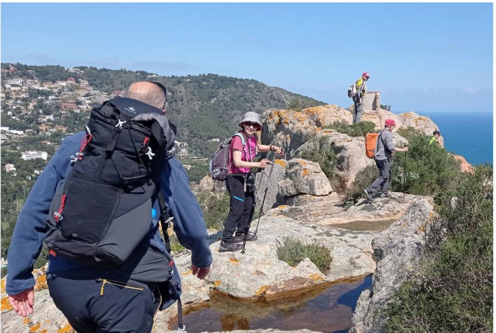
2 Muntanyes de ses Falugues (pàg.4). Foto: Anna Viola Maig 2022