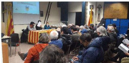
Assemblea General Ordinària

D esprés es van llegir els resums de les activitats de les seccions i vocalies.