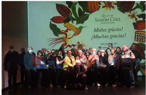
Visita a la Fàbrica Simón Coll.