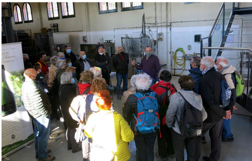
Visita a les caves de Sant Sadurní (pàg.6).