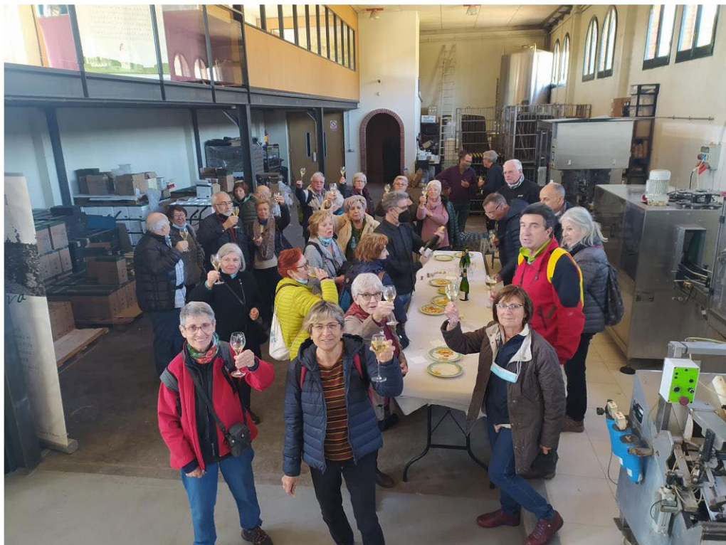
Brindis a les caves de Sant Sadurní (pàg.6).