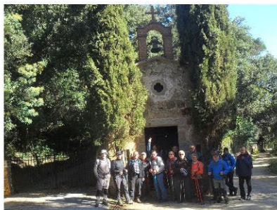
Ermita de Sant Jaume

S ortim de Calella cap a la serra, passem pel mas abandonat de can Cassola, ens arribem a la petita ermita de Sant Jaume, i passem per sota l'autopista per trobar-nos l'ermita de San Rafael.