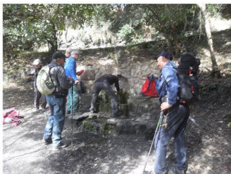
Font del Ferro

Baixem ja cap a Pineda aturant-nos en la darrera ermita, la de la Mare de Déu de Gràcia. En definitiva, ha estat una ruta entre pinedes i alzinars, amb bons exemplars de alzines sureres, amb bon solet primaveral, olor a fonoll i una molt bona companyia.