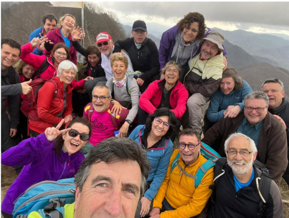
Cim Puig de les Àligues.

E spero que hagueu gaudit d'aquesta excursió! L'havíem preparada per fer-la fa dos anys i, finalment, l'hem pogut realitzar. Fins la propera!