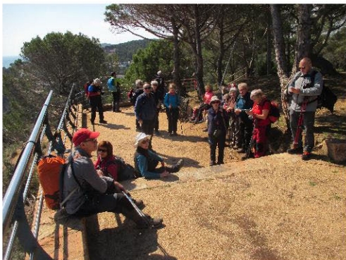
Una aturada per descansar durant el camí.