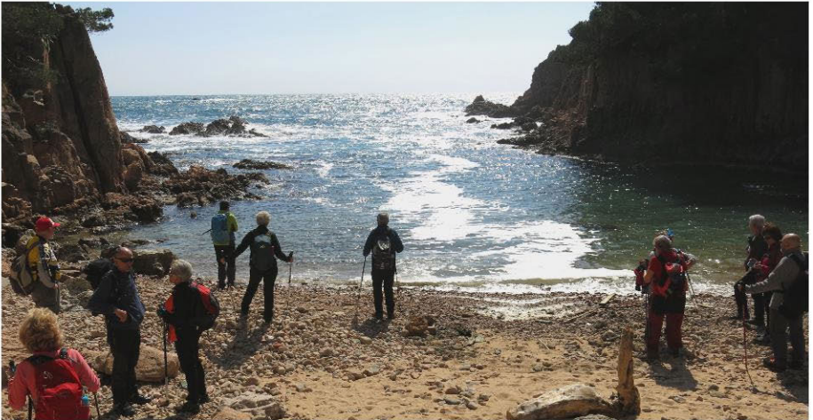
Aigua Xelida

Recorregut: Tamariu – Platja de Tamariu – Mirador de la platja de Tamariu – Camí de Ronda – Es Castellers – Embarcador – Punta d'Esguard – Cala d'Aigua-xel·lida – Mirador Natural Sobre Punta des Banc – Agulla d'Aigua-xel·lida – Sa Roncadora – Cala Marquesa – Mirador d'Aigua-xel·lida – Mirador de la Cova d'en Gispert – Puig des Comal d'Aiguablava – Muntanya de Ses Falugues (175m) – i tornada a Tamariu seguint el GR-92