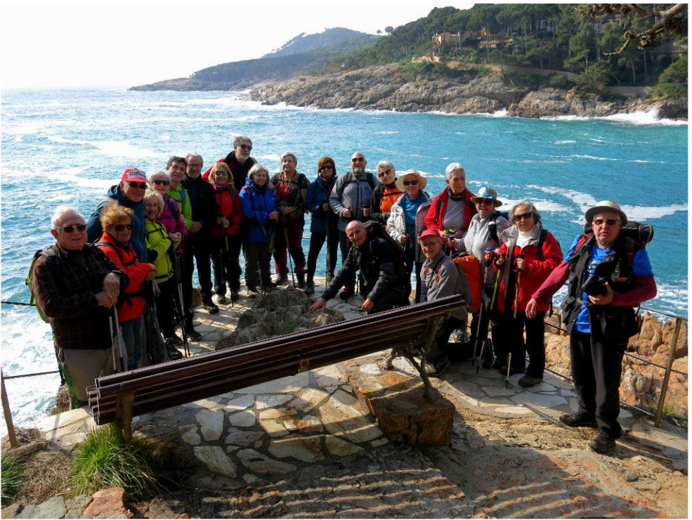
Mirador de Tamarit (pàg.4).