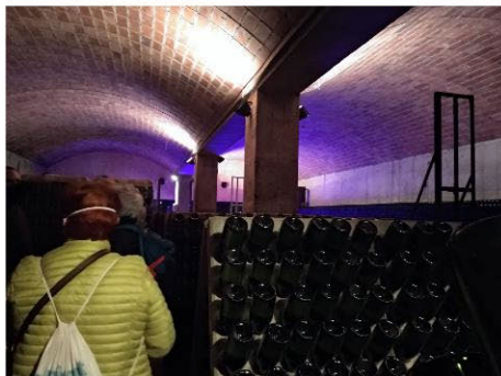
Interior de les caves.

D it i fet: El passat dia 1 d'abril d'enguany ens trobem a l'estació de La Sagrera per agafar el tren cap a Sant Sadurní. Tots estem