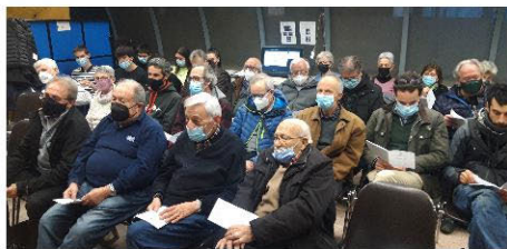
Assistents a l'assemblea