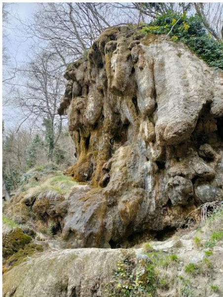
Tosca de Degollats.

desnivell acumulat; i el més llarg, 63 km i 6200 m. Déu-n'hi-do! Ens esperem que no baixi cap corredor per emprendre la pujada. Fins a la collada de Sant Bartomeu, és un no parar de creuar-nos amb corredors que amablement deixem passar. Ara que ja hem fet la pujada parem a esmorzar en un racó ben encoixinat de fulles de faig.