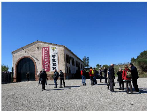
Arribant a les caves.

a baix al vestíbul... tots no, falta l'Emi. Algú se'ns acosta i diu que una companya, l'Emi, ha caigut just abans de baixar les escales, cordó de la sabata descordat i patapam a terra i conseqüències varies que l'impedeixen venir amb nosaltres.