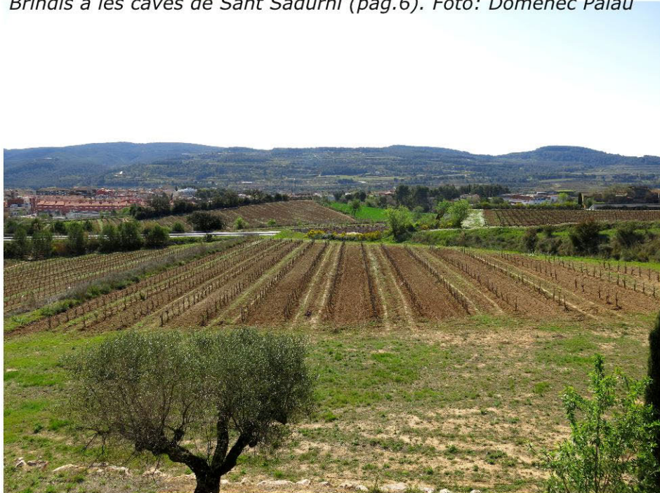
Les Vinyes de Sant Sadurní (pàg.6).