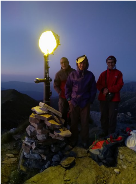
El farell amb la pantalla.

La foscor va impregnant la vall, a dalt encara hi veiem raigs de sol a la vegada que es van encenent els farells en els cims més propers a nosaltres.