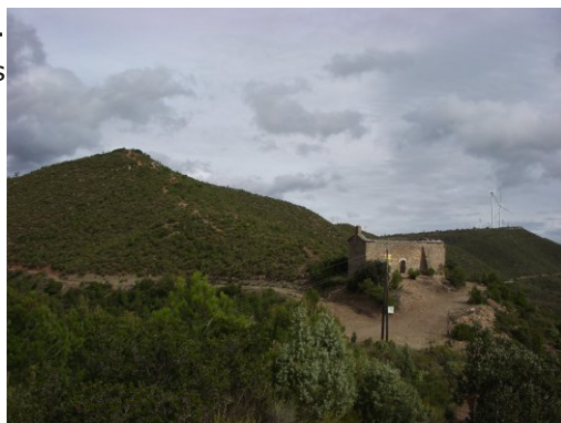
Sant Pere d'Ardesa.