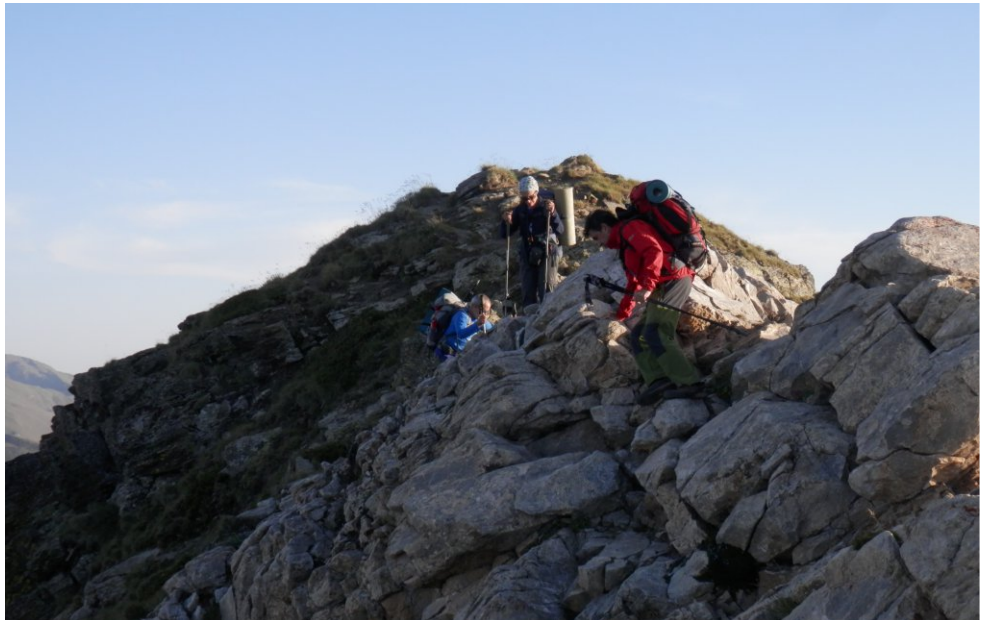
L'AEC a la Via Pirinenca (pàg.7)