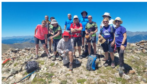
Pic de Perafita.

Arribem al poble prou d'hora per un col·lotge en la terrassa d'un bar amb cervesa freda. Ens acomiadem desitjant-nos bon estiu.