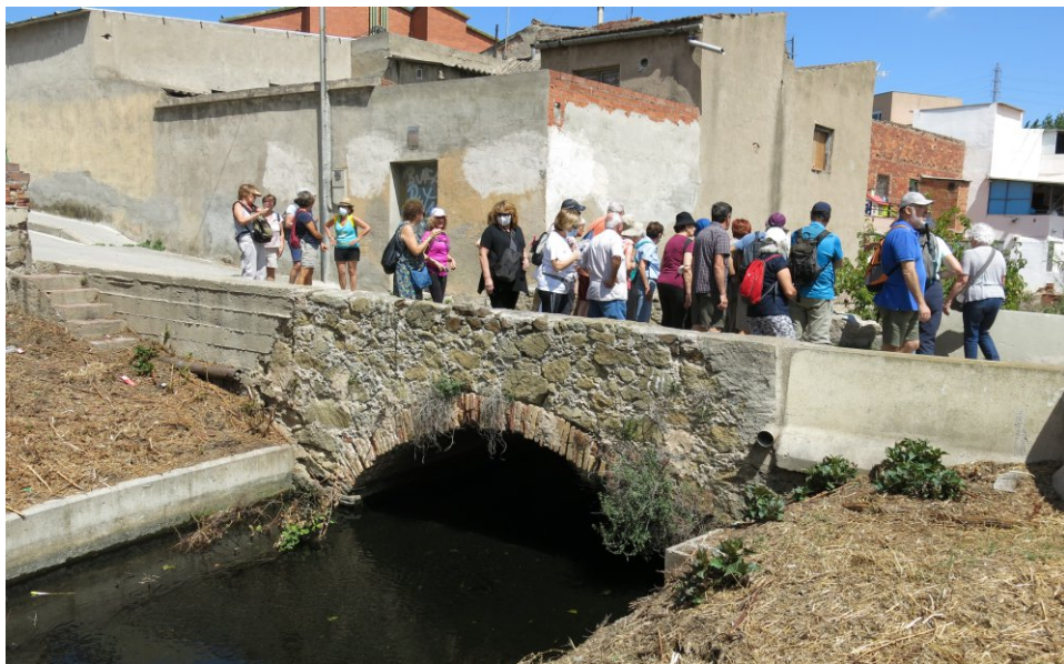
Cultura (pàg.4) El Pont de la Vaca sobre el Rec Comtal, a Vallbona.