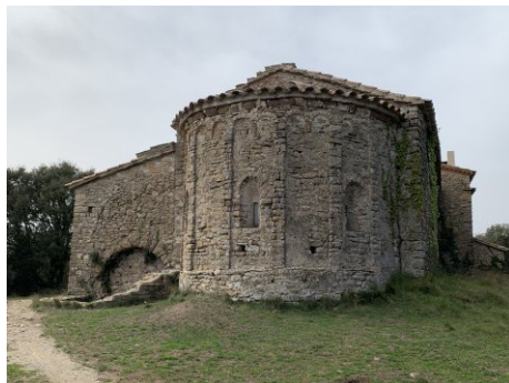
Sant Sadurní de Gallifa.

Desfem les nostres passes fins el pou de sortida i tornem a fer el petit encastament per a sortir. Estem satisfets d'haver baixat a l'avenc: amagat, accessible i curiós. Ja a la superfície anem a retrobar el camí que seguíem cap el coll de Sant Sadurní, i pugem al capdamunt de la cinglera on hi ha l'ermita romànica de Sant Sadurní de Gallifa. Vora el cingle les vistes paguen la pena. Retornem al coll de Sant Sadurní, i baixem per la dreta canal de Sant Sadurní fins a Gallifa.