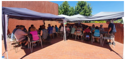
El dinar.

Em quedo molt pensativa davant d'aquests horts: la desmesurada construcció ha engolit aquestes terres tan necessàries que són la font de la nostra alimentació.