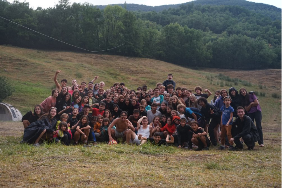
Tots els grups del campament junts.

U na vegada més, volem donar les gràcies ben sinceres a aquest grup de noies i nois que han muntat aquest campament de l'estiu 2022.