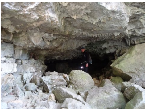
Cova de Golaró.

-La primera, la Cova del Goleró sota els cingles del Far. Comencem l'itinerari a Sant Martí Sacalm i per la canal del Grau Petit pugem a l'ermita de Santa Anna ja a dalt de l'altiplà. Ens acostem al Santuari del Far, on gaudim de les vistes sobre el Ter, les Guilleries, el Collsacabra, el Montseny, i més enllà. Seguim direcció NW i ens enfilem a La Trona, que és una part del cingle en part esberlada, però que és un magnífic mirador. Continuem en la mateixa direcció per sobre l'altiplà del Far. El camí aviat es converteix en un corriol de cornisa a frec de la cinglera, i que va perdent alçada fins