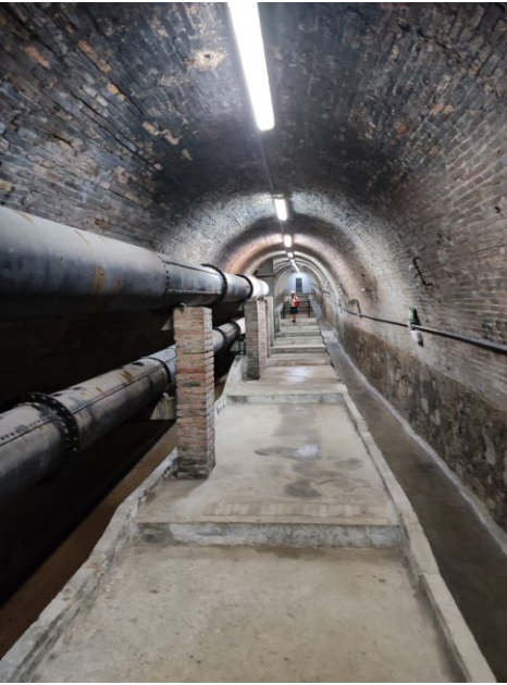
Túnel que uneix les cases de l'aigua de la Trinitat Vella i la Trinitat Nova.