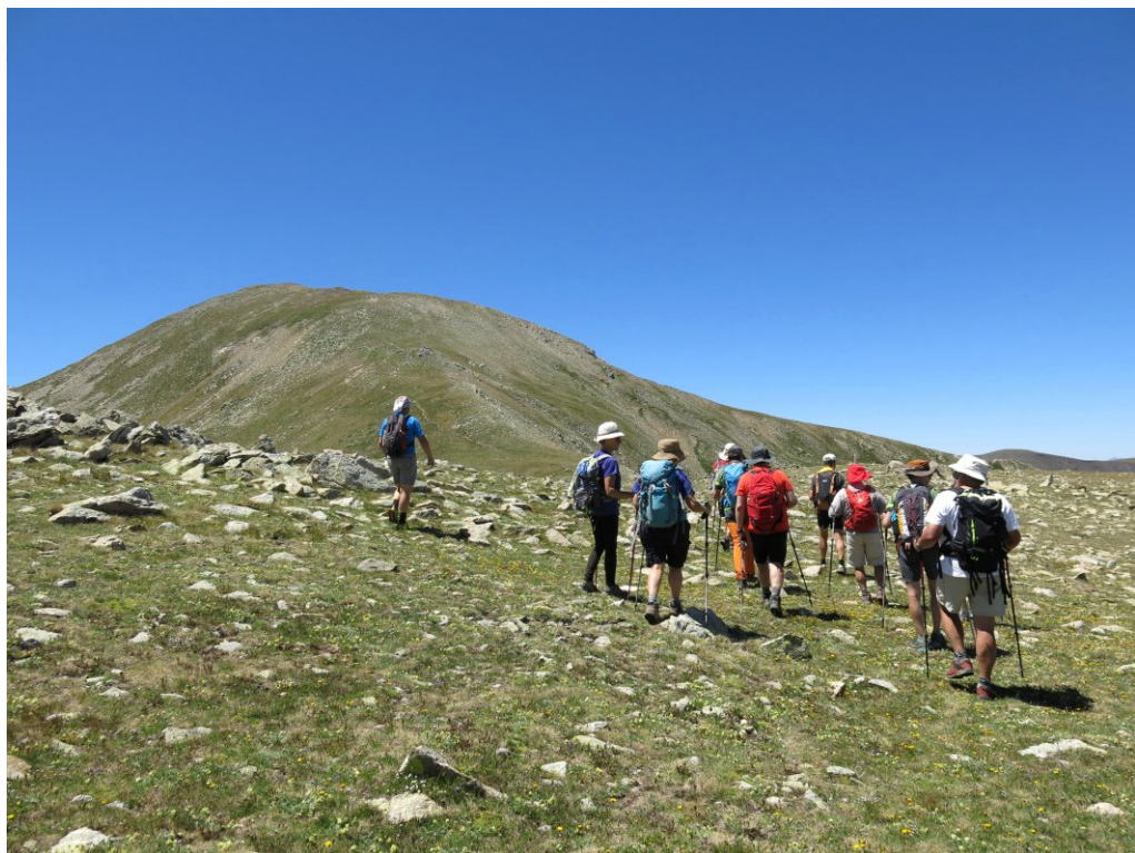
Semprepodem (pàg.9) Pujant cap al Perafita.