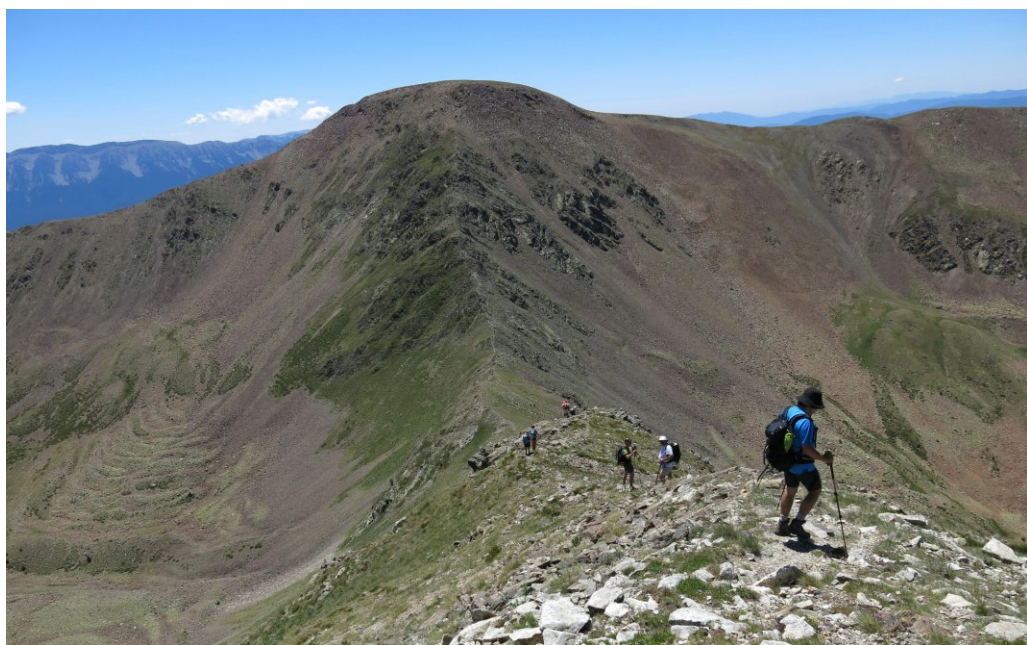
Semprepodem(pàg.9) Baixant cap al coll de Claror.