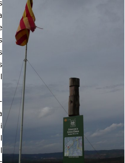
Puig de Sant Miquel.

La excursió és molt senzilla, còmoda i fàcil, doncs tot el recorregut es fa per pista forestal, seguint les marques d'un P.R., llevat el tram final que va per un camí. A més en els trencalls sol haver-hi indicacions. Sota del cim trobarem l'ermita de Sant Pere d'Ardesa, molt malmesa i en fase de restauració. Data del segle XI i pertanyia al Castell d'Ardesa, datat de l'any 989 i del que pràcticament no se'n veuen restes.