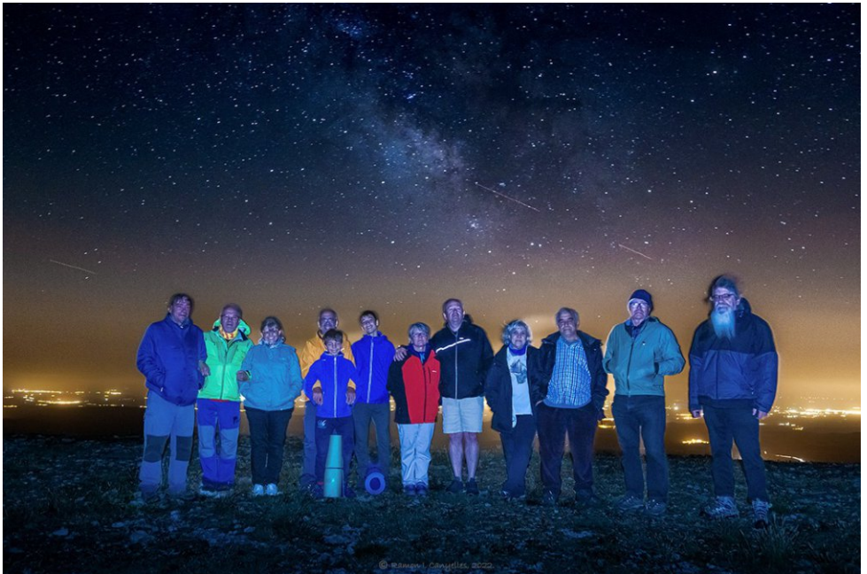
El grup de Sant Alís.

Ja es negra nit emocionats i Jembadalits gaudim de l'espectacle en silenci i acompanyats de Llums i Llibertat .