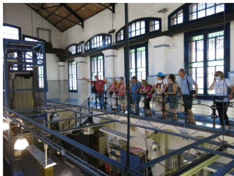
Casa de l'Aigua de la Trinitat Vella.

admirant la sortida d'aigua de la mina, netíssima i transparent. Convida a banyar-nos, comença a fer calor. Davant mateix ens fem la fantàstica foto de grup.