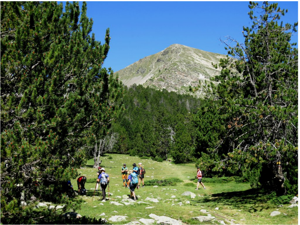
Semprepodem. El Perafita al fons. (pàg.9).