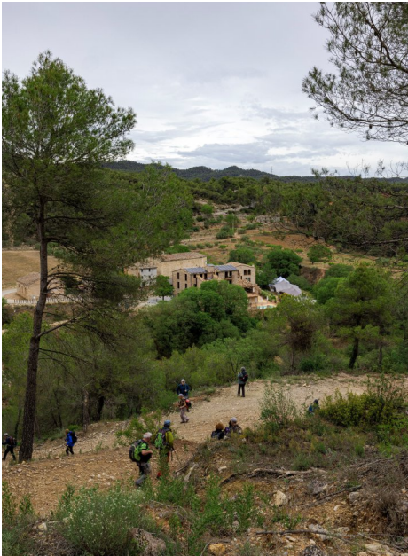
Baixant cap a Santa Càndia.