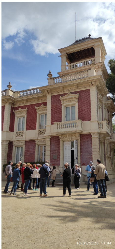
Can Tinturé.

fabricació de ceràmica decorativa catalana des del segle XIX fins pràcticament avui dia.