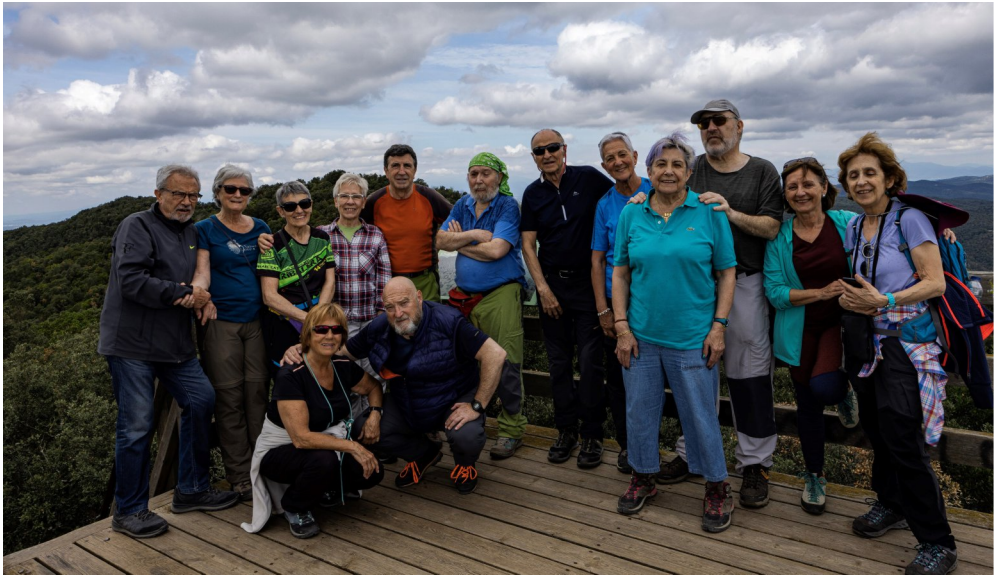
Dimecres al Sol. (pàg.4). Al mirador de Puig d'Arques.