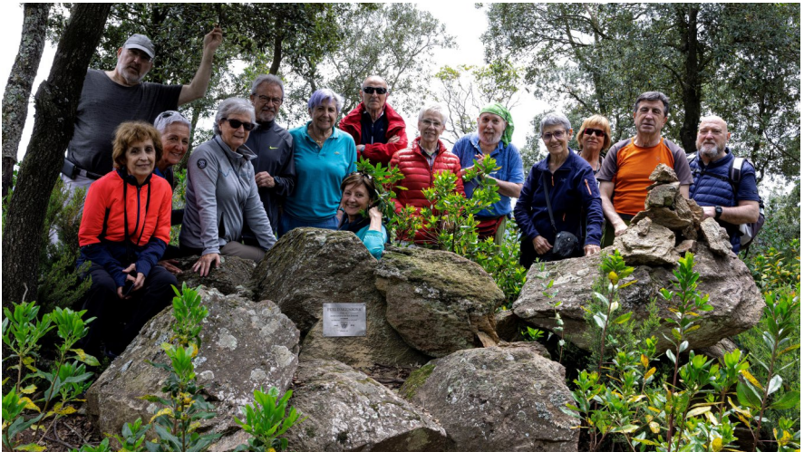
El grup amb la placa.

E n resum, una excursió plena d'anècdotes que fan germanor.