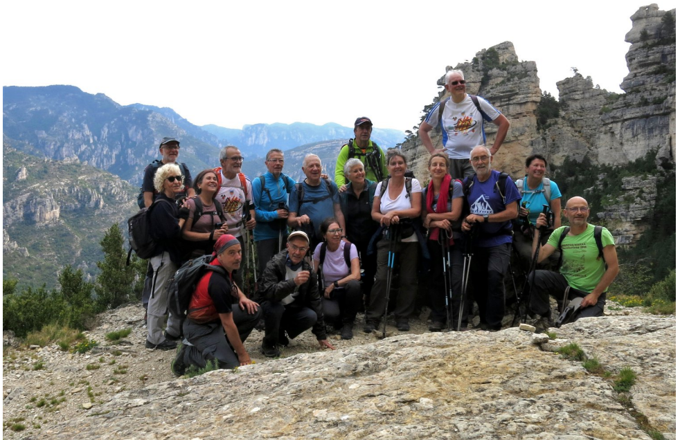
Semprepodem. Portell de l'Infern - Els Ports (pàg.14)