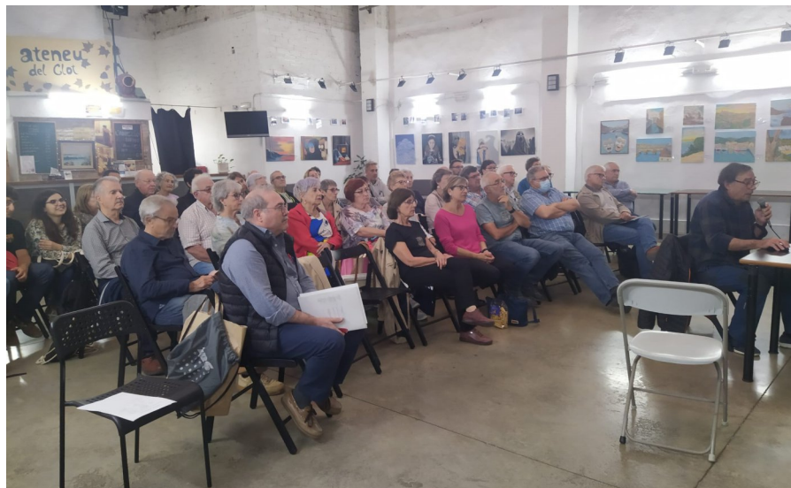
Reunió de voluntaris de la Ribalera, a l'Ateneu del Clot.