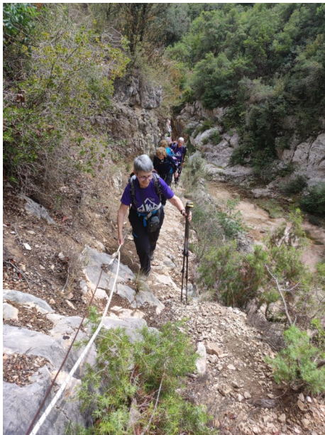
La corda.

manca d'aigua a la riera. Només n'hi ha una mica en els profunds gorgs que es troben en tot el curs.