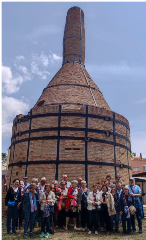
Museu de la Rajoleta.

A questes restes tenen un gran valor arqueològic i tecnològic. Permeten mostrar el procés de