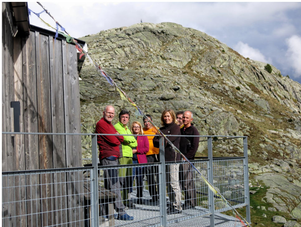
Refugi de la Colomina.

La Rosa Maria ens programa una sortida de la SEAM al Peguera per re col·locar la placa dels sostres comarcals que feia temps que havia desaparegut del cim.