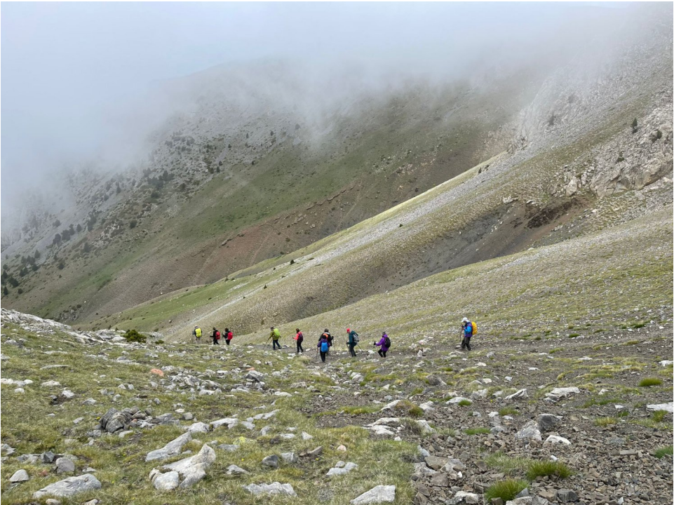
Descens del Coll de la Vall.

https://ca.wikiloc.com/rutes-senderisme/coll-de-pal-hospitalet-de-roca-sanca-137317909