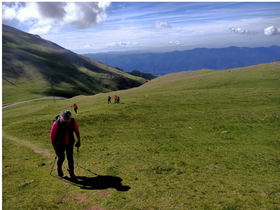
Semprepodem. Pujant al Serrat Gran (pàg.8)