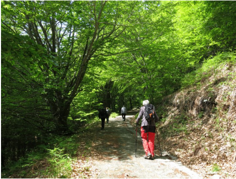
Pujant per la pista.

Continuant amb les sortides per anar revisant les plaques als sostres Comarcals, la sortida de Maig ha estat a la comarca de l'Alt Empordà, on calia col·locar una nova placa al Roc del Comptador, que actualment sabem que supera per pocs metres el cim del Moixer, on la vam posar al seu dia.