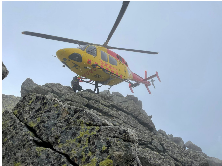
El rescat.