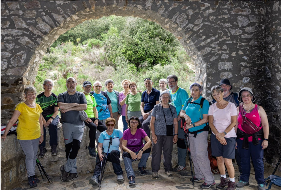
A l'Ermita de l'Erola.

Amb moltes ganes de fer una caminada de senderisme, hem començat aquesta sortida amb l'esperança que no ens caigués un xàfec al mati i les previsions han estat així, hem pogut començar gaudint de tot l'entorn de la natura.