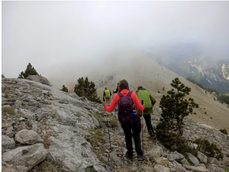
Carena de la Tossa a Coll de Jou.

Aquest cop vàrem organitzar la sortida de forma diferent ja que oferíem la possibilitat de triar diferent nivell de dificultat, i d'aquesta forma cadascú podria triar la que millor s'adaptava a les seves característiques.