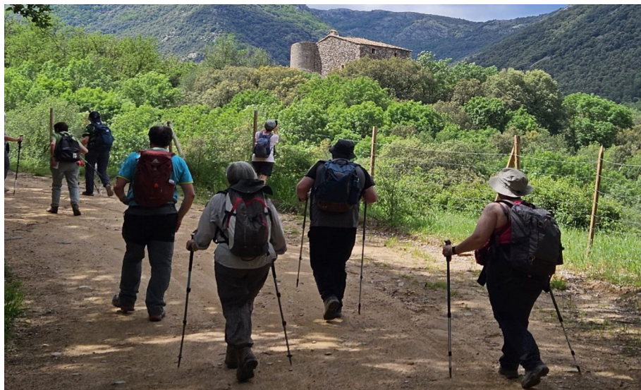
Senderisme (pàg.6) La Sala.