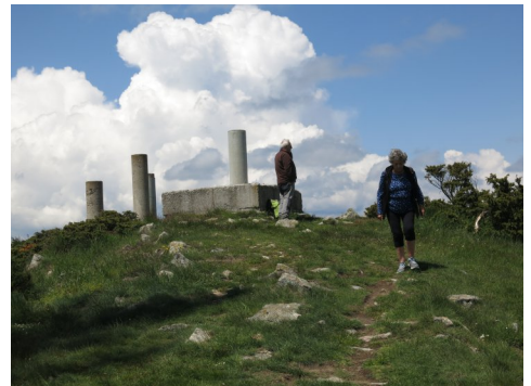
Cim del Moixer.

Als companys que s'havien avançat amb cotxe, ja havien fet força feina: La placa del Moixer ja