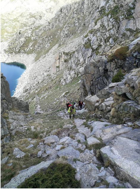
El Pas de l'Ós.

hem vist ningú que no fóssim nosaltres, hem pujat amb dues parelles de Vic però ja han baixat, està clar algú de nosaltres ha pres mal, no hi ha cobertura, no podem comunicar-nos amb ningú, decidim baixar cap al refugi, això sí ara a pas eixerit.