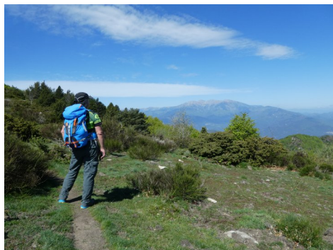
Arribant al cim del Moixer

A partir d'aquí el nostre itinerari pren direcció W per la llarga i panoràmica carena fronterera. Durant tot el dia caminarem sota la presència del Canigó. Aviat trepitgem el cim del Moixer proper a unes grans antenes, després el Roc Comptador