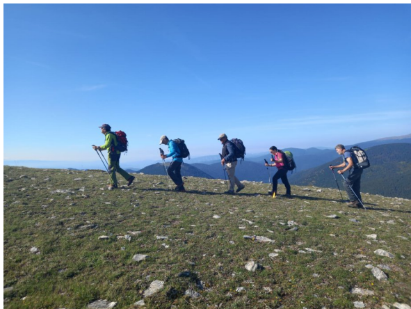
Preparació. Marcant el camí i portant beguda als controls.

Fotos de diversos voluntaris de la Ribalera 2023.