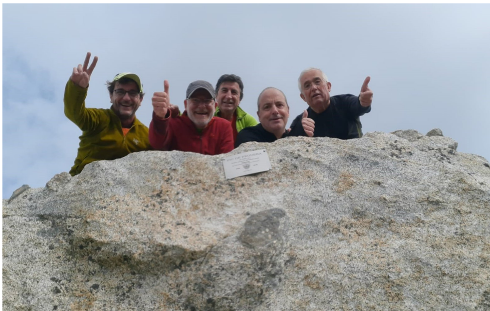
Pic de Peguera. (pàg.10). Placa col·locada!