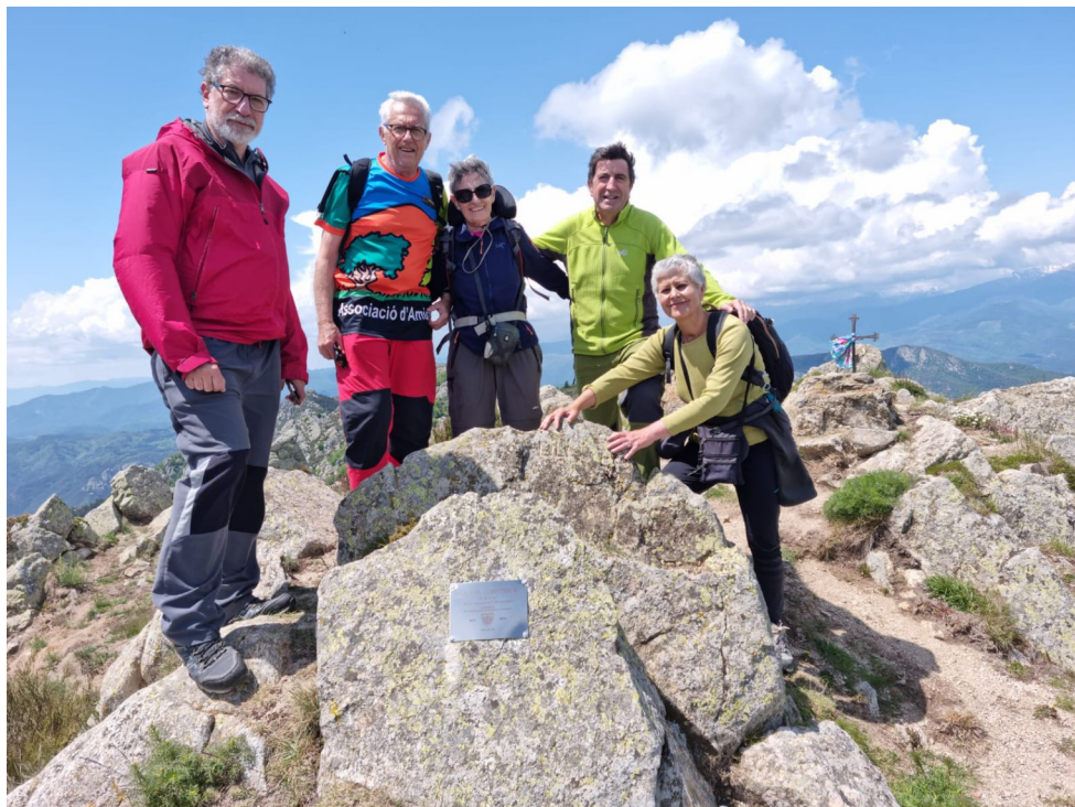
Dimecres al Sol (pàg.4) Cim del Roc Comptador amb la placa.