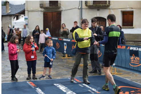
L'arribada, amb els petits voluntaris.