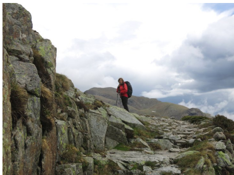
Pujant a la Colomina amb el Montsent de Pallars al fons.