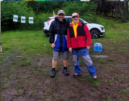
Voluntaris a diferents controls de la cursa.