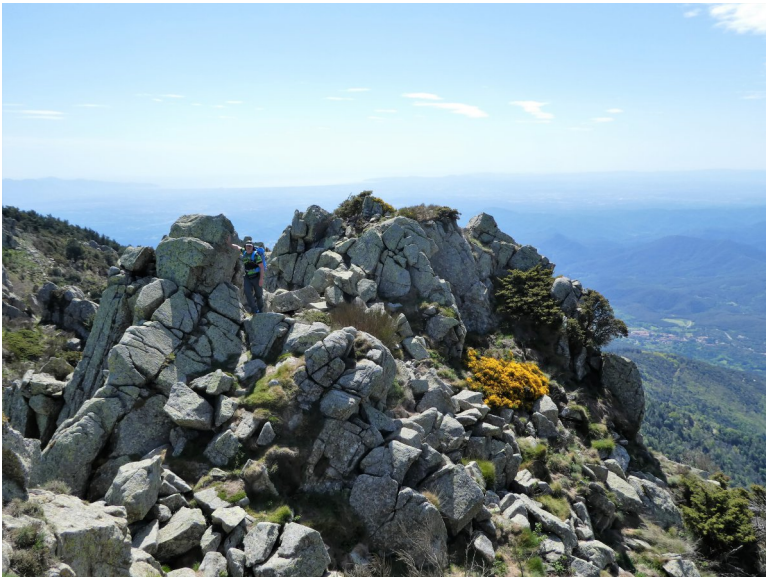
Pujant al Roc de la Frausa