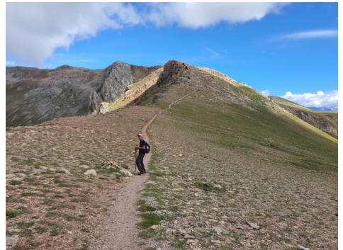
Collada de Comabella.

L' altre grup format per 13 persones vàrem seguir el mateix itinerari fins a Coll de Jou, però fent una petita marrada per tal de conèixer el passat miner d'aquest indret. Així que un cop dalt de la Tosa baixem directes cap a un petit collet direcció Nord-est on existeixen les runes d'una antiga cabana de miners. Després del collet seguim un antic camí (oest) existent per treure el mineral (ferro i manganès) i visitem les dues mines més septentrionals existents i potser les més ben conservades, (Mines de Das ja que estem en aquest municipi). Un cop