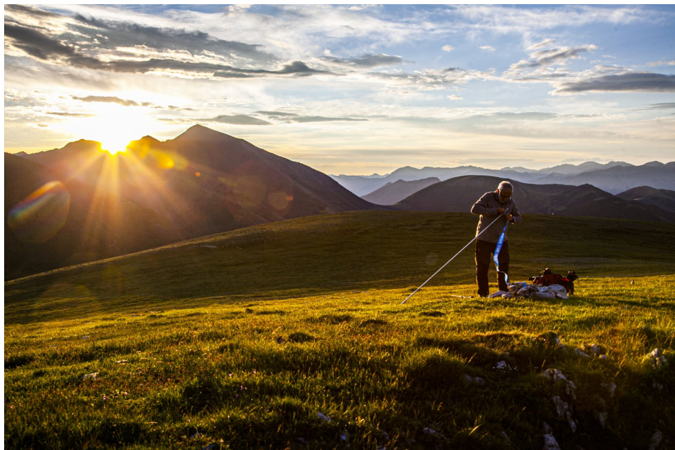
La Ribalera. (pàg.14). Sortida de sol a Coll de Màniga.