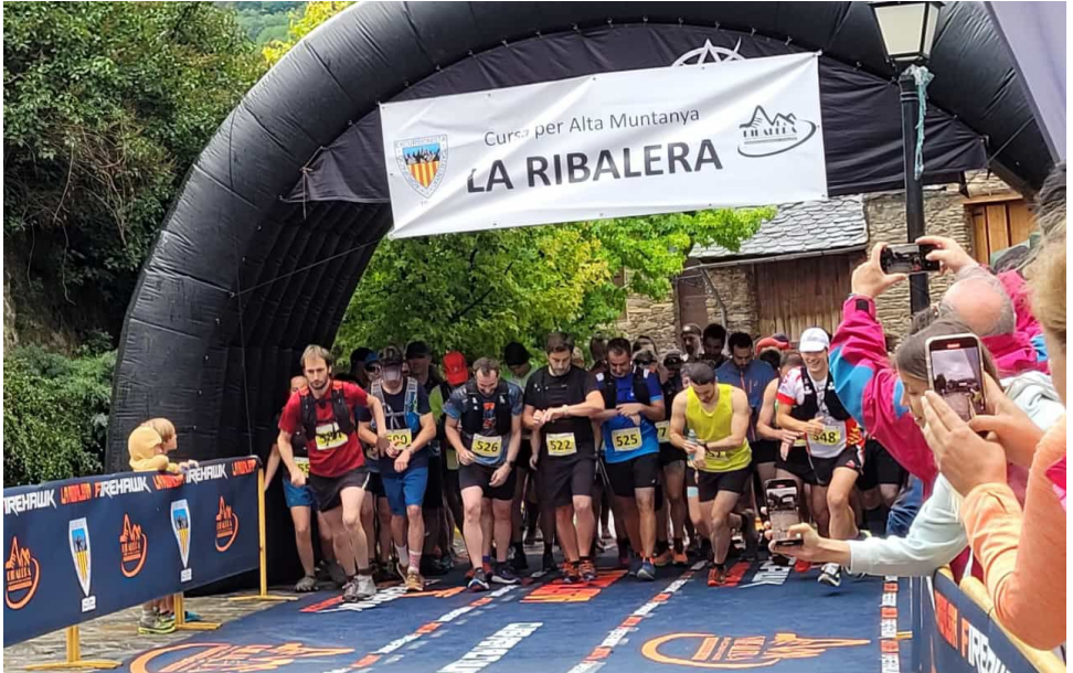
Sortida de la cursa popular.

Doncs sí !!! Hem arribat a la Xª, una activitat iniciada quan el Centenari de l'Agrupada i que vam construir pensant en que tingués successives edicions. Vàrem dir d'arribar a la Xª i ho hem aconseguit !!