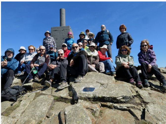
Mola de la Roquerola (Alt Camp)