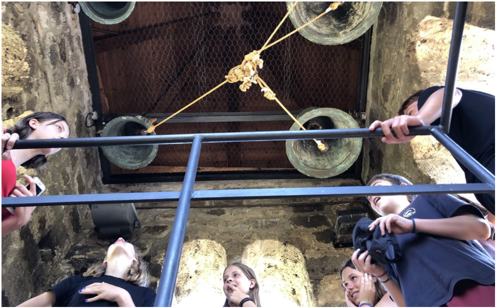
SIJ La ruta Romànica dels M. (pàg.8). Campanar d'Eril la Vall.