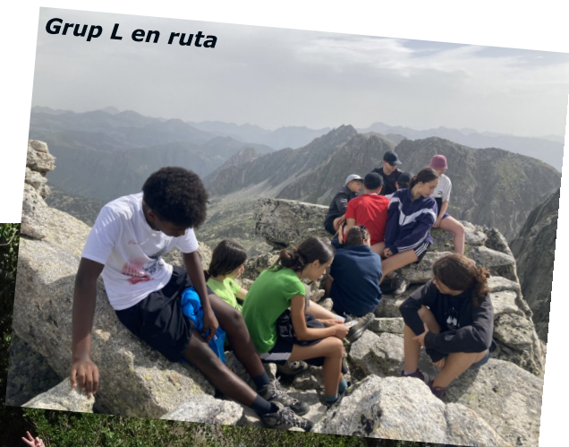
Grup L en ruta