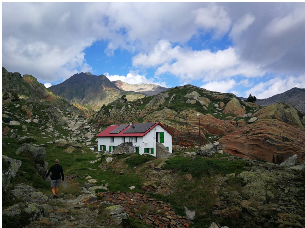
SEAM/Semprepodem. Pic de Certascan (pàg.12) El refugi de Certascan.