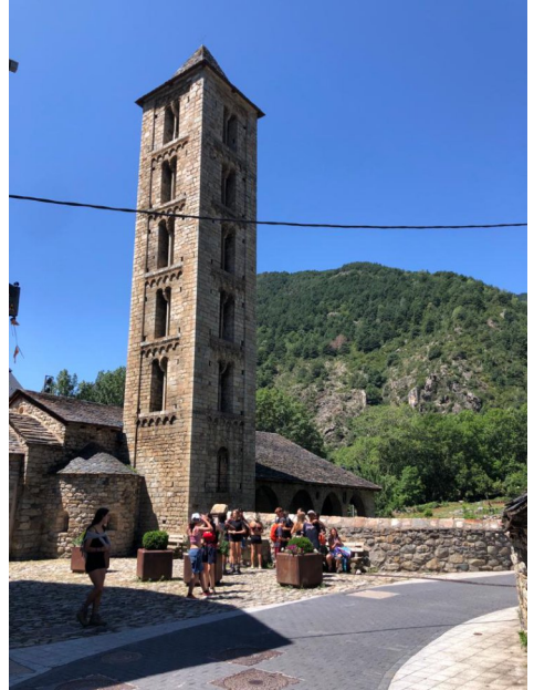
Erill la Vall

L a segona setmana al campament ens va servir per tornar a agafar forces i gaudir de la tranquil·litat i la calma de la natura. Àpats, activitats, estones de temps lliure, nits de bivac sota les estrelles... I a mitja setmana