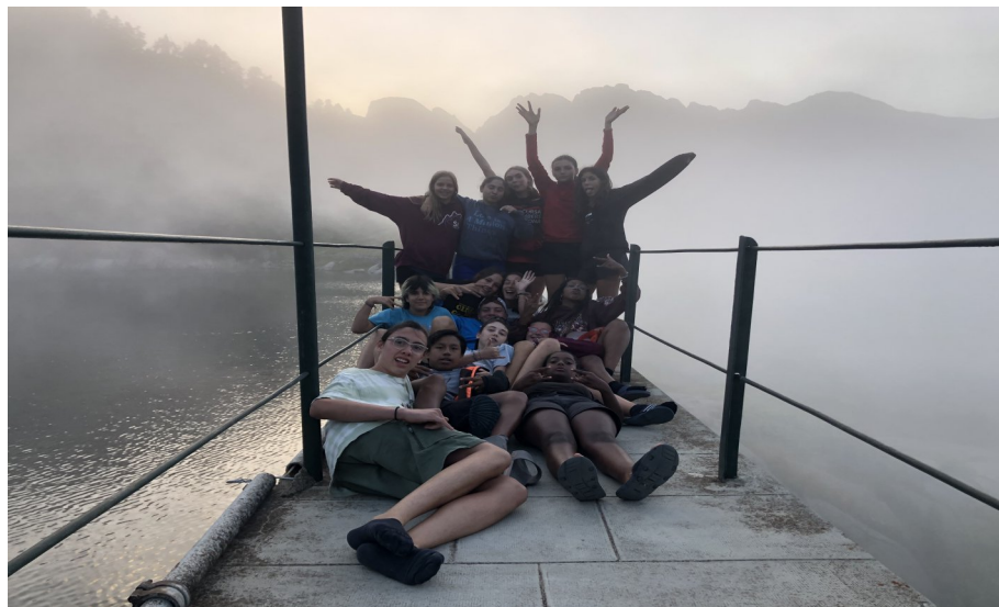
Campaments d'Estiu SIJ (pàg.10). Grup M en ruta.