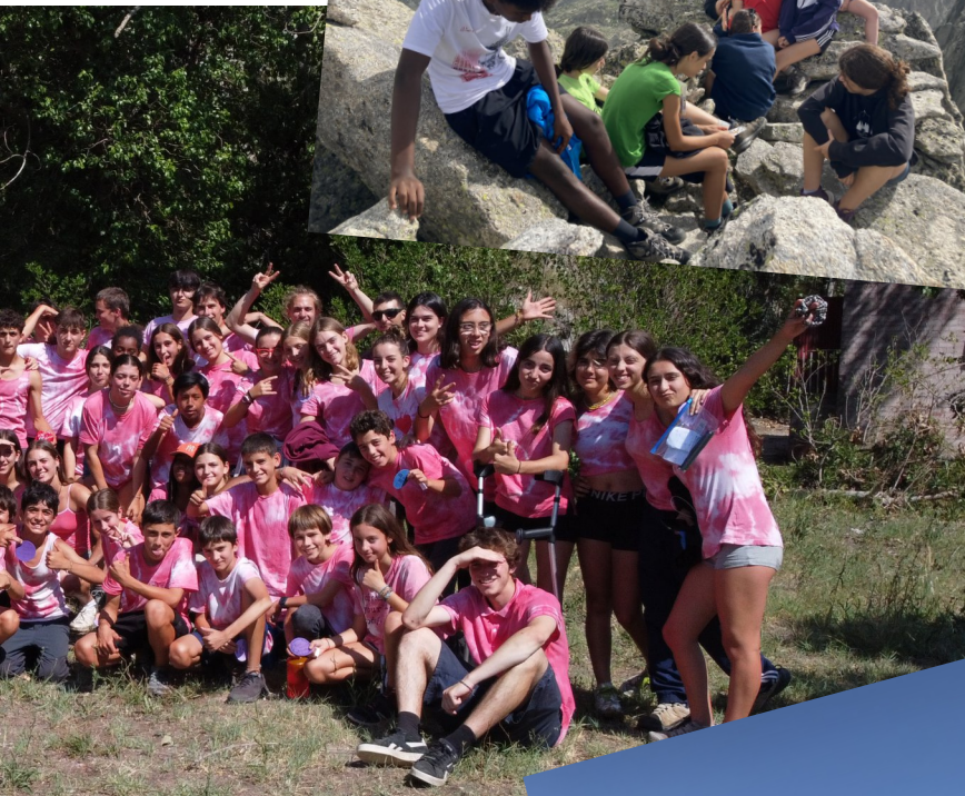
Grup S en ruta