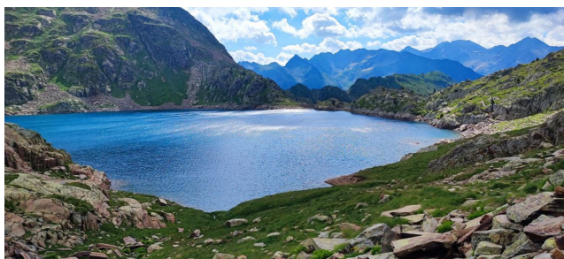
Llac de Certascan

Al Pla de Boavi s'hi arriba després d'un passeig; quatre hores de cotxe i un esbarjós esmorzar a Agramunt. Entremig, hi ha una pista practicable per turismes, que enllaça l'estació hidroelèctrica de Certascan amb la presa de Montalto. Aquest trajecte, la majoria ho van fer en cotxe, mentre d'altres van preferir caminar i algú hi va afegir exercici aeròbic.