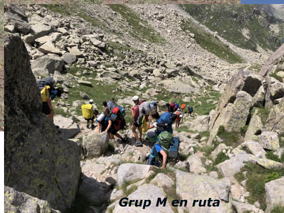
Grup M en ruta