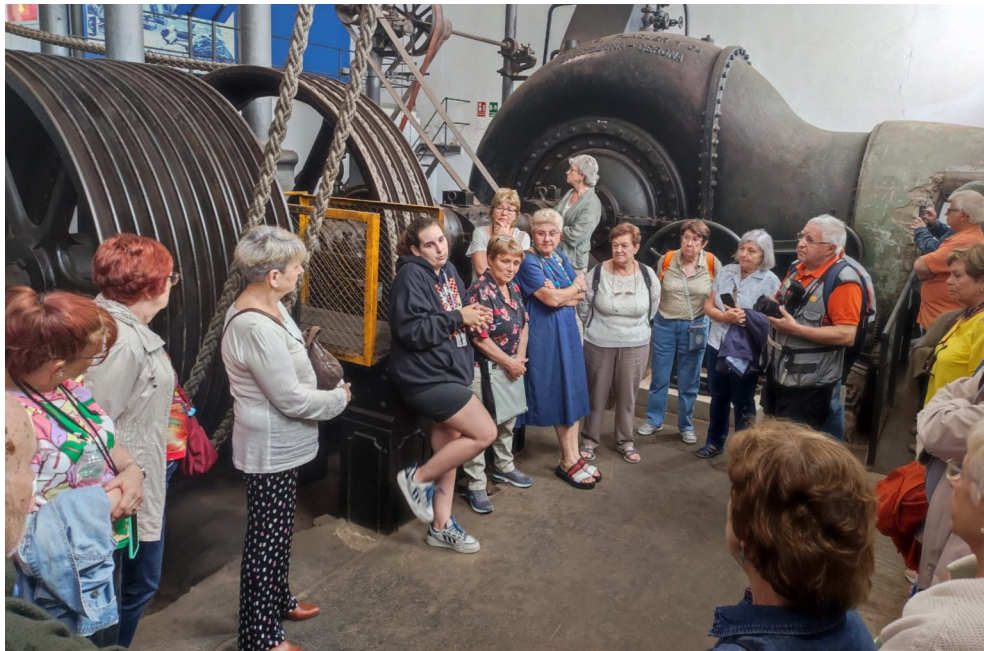
Cultura. (pàg.6). Visita a la Colònia Sedó.