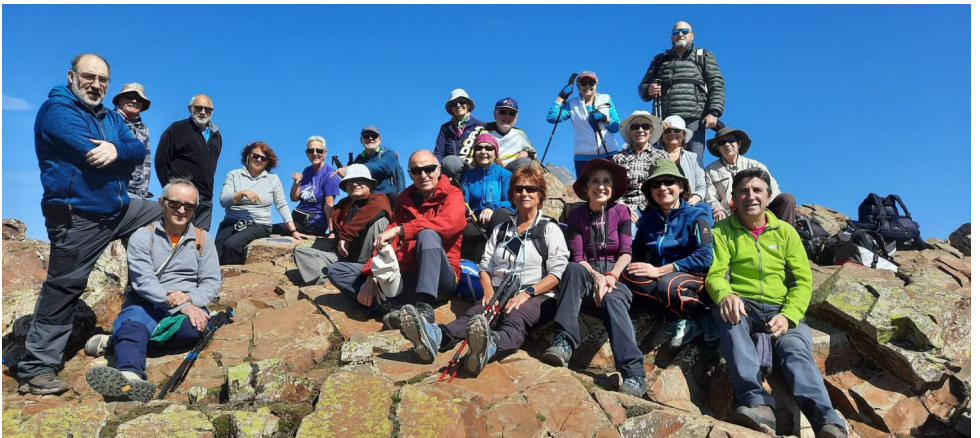
Les Agudes (La Selva)

Donem les gràcies a tots els que hi heu col·laborat i assistint a les sortides i us animem a que ho seguïu fent, per acabar la feina que encara resta i que esperem poder acabar en els pròxims mesos.