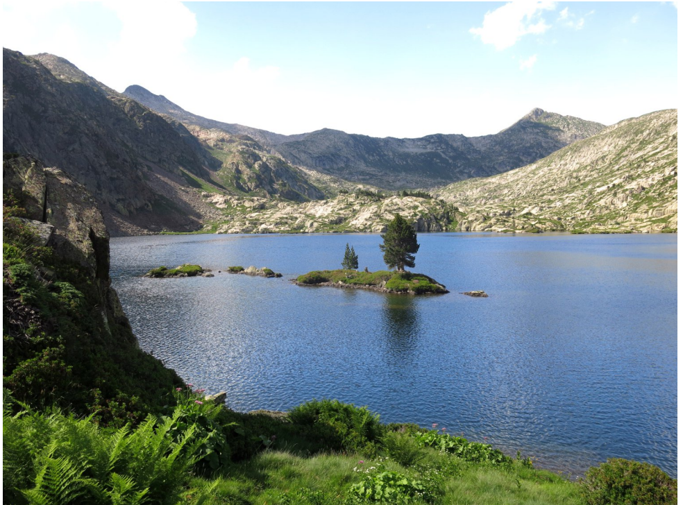
Pic de Certascan (pàg.12) Estany Romedo de dalt.