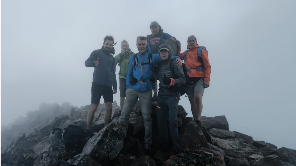
Al cim del Certascan