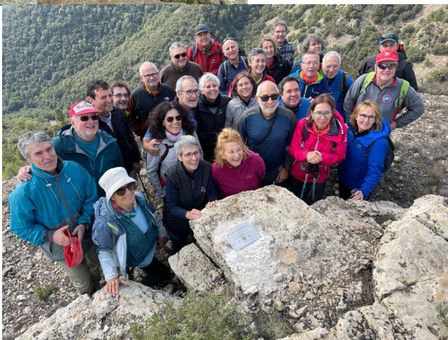
Roc del Comptador (Alt Empordà)