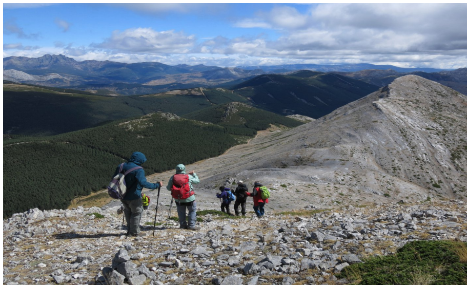
Campament. Pico del Fraile (pàg.6). La baixada.