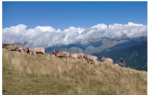
El pastor motoritzat.

fem una parada per descansar una estona i després reiniciem la marxa com abans, uns més ràpids i d'altres xino-xano, però tots amb moltes ganes. El camí està una mica enfangat i per a uns, més que per altres es fa més pesat. Però, tot i així, més aviat o més tard... TOTS ARRIBEM AL CIM. Allà trobem més vaques pasturant, força gent, molts fent-se la foto de rigor, i unes vistes espectaculars, magnífiques, amb el Puigmal tapat pels núvols, Núria, la serra Cavallera, el Canigó, el Montseny?, el Pedraforca ... Fa un dia preciós. Descansem gaudint del paisatge i fem les fotos pertinents. En un moment donat apareix un pastor motoritzat que s'emporta les vaques.