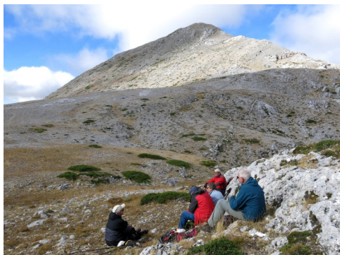
Aturada al coll amb vistes al cim.