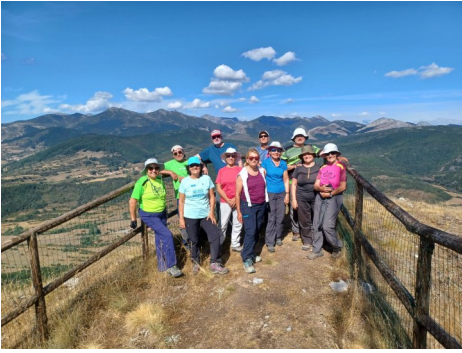
Pico Tremaya.

a la que més l'interessi. D'aquesta manera algun dia hi ha fins a quatre activitats.