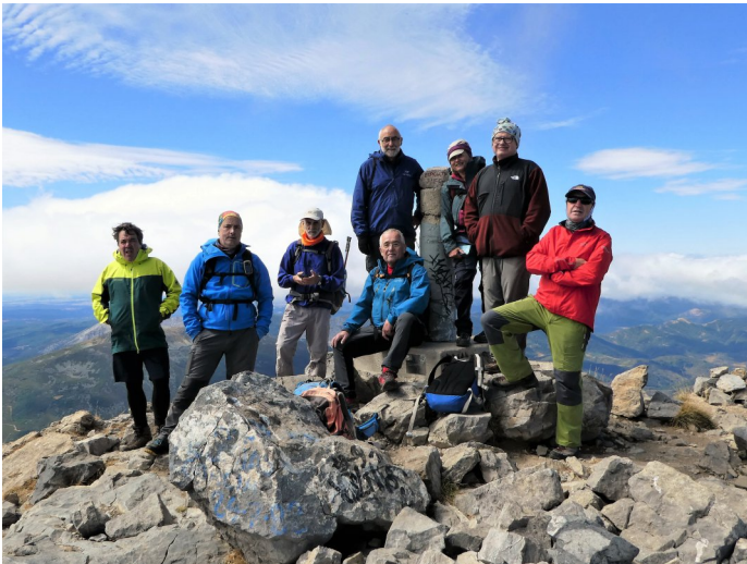
Cim de l'Espigüete

Pico Espigüet aresta Est: 10,22 Km i 1.305m desnivell.