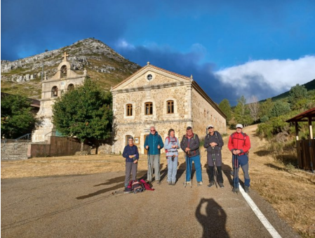
Santuari Nuestra Señora del Brezo.

Durant el Campament d'estiu, una colla de 7 vam decidir-nos per pujar un cim que malgrat la seva modesta alçada, té un marcat caràcter i una situació que en fan un excel·lent mirador.