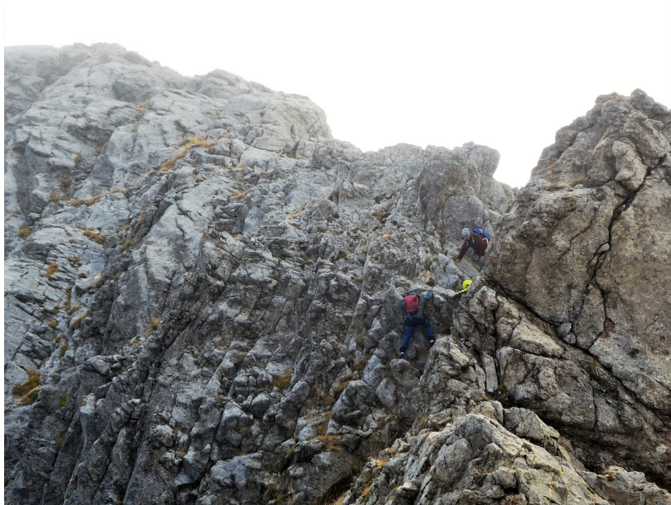
Campament AEC. Pico Espigüete (pàg.8) Crestejant.