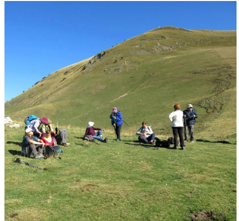
Prenent un descans amb el Taga al fons.

J a on tenim aparcats els cotxes, el Bernat, el benjamí del grup, reparteix lllaminadures que ben bé, podrien ser com un premi al repte aconseguit!. Dinem a Ribes de Freser, al restaurant Can Sart. El dinar és molt bo, esplèndid. Després d'una sobretaula bastant llarga, contents i satisfets, agafem els cotxes per tornar a Barcelona