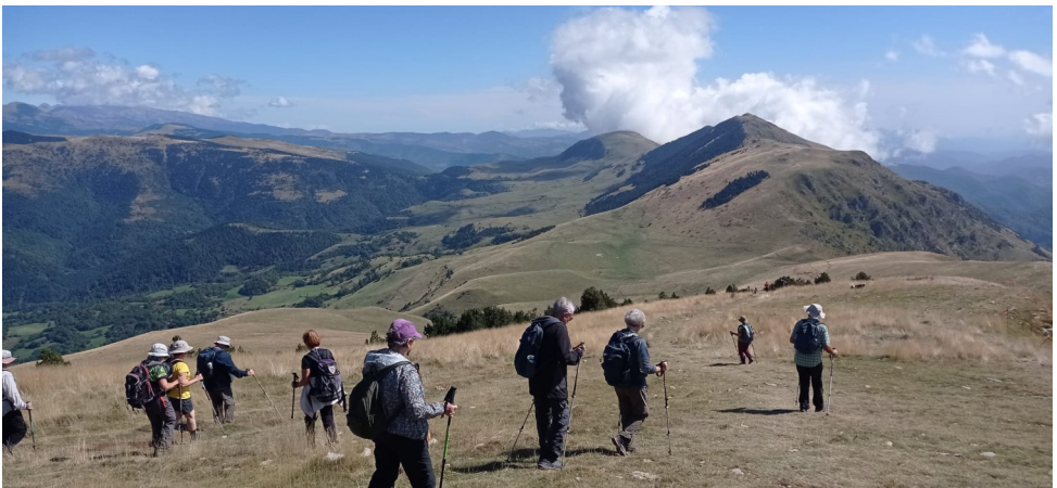
La baixada.