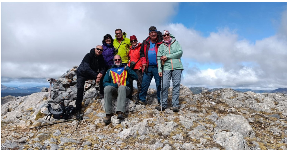
Cim del Pico del Fraile.

Tornem al Campament, contents d'haver assolit aquest cim modest, però bonic perquè sí.