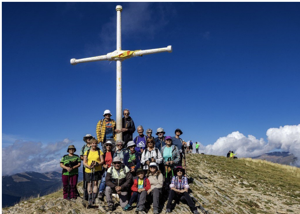
Senderisme (pàg.11) Tota la colla al cim del Taga.