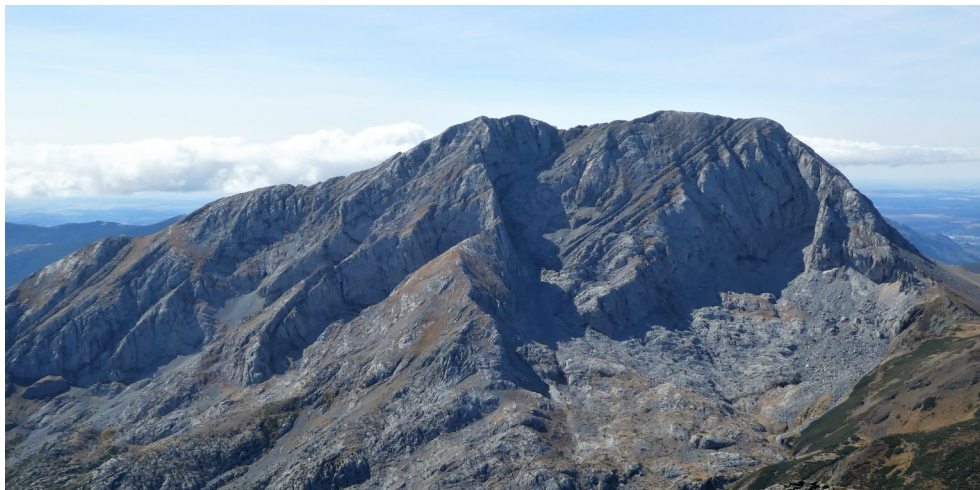
Espigüete. Cara Nord.

Estem al campament de l'Agrupa a Cervera del Pisuerga, i ja des de que vam sortir de Barcelona, tenim al cap la idea de pujar al Pico Espigüete per la seva aresta oriental.