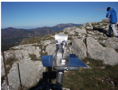
Barcelona 14 de Novembre de 2008.

Motxilla, gorra, ulleres, crema solar, roba d'abric tot l'any i protectora del vent. No és pas recomanable fer-la amb wambes. Cal dur força aigua.