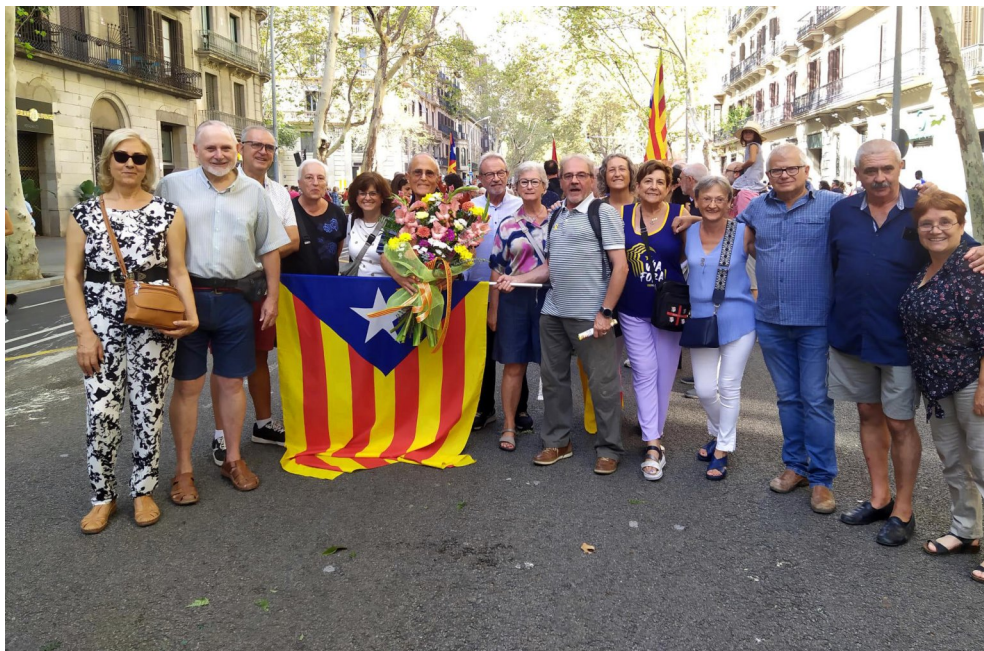
11 de setembre. (pàg.10). Ofrena floral.