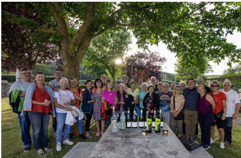
Campament AEC 2023 (pàg.4). Aniversaris i comiat.