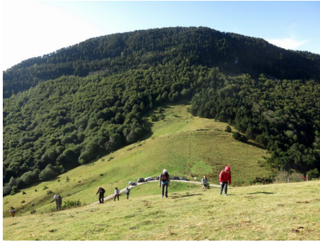
Sortint de Coll de Jou.

16 de setembre: comencem la temporada amb la pujada al Taga. Sortida fàcil, però amb un desnivell d'uns 400 m, que a alguns ens preocupa una mica perquè després de l'estiu estem desentrenats.