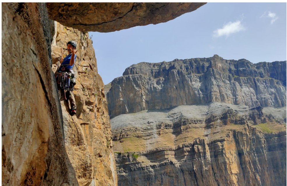
Zaratustra al Gallinero (pàg.4).