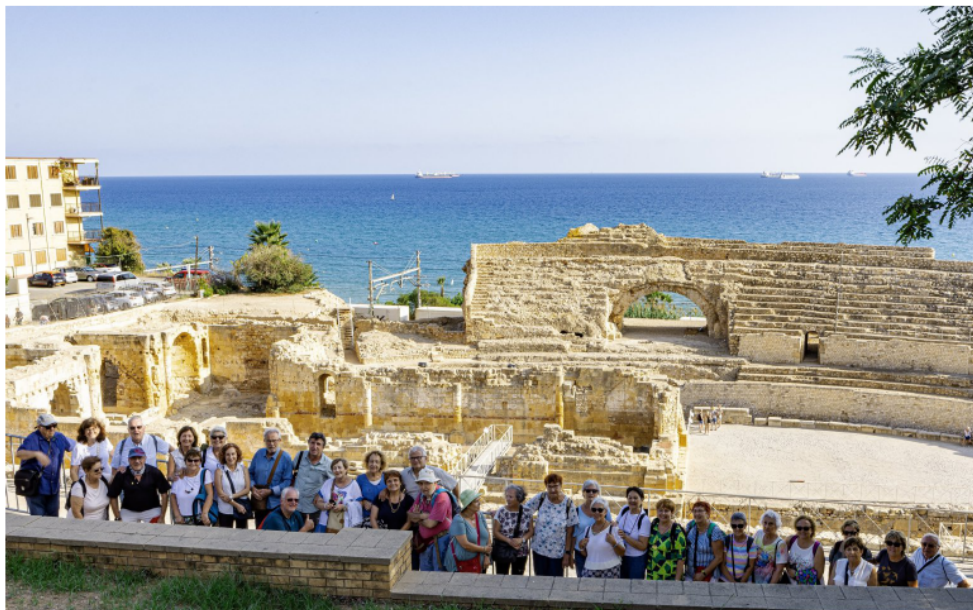
Visita a Tarraco. (pàg.8). Tot el grup a l'amfiteatre.