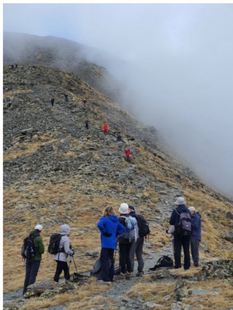
Pujada al Puigmal.

A nem carenant per les Clotes, passem prop del telecadira de l'antiga estació d'esquí, vorejant frontera. Tot i que la boira ens segueix de prop l'anem escampant i no ens barrarà el camí en tota la jornada.