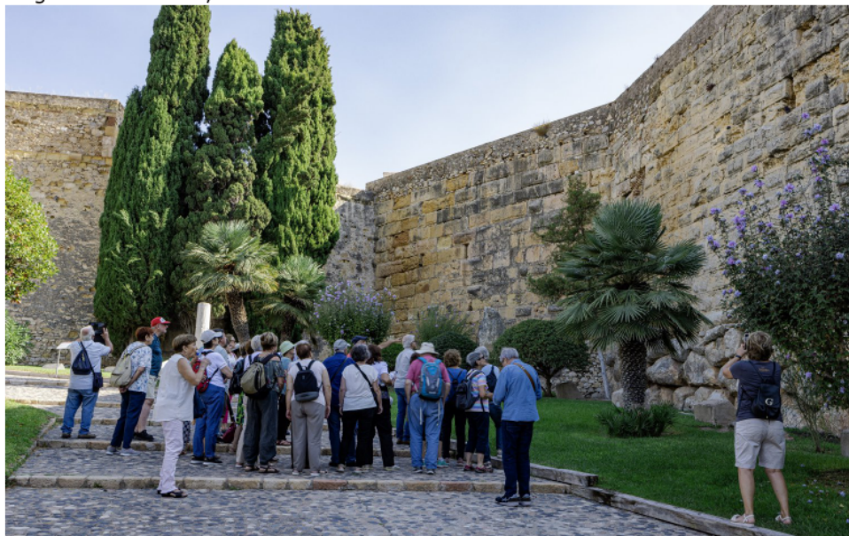
Passeig arqueològic de les muralles de Tarraco.

Tot seguit enfilem cap a la muralla i comencem a caminar una estona pel seu interior per gaudir dels carrerons estrets, alguns d'ells molt originals, de l'exterior de la Catedral i anem baixant cap al Circ Romà, actualment quasi tot ocupat per habitatges, però que amb les bones referències, ens el podem imaginar força bé.