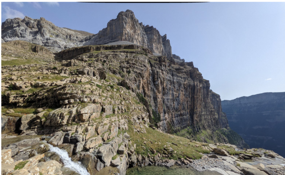
Zaratustra al Gallinero (pàg.4). Foto: Participants sortida.