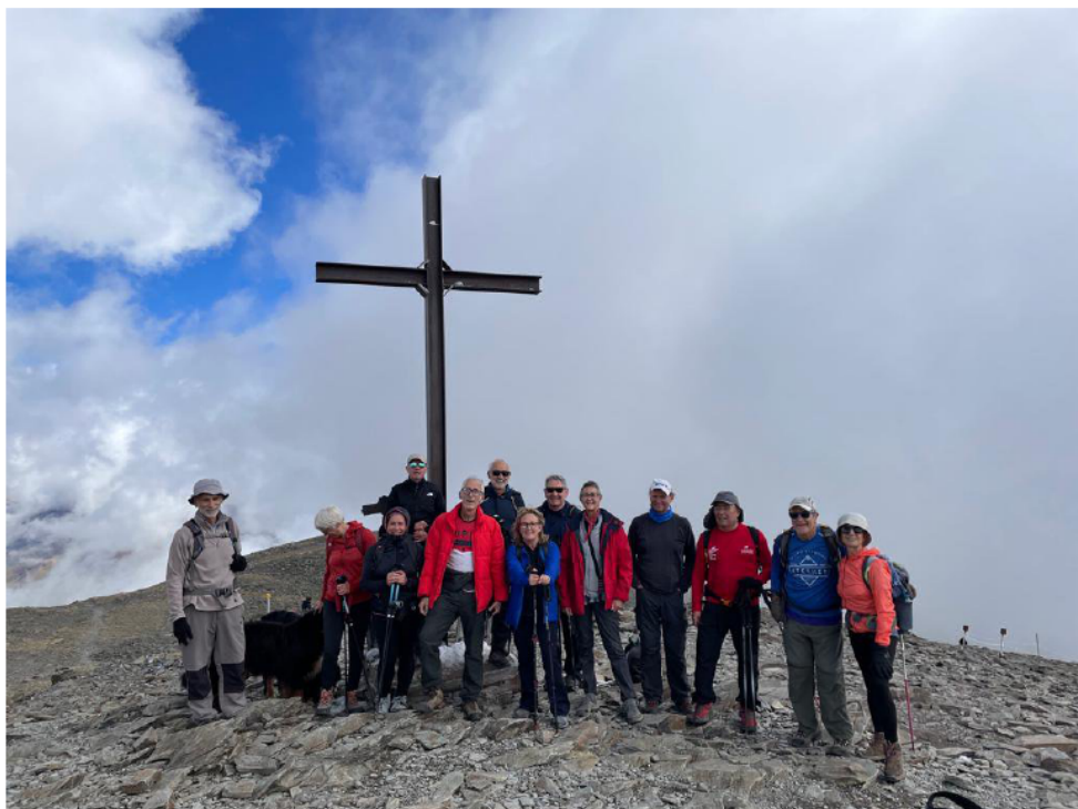
Tot el grup al cim.

P assem pel costat d'una cabana de pastor de pedra seca i de cavalls pasturant. Podem albirar de lluny un ramat de mufllons i també de cabirols. Seguim fins connectar amb el camí d'anada a un parell de quilòmetres de l'inici i arribem al refugi on ens espera l'autocar.