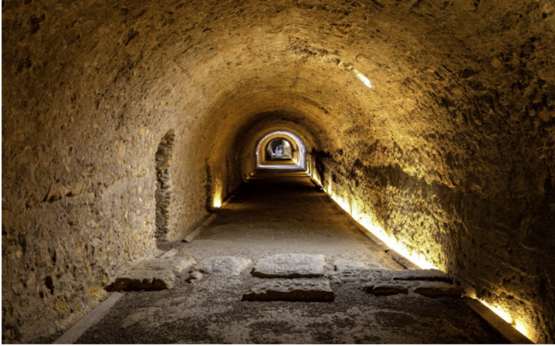
Passadís interior del Circ.

E l seu interior ens deixa bocabadats per l'immillorable estat de conservació: grandiosos túnels on ens podem imaginar com es preparaven les curses de quadrigues.