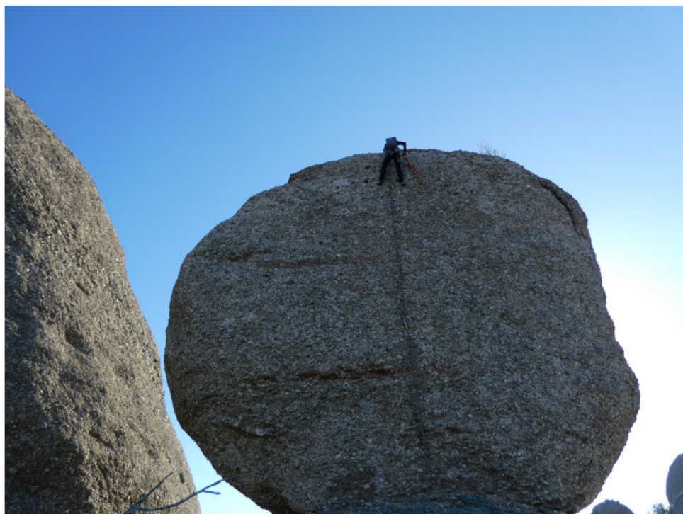
SEAM. Una gran clàssica de Montserrat (pàg.10)