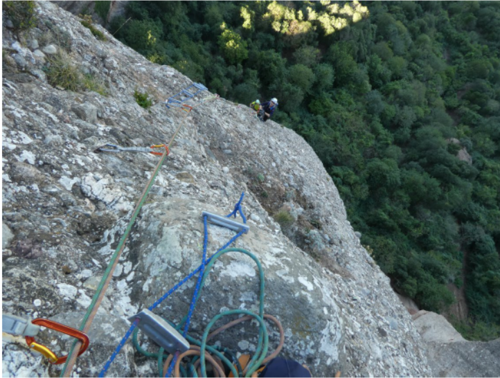
SEAM. Una gran clàssica de Montserrat (pàg.10)