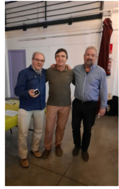
Medalles d'or. 50 anys de socis

E s va fent tard i tothom va desfilant cap a casa, però ens enduem un molt bon record de l'estona passada amb tants d'amics.