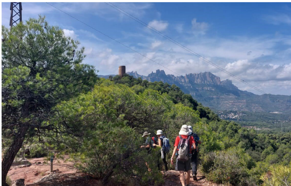
Cingles i gorgs per Vacarisses (pàg.8). Foto: Participants sortida.