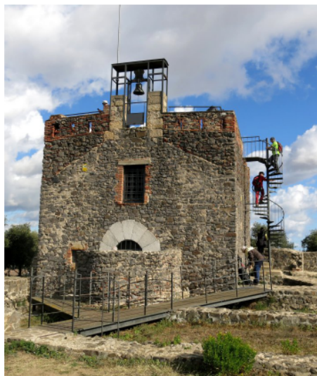
Castell de Torcafelló.

COMENTARI: Sorprèn la puntualitat dels trens amb l'absència dels "mastegues" (revisors).. Omplim els païdors al bar de davant de l'estació. Els Estanys estan sota mínims d'aigua però l'ocellada es fa palesa transitant per la "Via Augusta" fins el pont del Dimoni, a tocar del volcà, avui pedrera. Continuem per la pista fins assolir la Torre Marata, propietat particular, més endavant creuem la carretera Hostalric a Maçanet i fem el camí de pujada al castell, talaia del vescomtat de Cabrera. Un breu descans amb els tocs habituals de campana i pertoca ara prendre els