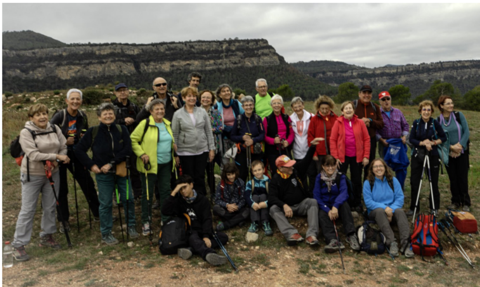
La caminada del Pessebre (pàg.7). Dalt de les Mirones.