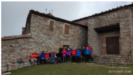
Tot el grup a l'Ermita.

La Mare de la Font és un nom que les dona a una deu de gran cabal que abasteix altres fonts. Està envoltada d'un ben arranjat parc urbà amb taules de pic-nic, ombra, aigua fresca i un llac circular que es glaça a l'hivern i el jovent hi va a patinar. Presidint la font es troba una estrofa del poema "Canigó" de Verdaguer que diu així: Per què t'amagues, Camprodon Fresquívol, violeta del bosc en ta ribera? En ton sojorn d'eterna primavera. No vols que senten tes suaus olors? Poncelles, ja us veuran quan siau flors. Jacint Verdaguer, Canigó, cant.