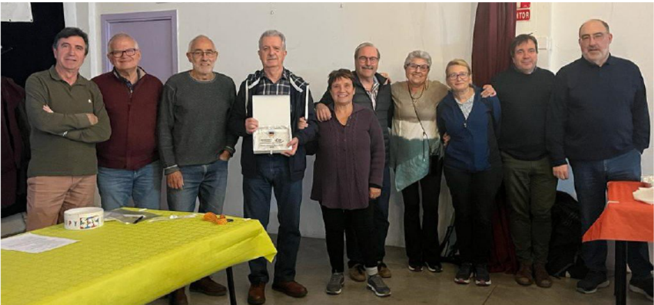
Premi de la Junta a la Comissió Organitzadora de la Ribalera