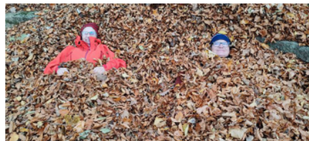
Gaudint de la tardor.