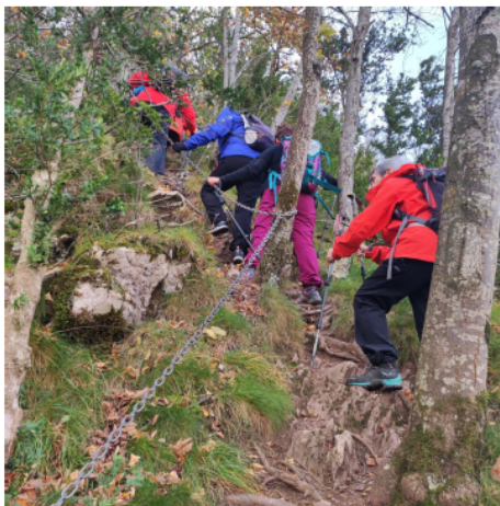
Pujant amb les cadenes.