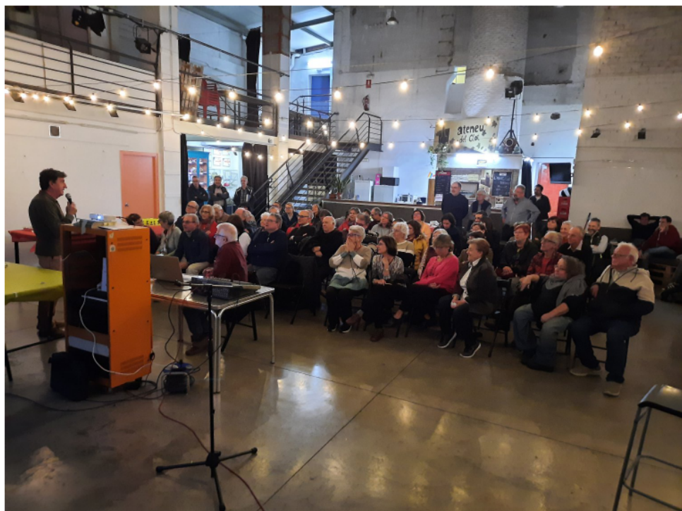
Diada del Soci 2023 (pàg.4) La sala de l'Ateneu ben plena.