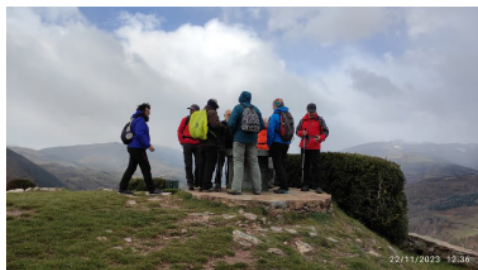
Cim de Sant Antoni

Així comença la ressenya de la sortida d'aquest dimecres 22 de novembre.