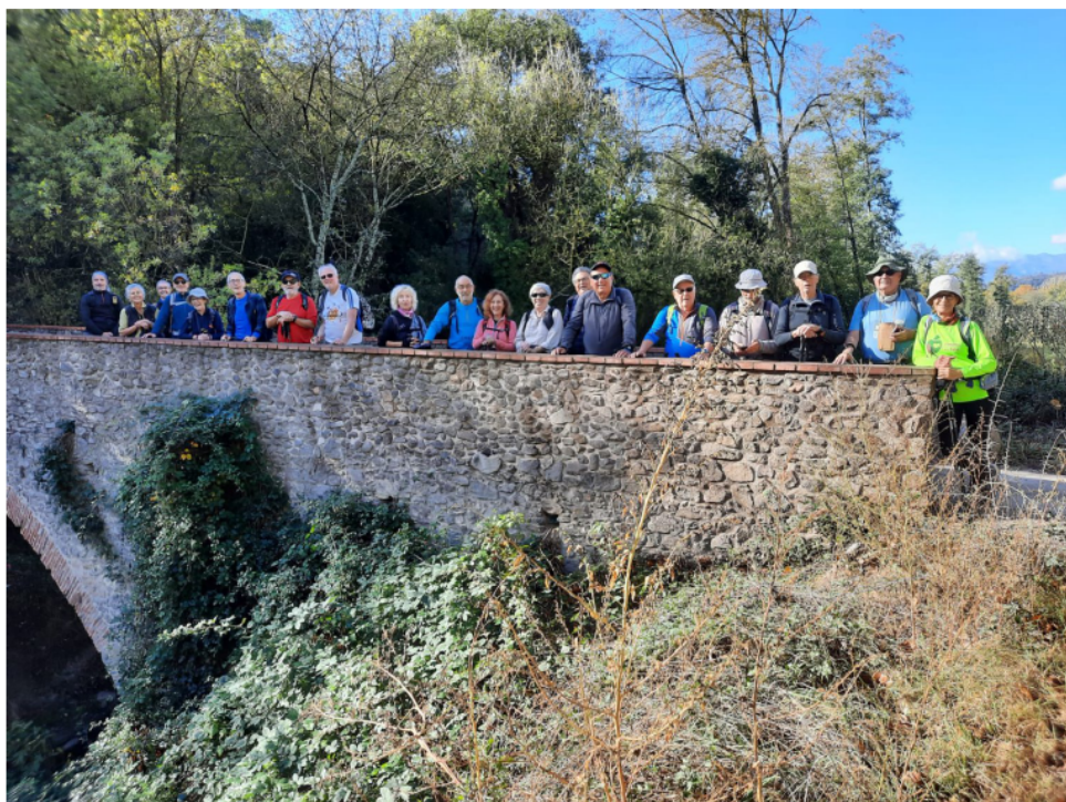
TTT. Guilleries - La Selva (pàg.10) El grup al Pont del Dimoni.