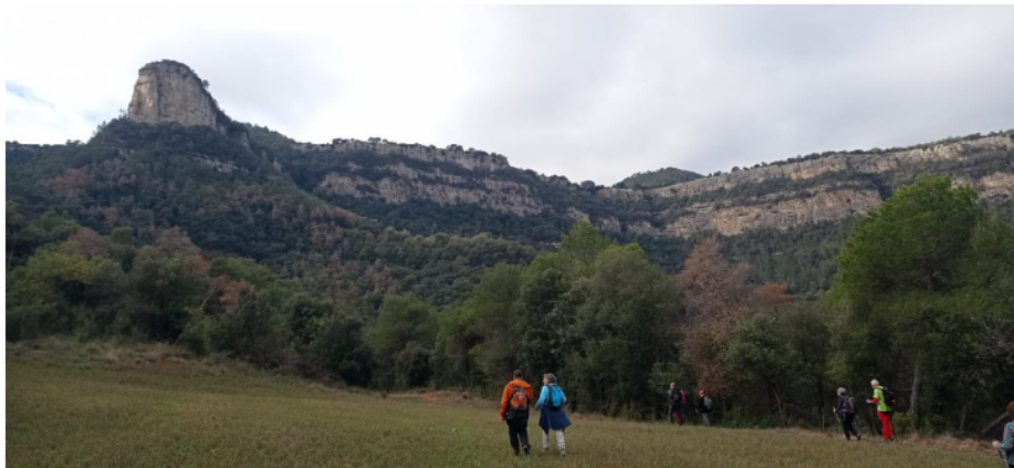
Caminant amb vistes a la Trona.

Després de fer un esmorzar ràpid al bar de l'estació d'Aiguafreda, on ens ha deixat l'autocar del Pessebre, comencem la caminada cap a Valldeneu, seguint l'ampla carretera, primer asfaltada i més endavant de terra.