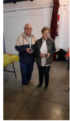
Medalles de plata. 25 anys de socis.