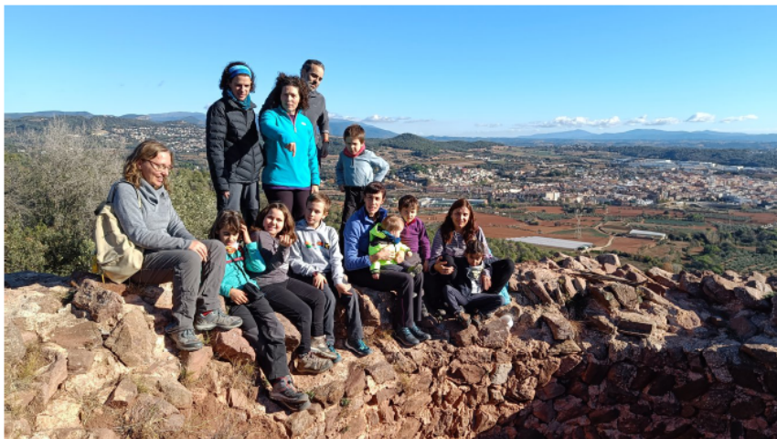
Famílies a Caldes de Montbui. (pàg. 5) Dalt de la Torre Roja.