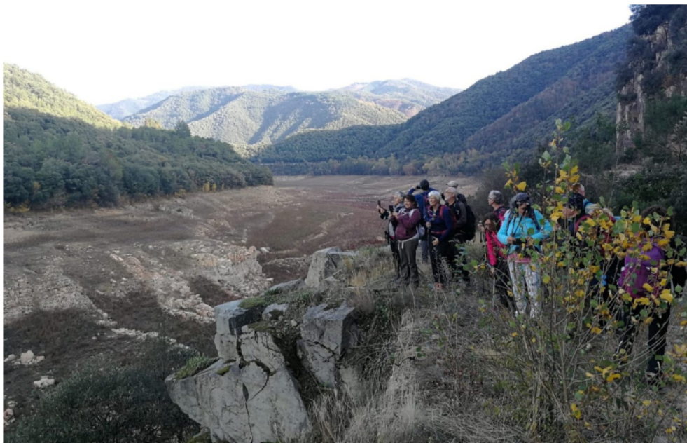
El Pantà de Susqueda ben buit (pàg.6).