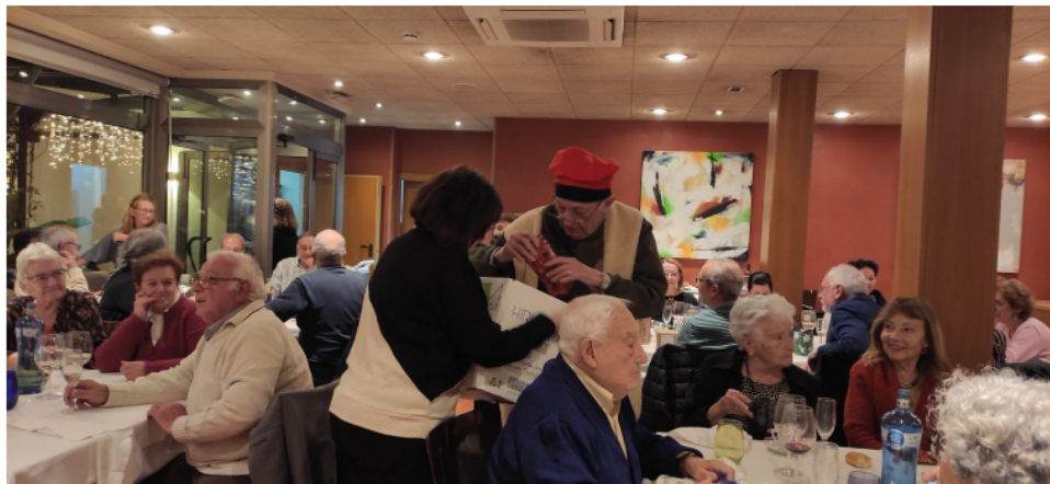
El pastoret Planas repartint els regals del Tió

Al costat del Tió hi ha un munt de paquets ben embolicats. Són les aportacions d'uns quants socis, que es sortejaran entre tots els presents. Abans de començar a sopar