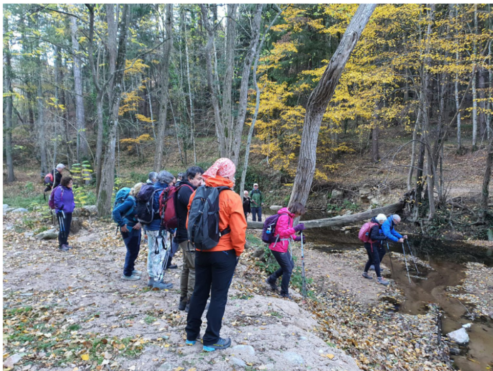
Guilleries Ruta d'en Serrallonga (pàg.6) Creuant la Riera d'Osor