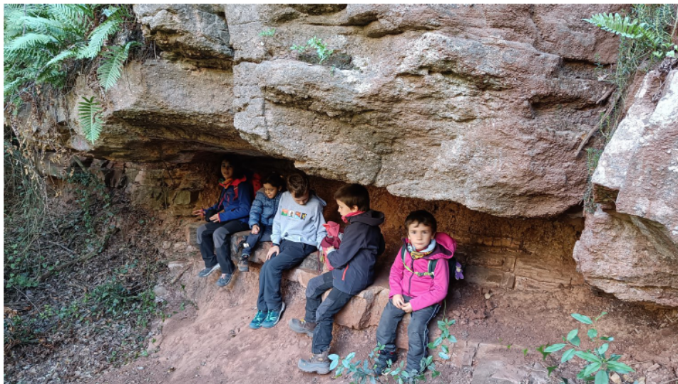
Balma vora el gorg dels Pèlags.

El dissabte 2 de desembre a les 10 del matí al pàrquing de la zona esportiva de Caldes de Montbui feia solet, però el vent era fred. Cinc famílies valentes vam decidir assaltar la Torre Roja, la pujada era dura, la Font de les Escales era seca, i el roure gros havia perdut ja totes les fulles.