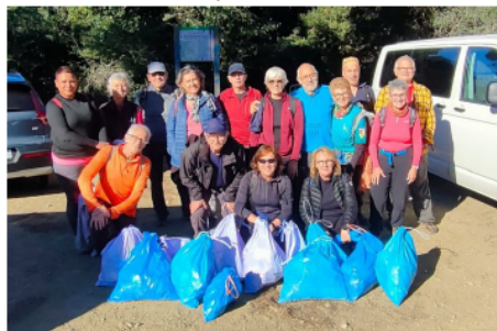
Tots els grups a Vista Rica

M alauradament el nombre de voluntaris ha resultat ser inferior al d'altres edicions, però no ha estat impediment per passar una bona estona entre companys mentre es fa una tasca positiva.