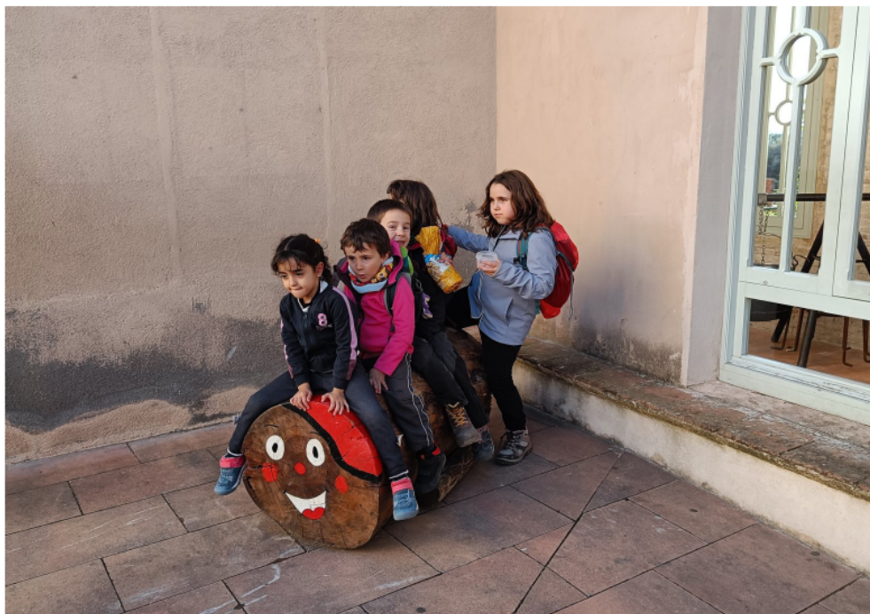
Famílies a Caldes de Montbui (pàg.5) El Tió.