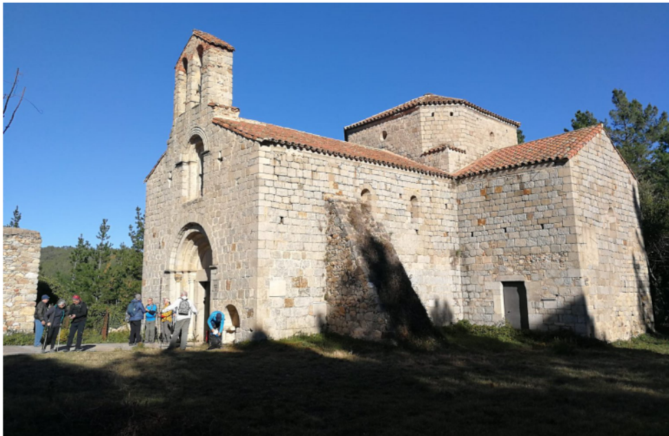
Excursió a l'Argimon (pàg.9). Sant Pere Cercada.