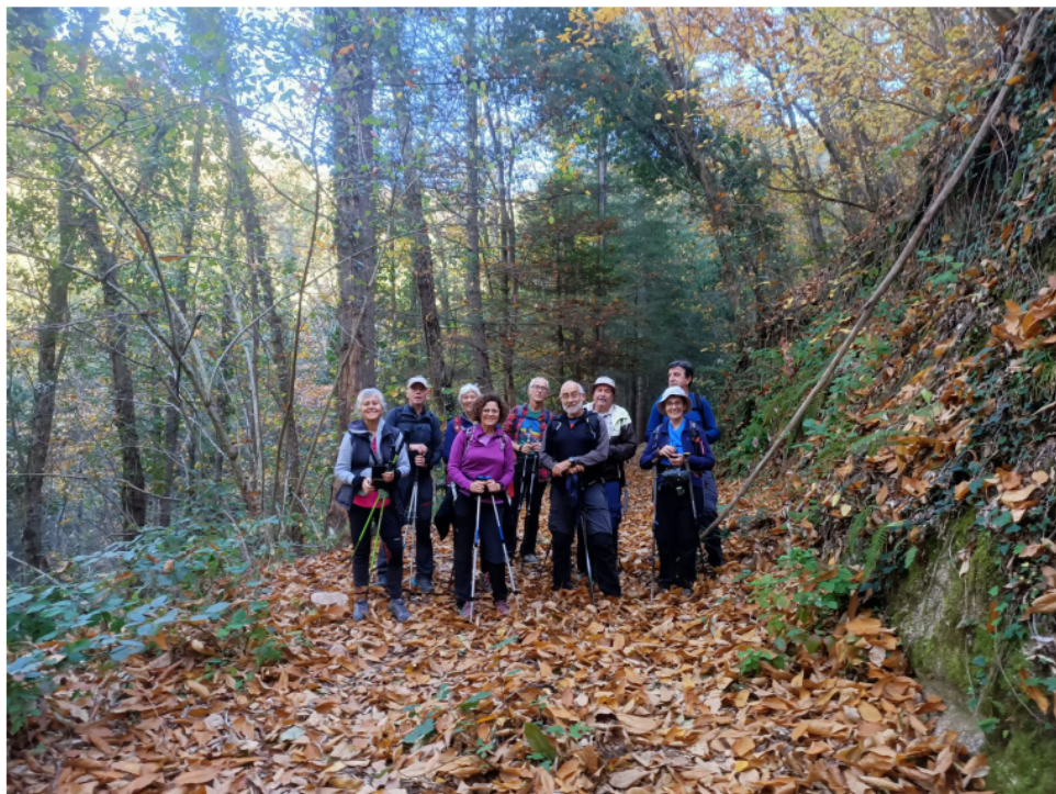
Baixant cap al Pantà de Susqueda.