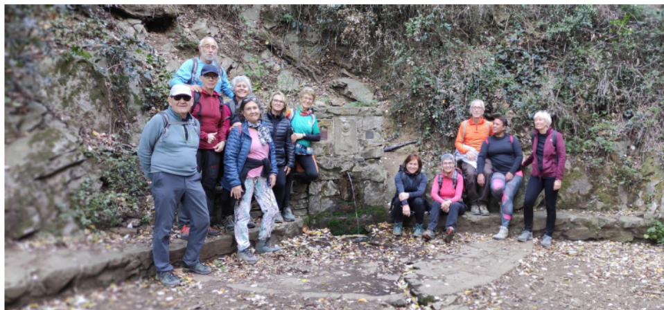
De baixada a Barcelona parem a la Font del Bacallà