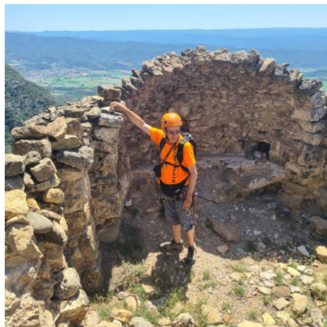
Ermita de Sant Salvador

V am recollir-ho tot i vam anar cap a Ponts per menjar alguna cosa, i en arribar amb 35°, ja vam comprovar que havien encertat amb les previsions. En el menjar parlant de l'activitat, a part de la poca ombra en estar en ple estiu, comentem que encara que aparentment és una via fàcil, cal parar atenció amb qui s'hi va, ja que els nombrosos flanquejos i la qualitat de la roca en algun tram, fa que calgui anar com amb molta precaució. Per descomptat que el millor és a l'entorn on està ubicada i felicitar els seus aperturistes.