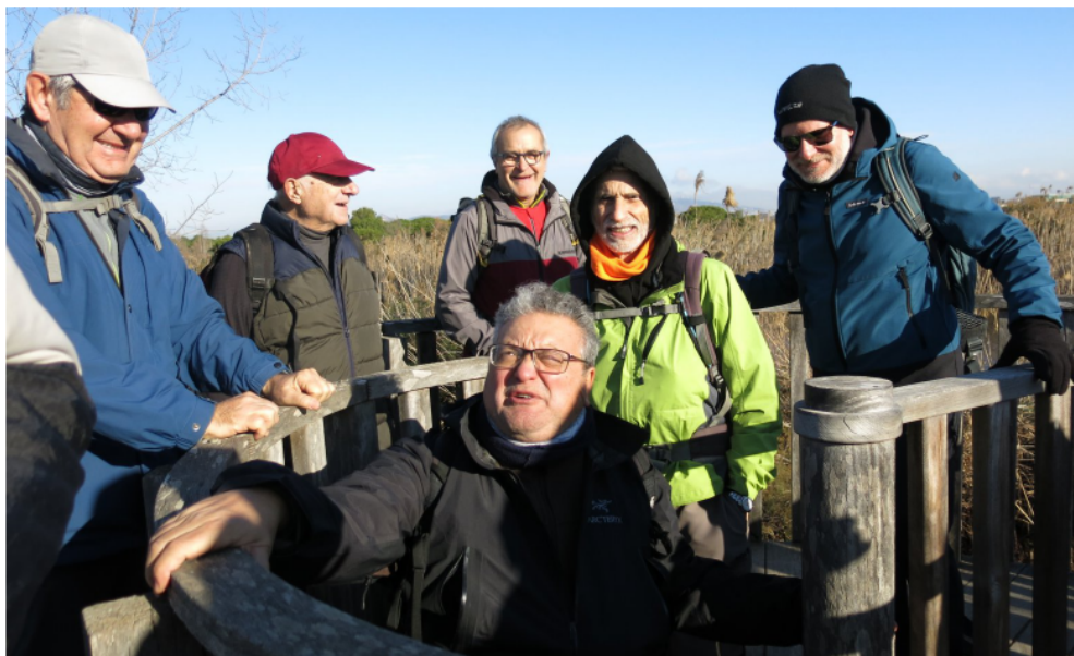
TTT. Delta del Llobregat (pàg.9) Torre d'aguait.