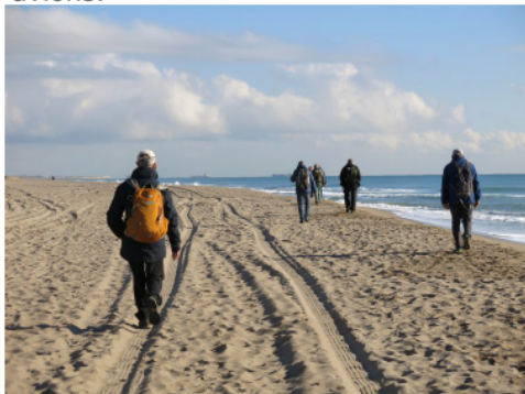
Caminant per la platja.

A vui no hem fet desnivell, però hem caminat un munt de kilòmetres (uns 24 aprox.) i agraïm poder seure tot esperant el metro, mentre comentem com hem gaudit coneixent tota aquesta zona, tan interessant pels elements paisatgístics i de natura que conté, com curiosa per la proximitat de l'aeroport i el vol constant dels avions.