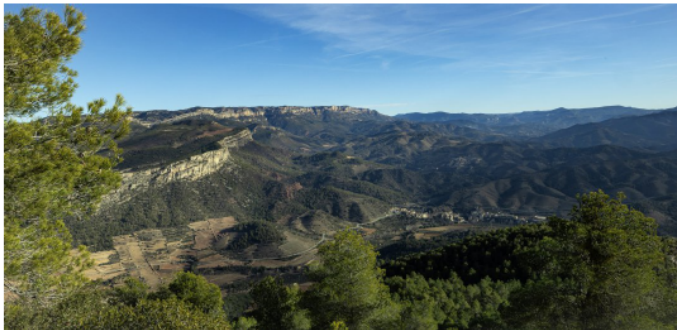
Vistes a la Serra del Montsant.

S erien a prop de les 5 h. que tiràvem avall. Encara hi havia claror, i vam poder gaudir d'un paisatge fantàstic. La llàstima va ser la calor que vam haver de patir durant el viatge. El xofer de l'autocar, va explicar que havia de dur la calefacció posada per tal de que no se li entessin els vidres i vam arribar a Barcelona, amb moltes ganes de sortir a prendre l'aire, això sí, molt satisfets de l'experiència viscuda.