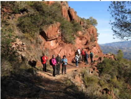
Camí dels Rogerals.

Vam sortir de l'Agrupada en autocar, érem un grup de 30 socis. De bon començament ens vam trobar amb el problema de que el portamaletes no s'obria, estava espatllat, i vam haver de carregar amb les motxilles a dins l'autocar. El desplaçament era llarg, així que ens vam aturar a un Restaurant de mig camí a esmorzar. En acabat, ens vam endinsar al bell mig del Priorat fins arribar a La Figuera, un poble situat a 575 metres d'altitud, sobresortint del seu entorn de terres conreades de vinyes i oliveres disposats en treballats bancals, degut a la formació irregular del terreny.