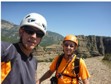
Al cim Roca de l'Ermita.

A ccés i aproximació: Seguir la pista que surt de Peramola cap