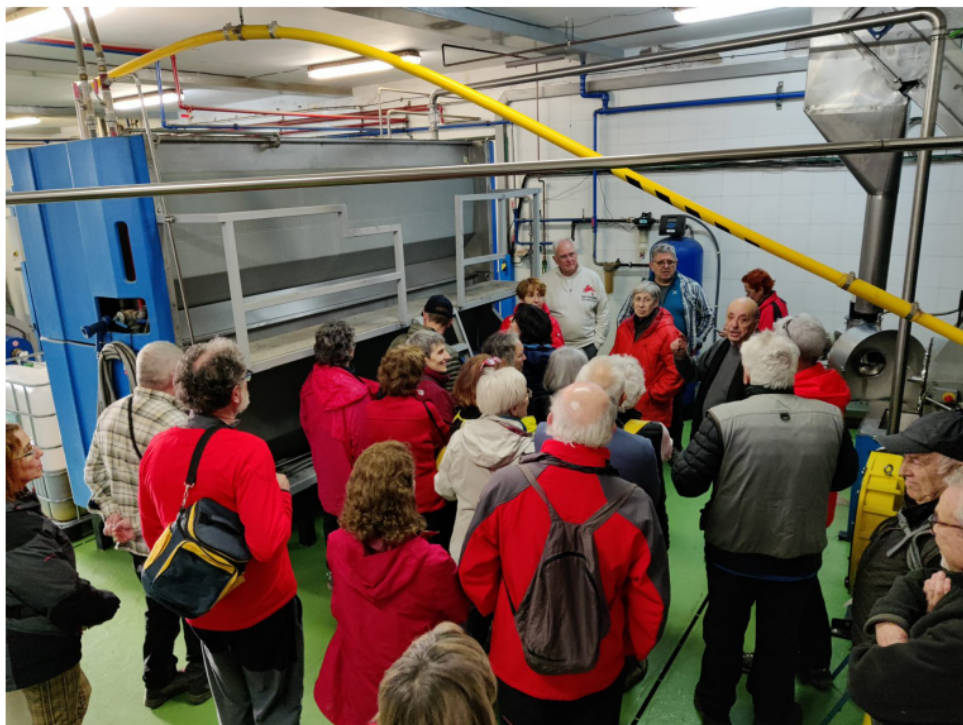
Visita a la Cooperativa Agrícola de Cabacés (pàg.6)