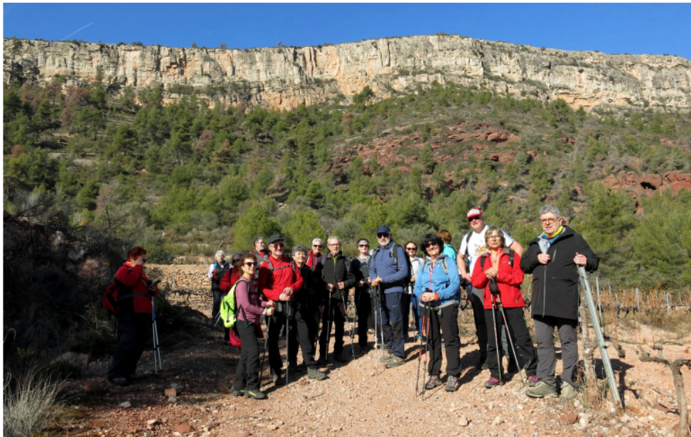
Excursió a la Figuera - El Lloar (pàg.4).