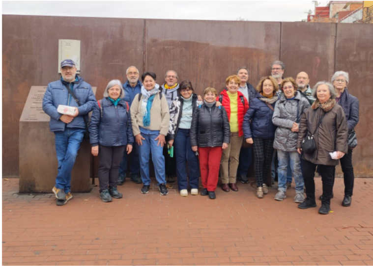
Cultura. De la Forca de la Boqueria a la Quinta Forca (pàg.15)