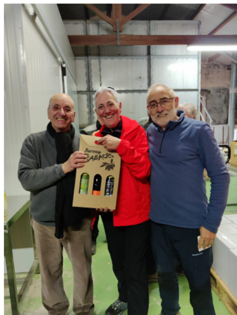
El sorteig de l'oli i el vi.

B arrejant el primer i el segon se n'obté l'oli d'oliva comercial i apte pel consum que trobem als supers de marques generalistes i que te una acidesa \leq 1%