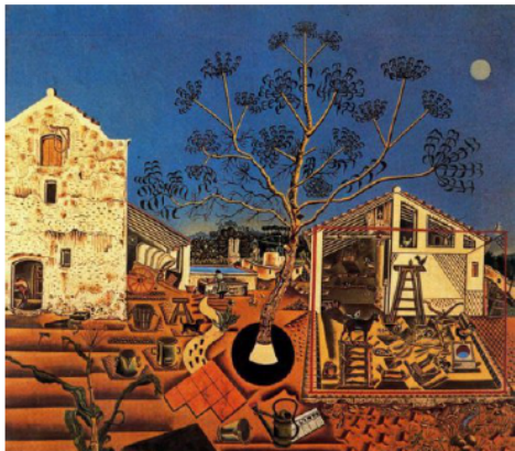
"La Masia", de Joan Miró.

roig del Camp, antiga casa d'indians ara la finca Mas Miró, on troba la tranquil·litat, la llum i la Pau que s'esmerça per copsar en un dels seus primers treballs, The Farm (La Masia), on reflecteix la vida camperola que s'hi va trobar: