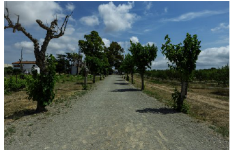
Arribada al Mas Miró.

Com que anàvem bé de temps, passem una estona voltant pels carrers i centre vila de Mont-roig del Camp. Visitem l'antiga església ara convertida en centre cultural i d'informació turística dedicat íntegrament a Joan Miró.