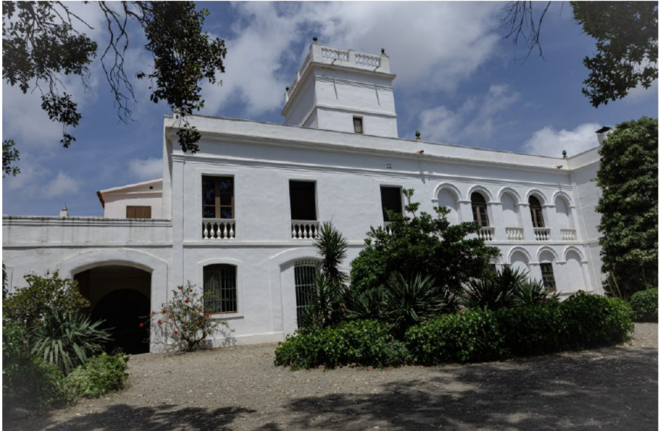
El Mas Miró.

Com que anàvem bé de temps, passem una estona voltant pels carrers i centre vila de Mont-roig del Camp. Visitem l'antiga església ara convertida en centre cultural i d'informació turística dedicat íntegrament a Joan Miró.