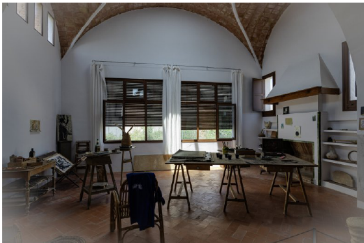
El taller de Joan Miró a la masia.

Visitem les estances del Mas: El menjador, la cambra amb el llit de la tieta, la cuina... per acabar el recorregut a la capella exterior i al seu Taller.