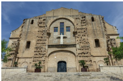
L'antiga església de Mont-Roig.

E ns enfilem tot seguit cap a l'ermita de Sant Ramon de Penyafort i jo no puc deixar de pensar, de sorprendre'm per l'esforç, la feina dels picapedrers esculpint els esglaons en la pedra sorrenca de color roig, tots ells tan simètrics i rectes picats a mà i amb els mitjans que disposaven els primers anys del segle XIII, és a dir una escarpa, un martell i poca cosa més.