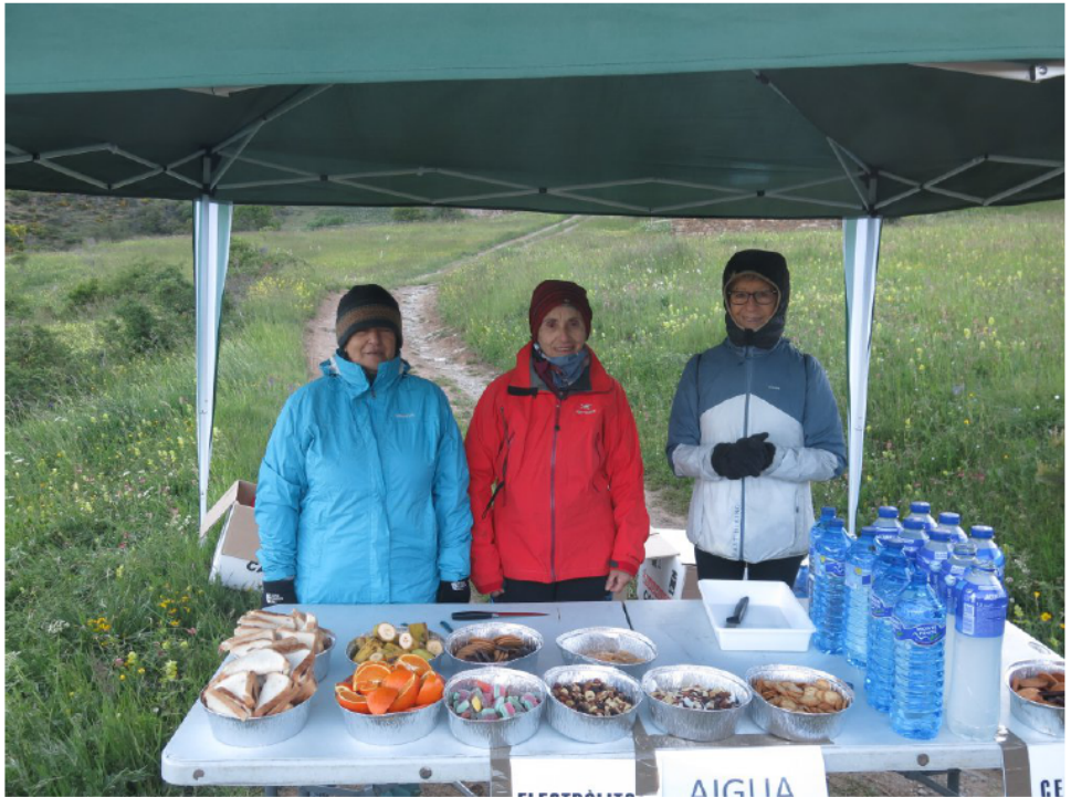
A primera hora als controls es passa fred.

material sostenible, barra de bar a la plaça, festa i música a la tarda del dissabte, etc.