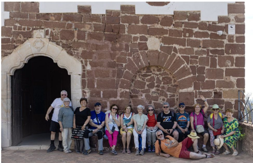
Cultura. Mont-roig del Camp (pàg.10) Ermita de Sant Ramon de Penyafort.