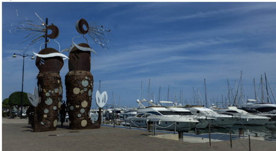
El port de Cambrils.

Del Mas Miró anem a Cambrils, a la Fonda / Rest. Montserrat.