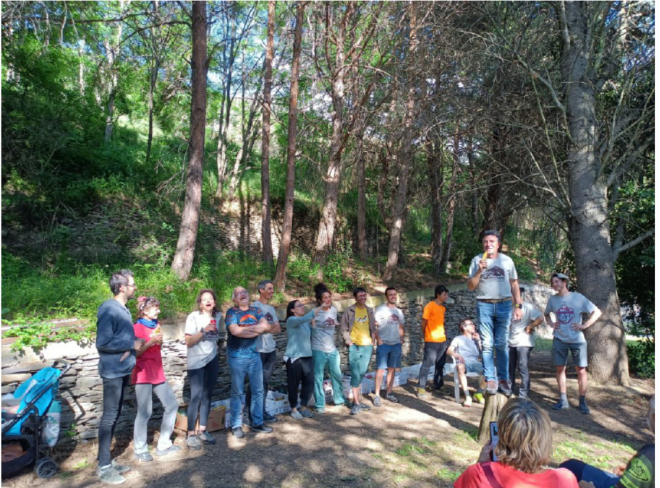
Després del dinar, el president agraeix la feina a la nova organització.