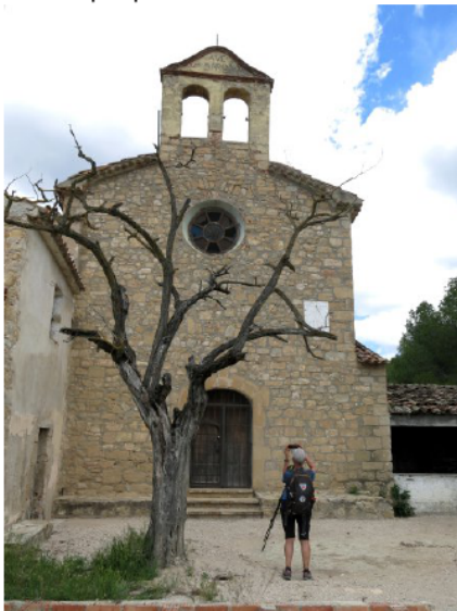
Ermita de Collbàs.