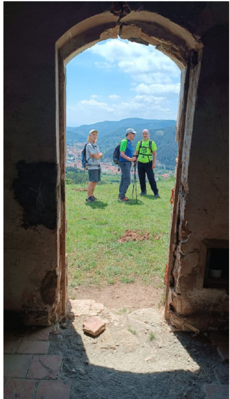
Des de l'ermita de Sant Roc, amb Ripoll al fons.