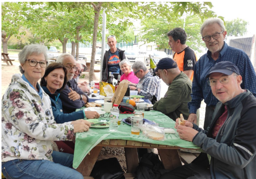
Dimecres al Sol. Esgavellats i Ermita de la Mare de Déu de Collbàs (pàg.4) El dinar.