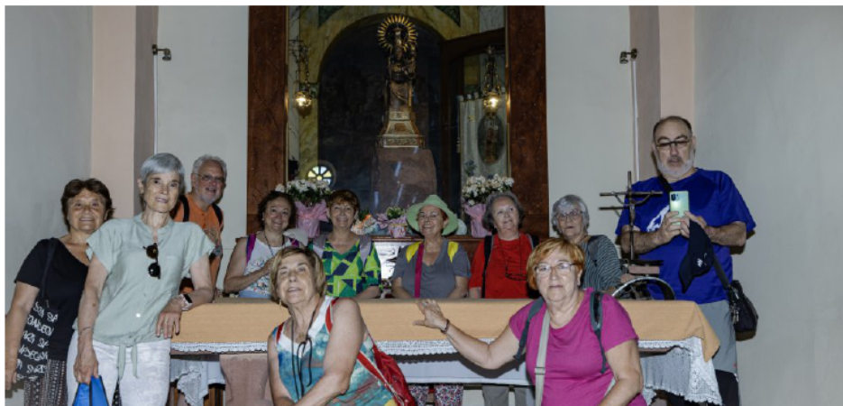
Ermita de la Mare de Déu de la Roca.