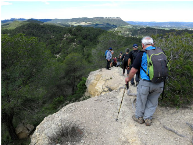
Per la carena.

I ara ja toca anar tancant el cercle. Anem baixant en direcció nord, cap a Can Bernades i seguint per una ampla pista, arribem finalment al túnel per on hem començat la caminada.