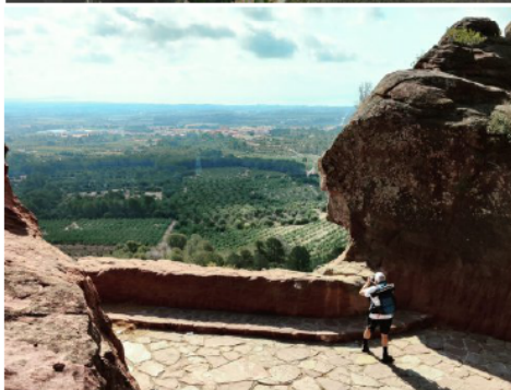
Vistes des de l'ermita de la Mare de Déu de la Roca.