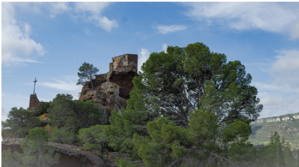
Ermita de Sant Ramon

E ns enfilem tot seguit cap a l'ermita de Sant Ramon de Penyafort i jo no puc deixar de pensar, de sorprendre'm per l'esforç, la feina dels picapedrers esculpint els esglaons en la pedra sorrenca de color roig, tots ells tan simètrics i rectes picats a mà i amb els mitjans que disposaven els primers anys del segle XIII, és a dir una escarpa, un martell i poca cosa més.