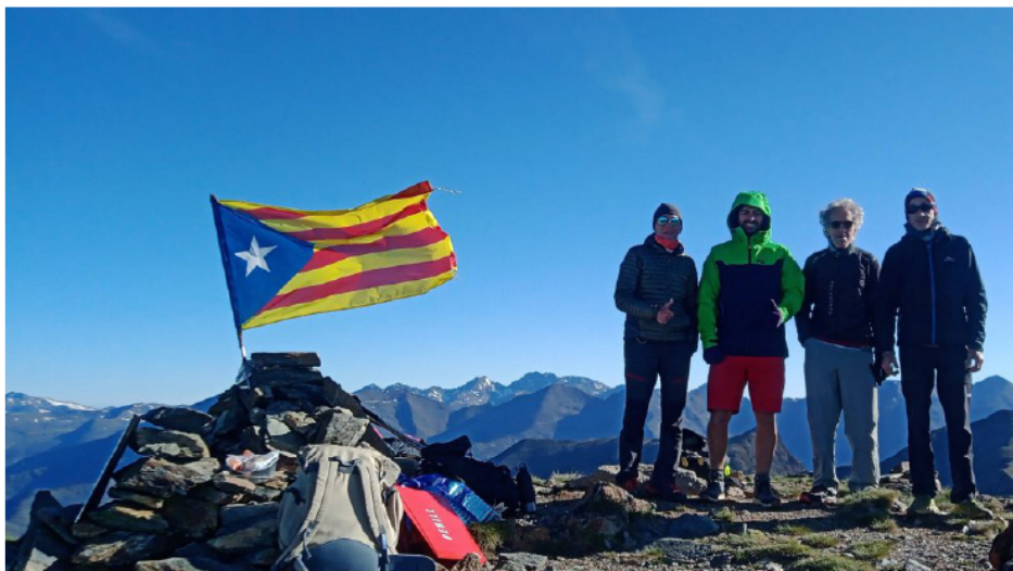
La Ribalera 2024 (pàg. 15) Control al cim del Salòria.