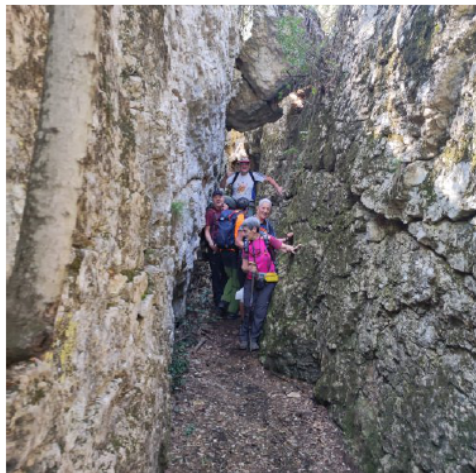
Dins de l'esclatxa.

A partir d'aquí, tornem a pujar de valent cap a la Serra de Collbàs, fins a arribar a l'Ermita de la Mare de Déu de Collbàs, situada en un lloc ben bonic i amb un magnífic mirador. Aquí s'imposa una paradeta per reposar, beure i picar quatre ganyips.