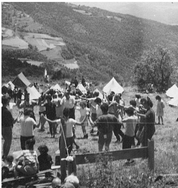
Sardanes a Font Martina.

qualitat, fins i tot gaudim d'una actuació de'n Josep M a Espinàs, membre dels Setze Jutges. El dilluns la nostra Secció d'Esquí organitza una gimcana prou complicada i "contorsionadora". A la tarda hi ha el repartiment de premis i la clausura del Campament, gran cantada dels Adéus. Ens quedem a desmuntar cartells i tendes i baixem fins La Costa del Montseny, d'on l'autocar ens duu a Sant Celoni; el tren especial ens espera per dur-nos a Barcelona. Molt important, molt bonic, per a recordar. Jo hi vaig ser !