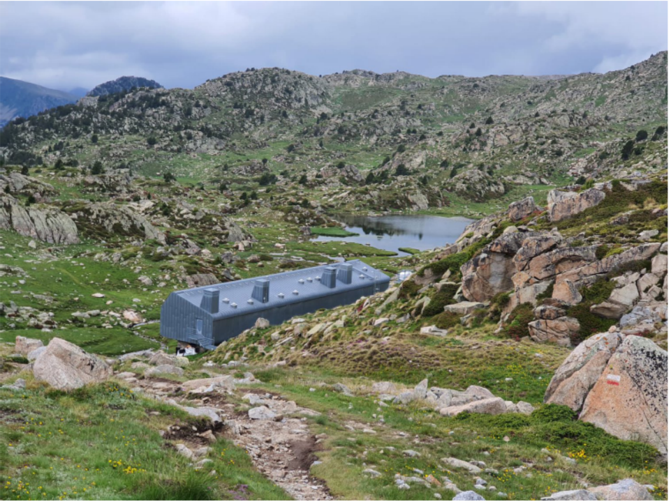
Refugi de l'Illa.

P er sort no en fa cap més (potser ens han volgut donar un avís per a que no ens encantem...) Un cop superat el pas Alt de Ribuls. manca encara un tram de flanqueig fins a trobar el GR, que baixa de la Portella de Pessons i que ja no deixem fins al refugi.