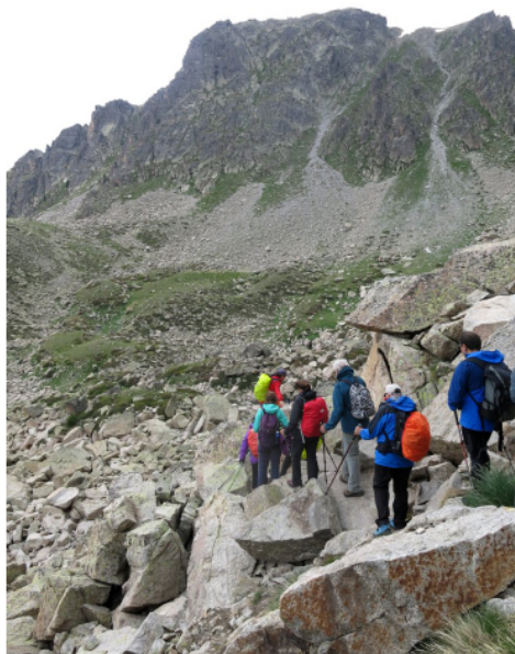
Cercant el camí entre els blocs.

Montmalús. Fem un mos i com que sembla que el temps aguanta, deixem les motxilles i fem una pujada ràpida al cim. Els que anem més a poc a poc