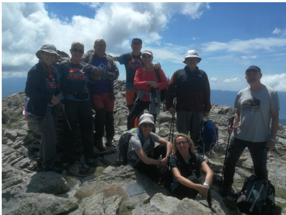
El grup al cim del Puigpedrós.

Acabem de fer els darrers metres de descens i arribem als cotxes on podem fer el retorn cap a casa, però abans farem una parada tècnica per poder fer un bon dinar amb companyia.