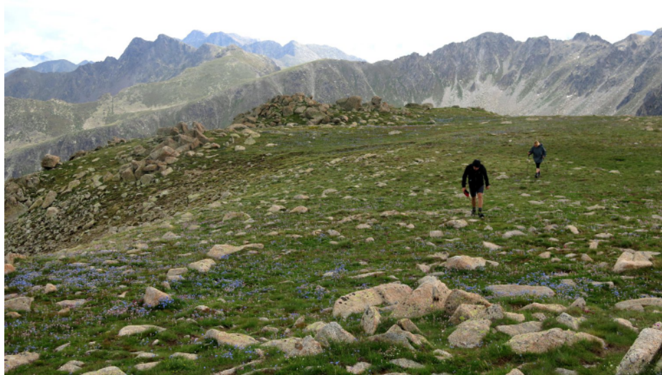
Arribant al cim del Montmalús.