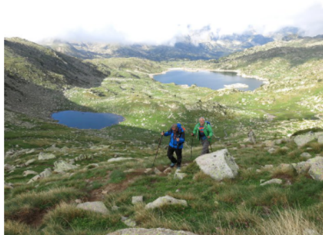
Pujant a la Portella de Pessons.