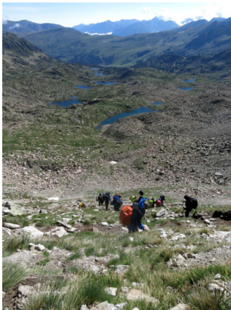
Baixant al Circ dels Pessons.