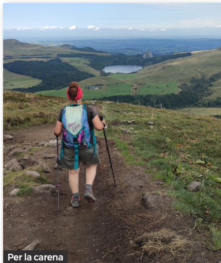
Per la carena