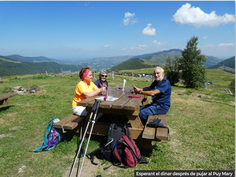
Esperant el dinar després de pujar al Puy Mary