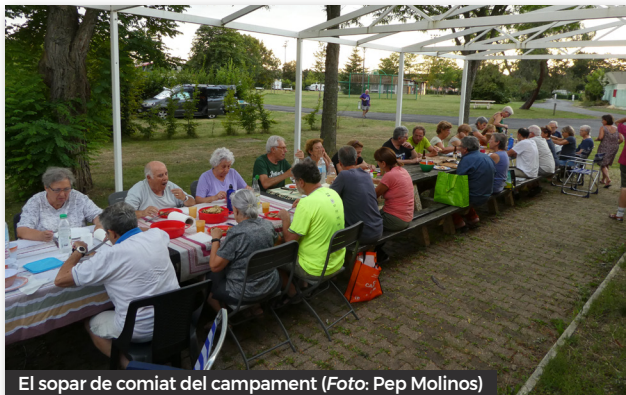
El sopar de comiat del campament

I ara fins el proper campament!!! Salut, muntanya i cultura. Visca l'Agrupar!!!