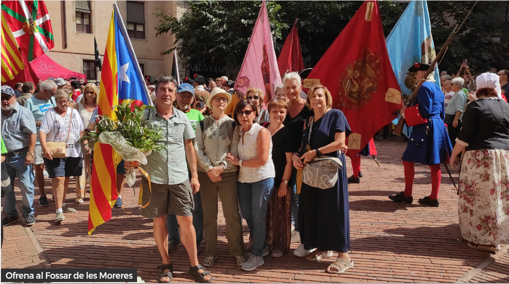
Ofrena al Fossar de les Mores