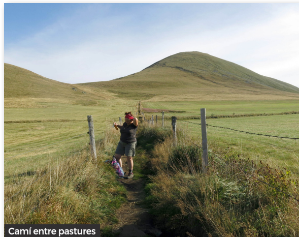
Camí entre pastures

Ha estat l'última excursió, ja que demà toca deixar el càmping i ens deixarà un bon record d'aquestes boniques contrades.