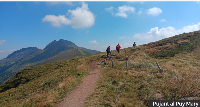
Pujant al Puy Mary

La tornada, per carretera molt verda i bonica, la fem molt distrets amb música i bon humor. Hem fet bastants quilòmetres en cotxe, però hem tornat molt contents. Una jornada completa.