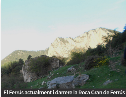
El Ferrús actualment i darrere la Roca Gran de Ferrús

La paret devia el seu nom a una masia (El Ferrús), que en aquella època sí que estava habitada, però que actualment està totalment en ruïnes.