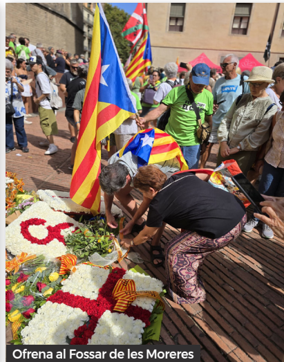
Ofrena al Fossar de les Mores