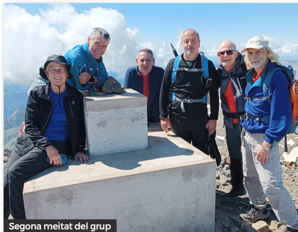
Segona meitat del grup