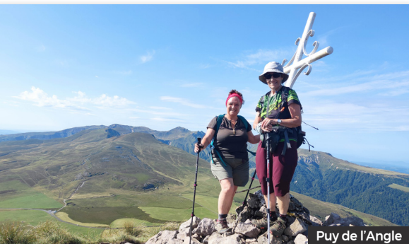
Puy de l'Angle

Tenim una bona visió de la carena que farem i que passant pel Puy de Barbier