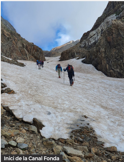
Inici de la Canal Fonda

Com que, per les característiques de l'activitat, has hagut de fer reserves d'allotjament i de transport, l'imprevist, si es presenta al darrer moment, no et permetrà anul·lar les reserves i ajornar-les. I, justament, és a darrera hora quan solen arribar les males notícies meteorològiques. El tant per cent de probabilitat d'èxit es va reduint a mesura que s'acosta la data.