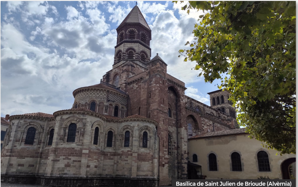
Basilica de Saint Julien de Brioude (Alvèrnia)