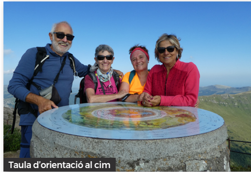
Taula d'orientació al cim

El descens el fem per la carena SE, una mica dret i entretingut, o sigui que anem fent sense presses. En arribar al coll Sud seguim per la carena fins a la Brèche de Roland, un pas que pintava "difficile", però que resulta ser una desgrimpada i posterior grimpada per a superar un tall a la serralada sense dificultat.