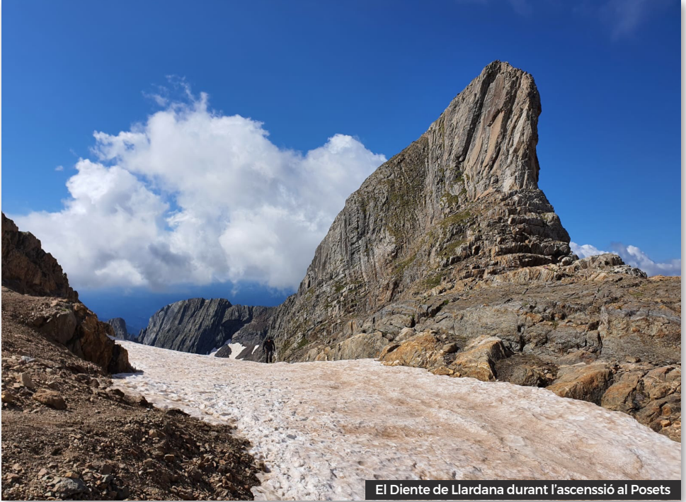
El Diente de Llardana durant l'ascensió al Posets