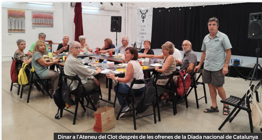
Dinar a l'Ateneu del Clot després de les ofrenes de la Diada nacional de Catalunya