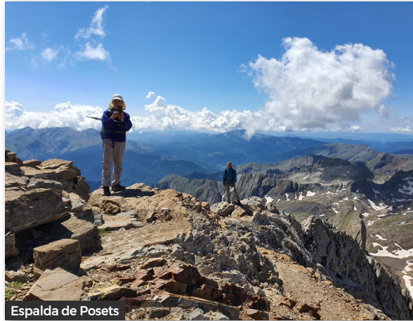
Espalda de Posets

Mentre anem guanyant alçada i acostant-nos a la meta, temem que el cel es tapi i ens aboqui un apocalipsi a petita escala, i alhora ho desitgem secretament, amb un sentiment temerari i alhora