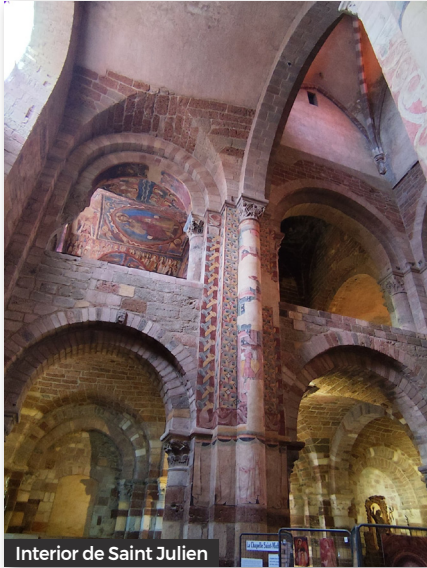
Interior de Saint Julien

que guarda l'única Verge romànica de la regió. És una de les 5 esglésies romàniques més importants d'Alvèrnia. Basílica del segle XII, joia de l'art romànic, que compta amb la Mare de Déu de la Majestat, a més a més de capitells fantàstics i d'una bonica cripta.