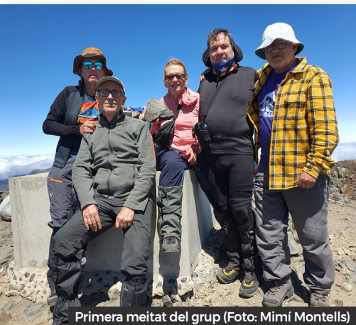
Primera meitat del grup

No anem a la muntanya a sortir-ne ben parats (tampoc a sortir-ne molt malparats, valgui la contradicció). Estem satisfets quan l'endemà ens podem "queixar" d'estar rebentats o d'haver acabat xops o masegats o tumefactes, i mostrem amb orgull mal dissimulat les nostres "ferides de guerra".