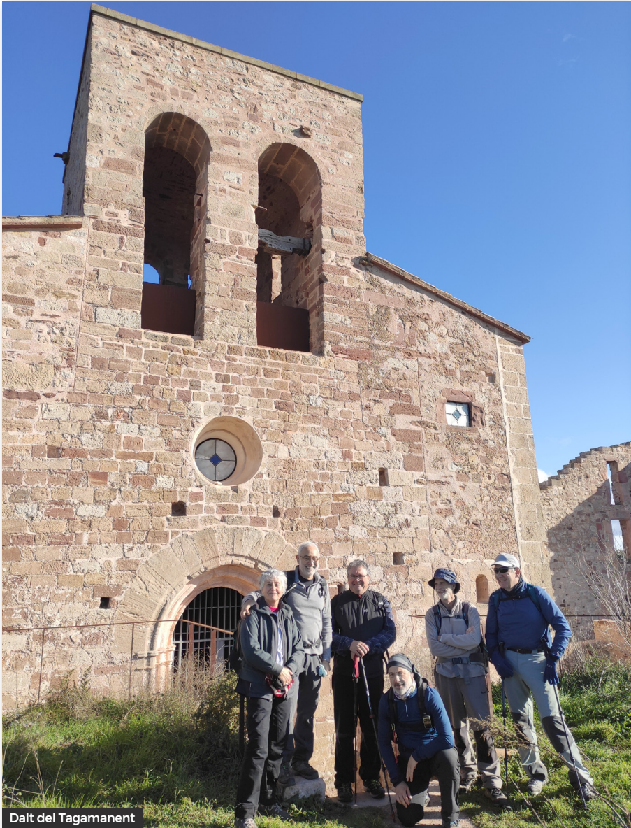
Dalt del Tagamanent

doncs potser podrem agafar un tren que ve en pocs minuts. Però Rodalies R3 és així: trenta minuts de retard. Cap problema, cap a la cantina de l'estació a fer la cervesa, i a pensar en la propera.