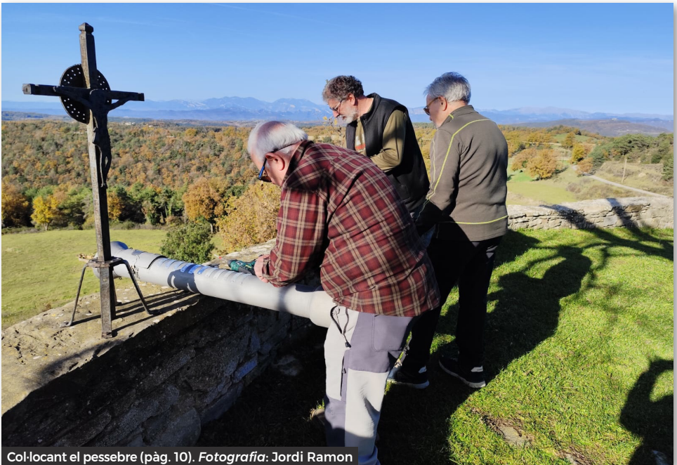
Col·locant el pessebre (pàg. 10).