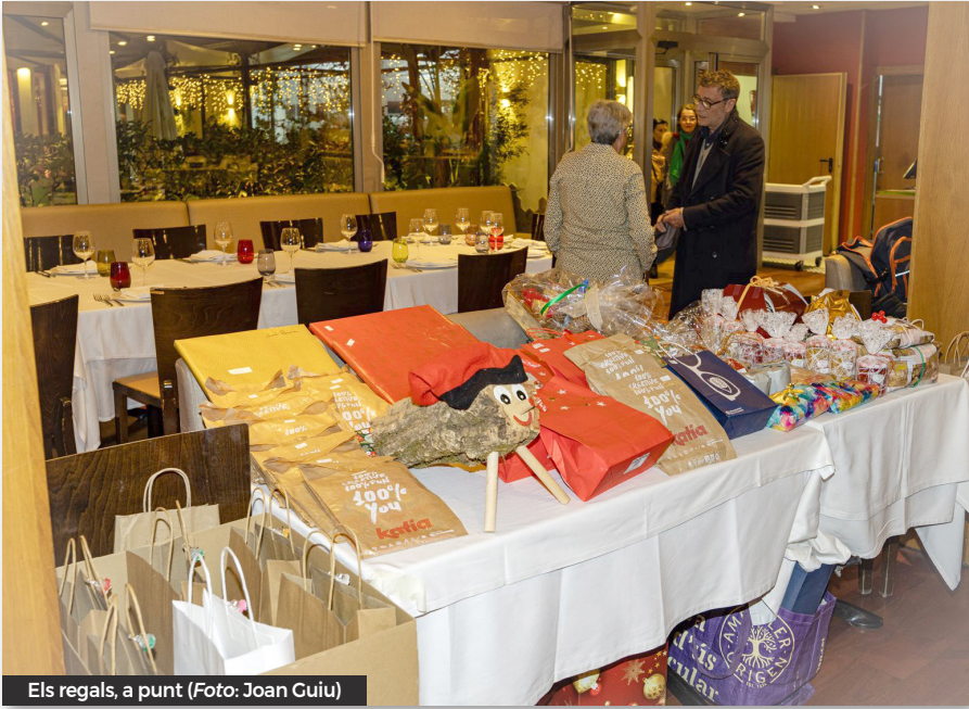
Els regals, a punt

que els amics i amigues han proporcionat, n'hi ha per tothom i encara cal repartir els que han quedat, de manera que alguns afortunats se n'emporten 2. Ara ve el sorteig de la panera, la mà innocent d'un cambrer treu el número i li toca a en Jep, tots els felicitem. Ara cal destapar els obsequis i celebrar la destresa dels autors i autores. Amb els cafès es dona el sopar per acabat, ara queda acabar les converses saludar al que no hem pogut saludar en entrar, fer petons i desitjar-los bones festes als que anem trobant, mentre anem de taula en taula. i finalment recollir el que tenim escampat i tornar a casa. Mentre desitgem tornar-nos a trobar l'any que ve.