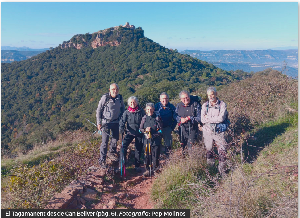
El Tagamanent des de Can Bellver (pàg. 6).