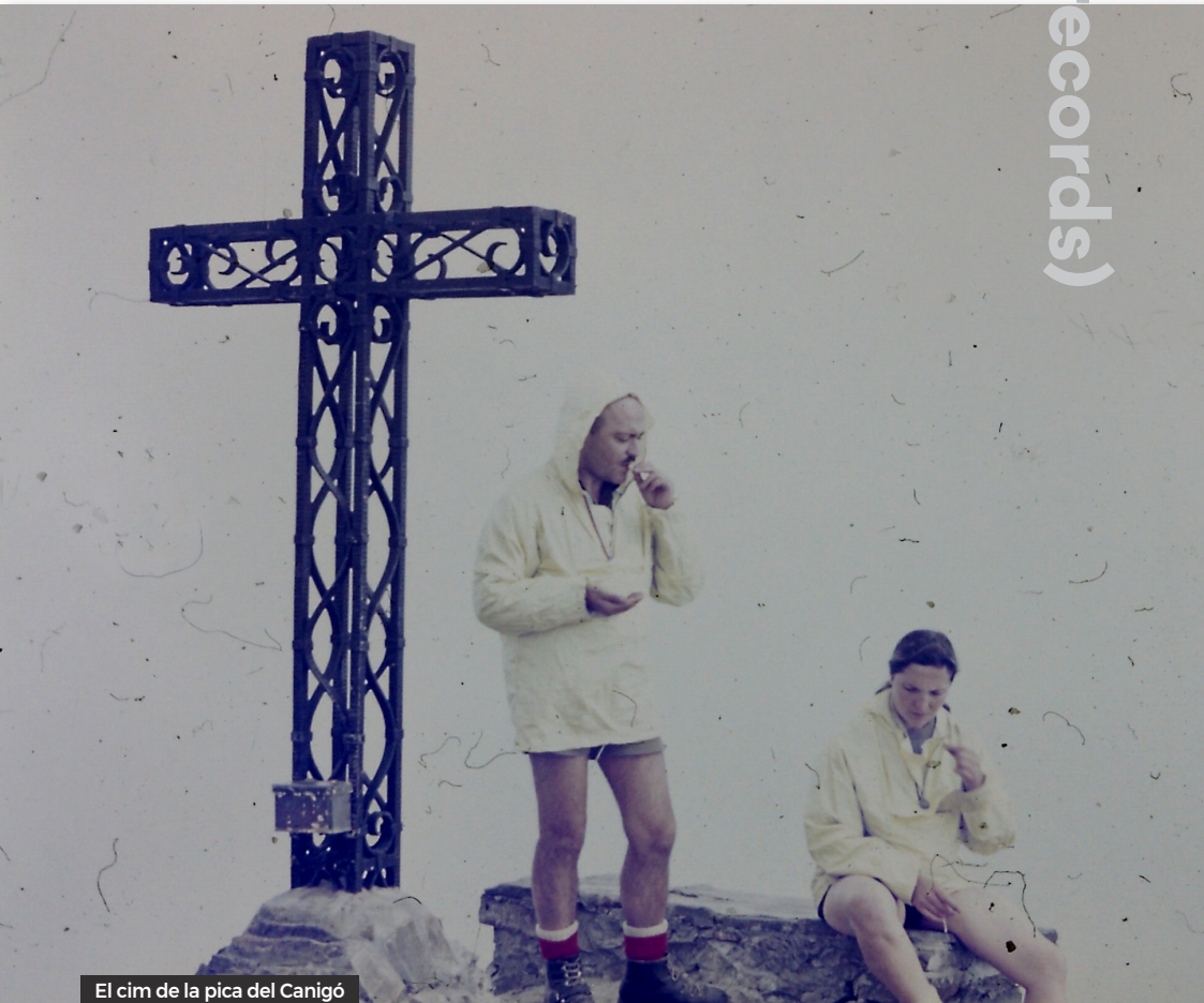
El cim de la pica del Canigó