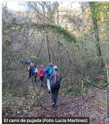
El camí de pujada

El temps va passant, ha sigut un dia fantàstic tant pel temps que ens ha acompanyat com pel caliu que s'ha generat i ja és l'hora de tornar cap a casa, tot esperant l'any vinent.