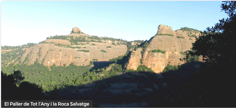
El Paller de Tot l'Any i la Roca Salvatge

on alguns components de la sortida decideixen pujar-hi.