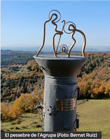
El pessebre de l'Agropa

a l'ermita per a la instal·lació del pessebre. Escollit prèviament el lloc i amb els corresponents permisos del propietari del terreny, instal·larem el pessebre a prop de la creu que hi ha davant de la portalada de l'ermita. Una llosa plana ens ha permès fer els corresponents forats per la instal·lació.