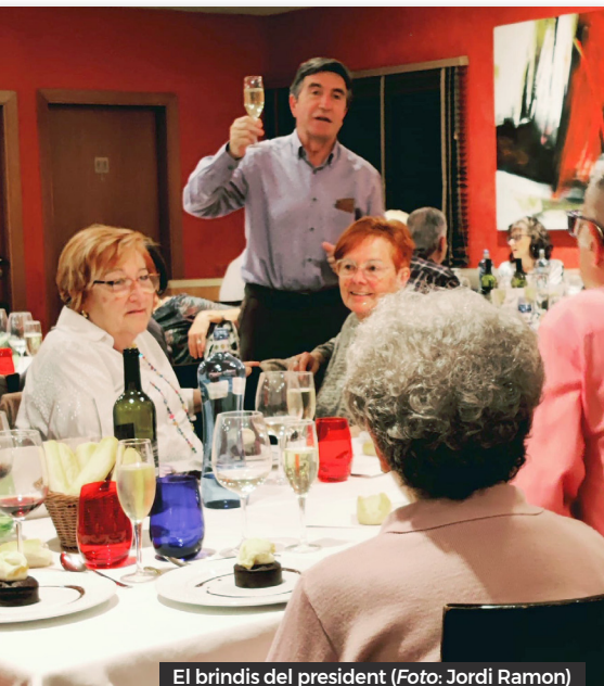
El brindis del president

Com cada any, el Pastoret Planas, apallissa el pobre Tió i ens llegeix uns poemes i escrits propis. S'inicia el repartiment de les manualitats