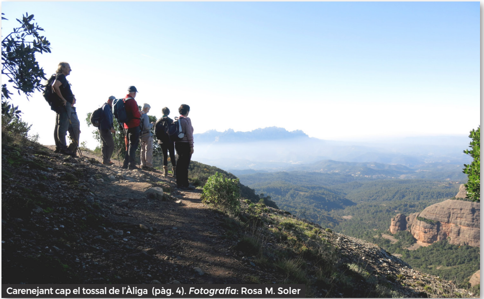
Carenejant cap el tossal de l'Àliga (pàg. 4).