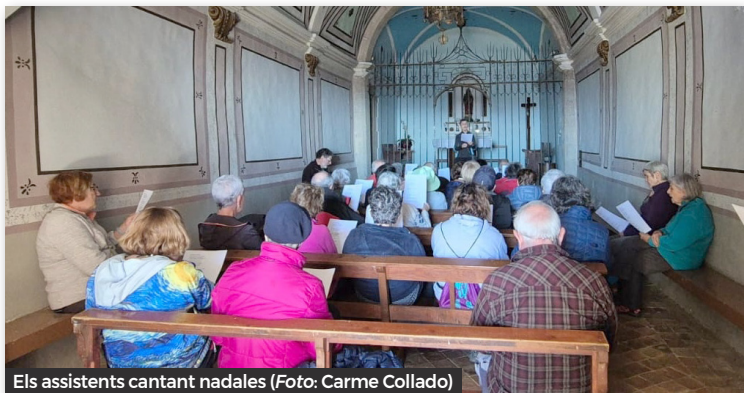
Els assistents cantant nadales

L'autocar va deixar la resta de personal