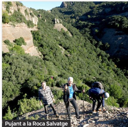
Pujant a la Roca Salvatge

https://ca.wikiloc.com/rutes-senderisme/turo-roig-paller-de-tot-lany-i-turo-de-la-mamella-des-de-aparcament-casa-nova-de-lobac-193083105