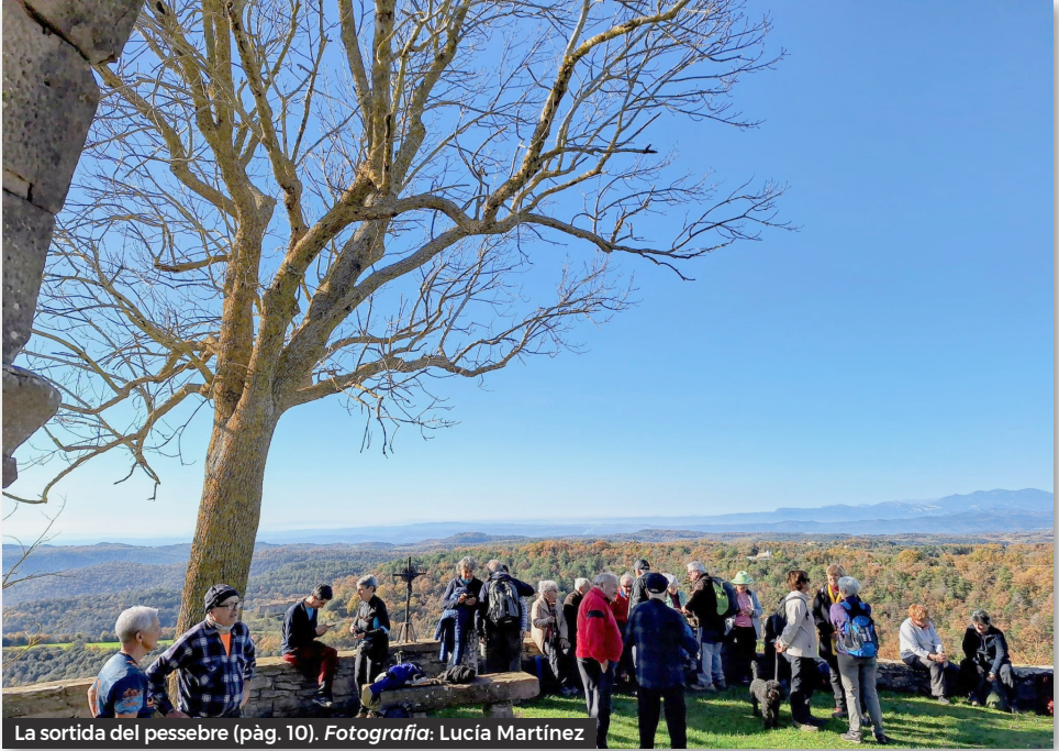
La sortida del pessebre (pàg. 10).