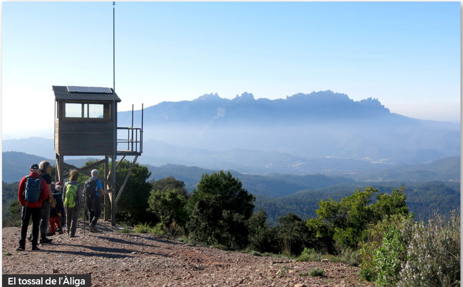
El tossal de l'Àliga

Continuem passant pel Turó Roig, un curiós pedrot on l'erosió ha deixat ben visible la paret de conglomerat. Seguim el camí per arribar a la Font de la Portella amb la seva bassa. A partir d'aquí el camí es fa més emboscats i ens enlairem fins al coll de la Roca Salvatge, un turó rocós i abrupte de 776 metres d'altura,