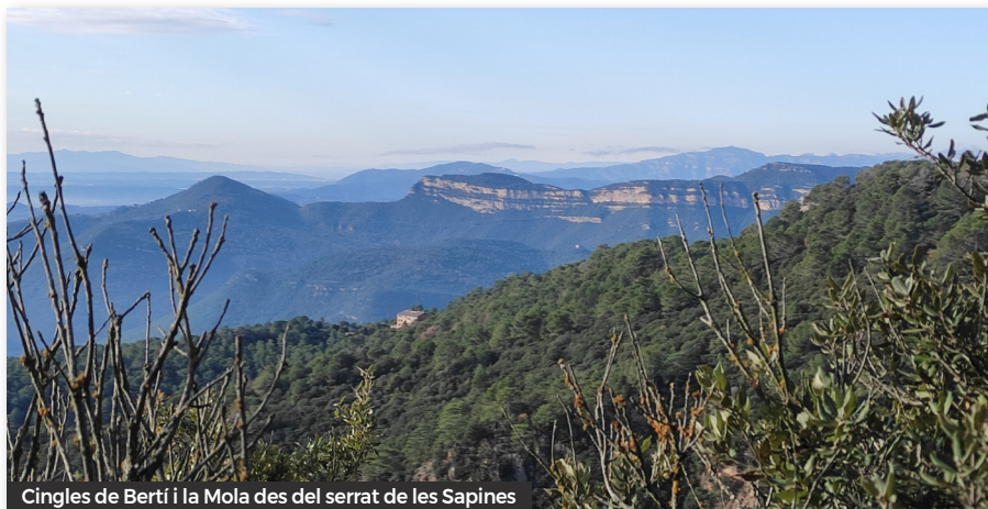
Cingles de Bertí i la Mola des del serrat de les Sapines

Reprenem la ruta baixant al collet de Sant Martí, i ben seguit pugem al turó del Tagamanent, amb el petit nucli restaurat de Santa Maria. El dia ha anat millorant i també les extenses panoràmiques d'aquest turó. Els més veterans en guardem bons records de les nostres primeres excursions en aquest racó del Montseny.