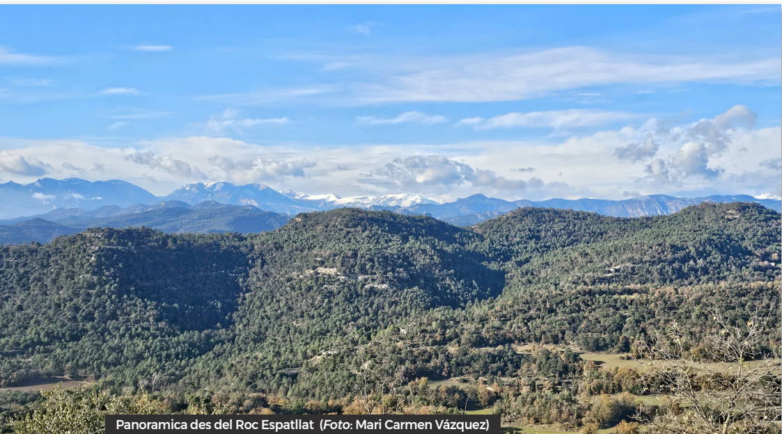
Panoramica des del Roc Espatllat

Baixem del Puig en direcció a les ruïnes de Ca l'Apedaçat. Per estalviar-nos algunes voltes de pista de-