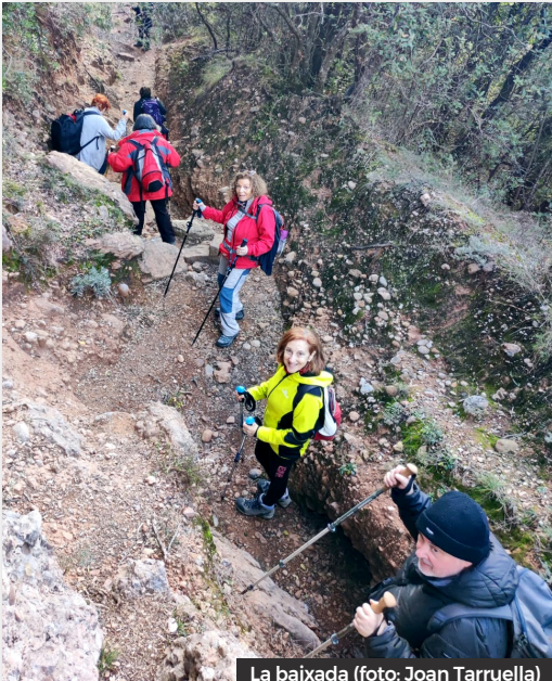
La baixada

Tips i feliços ens vam escarxofar als seients del bus quan, mig endormiscats, ens va sorprendre la visió d'un cumulonimbus impressionant que havia descarregat calamarsada sobre Vic. El colofó d'una excursió magnífica en un ambient jovial. Repetirem!