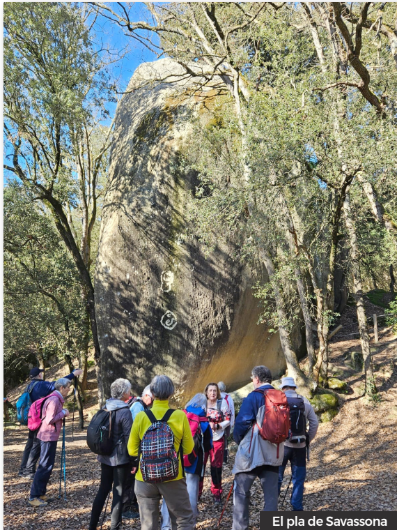
El pla de Savassona