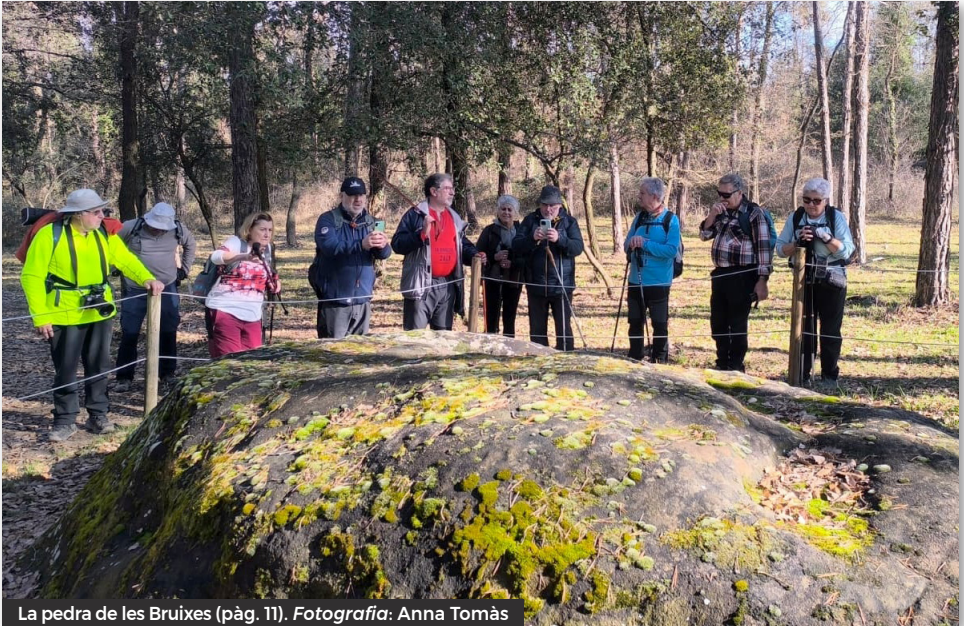
La pedra de les Bruixes (pàg. 11).