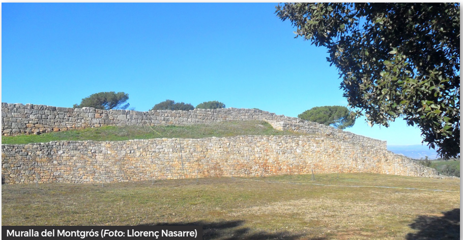
Muralla del Montgròs

més alt (850 m), l'assolim en entrar a la Serra de l'Arca. Anem paral·lels al GR2, per un petit corriol just al costat del cingle de la serra, cosa que ens permet veure els dòlmens del Pla de Boix i del Serrat de Puigventós, així com dividir bones vistes de la vall de l'Avencó, i del Montseny. Ens reincorporem al GR2, i passem pel costat dels dòlmens de la Serra de l'Arca i de Casanova de can Serra. Ara ja baixem més decididament en direcció a Aiguafreda. Passem a la vora les restes del mas de can Serra