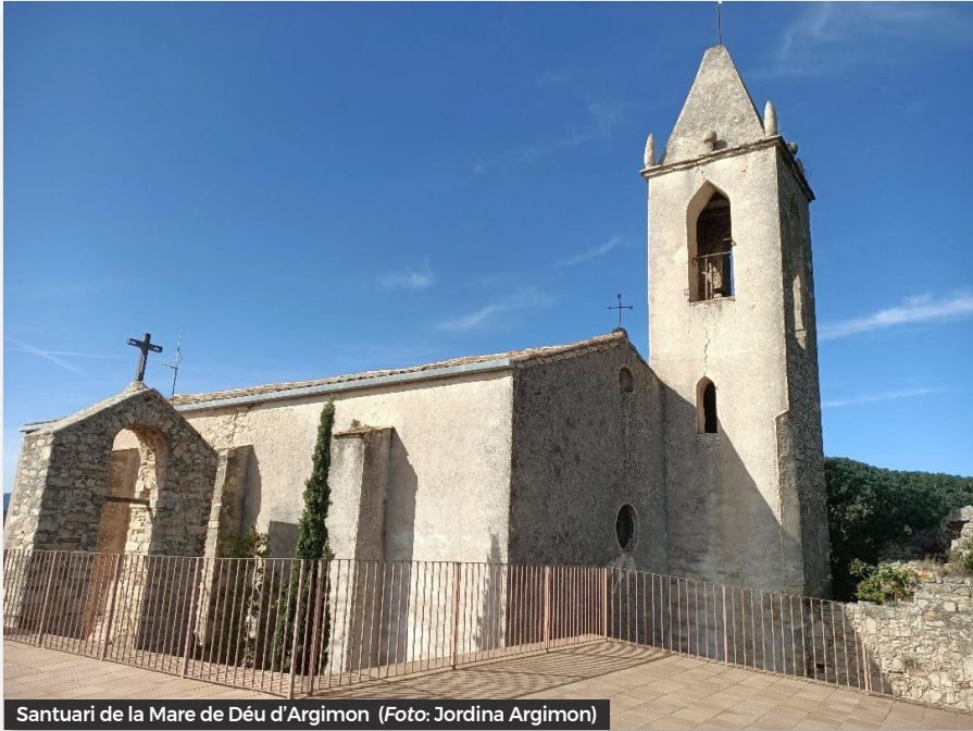
Santuari de la Mare de Déu d'Argimon

però, teníem matalassos, no com en una altra ocasió que a l'arribar ens els vam fer omplint un sac amb palla que hi havia a l'era.