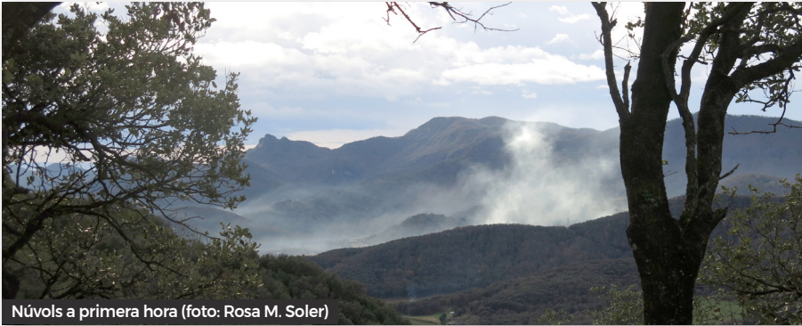
Núvols a primera hora