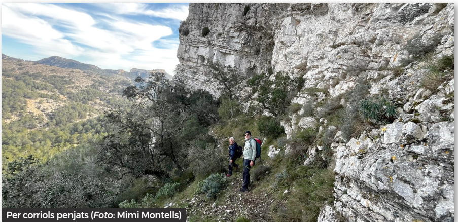
Per corriols penjats

del coll del Rourar. Dalt dels seus penya-segats la vista dels massissos tarraconins i la costa és una mostra del que anirem descobrint tot el dia. Com ja és habitual a les Terres de l'Ebre ens acompanya el vent. Dalt de la Moleta i ja de baixada trobem unes restes escadusseres d'un antic poblat ibèric. Un pas un xic delicat ens permet baixar la cinglera i arribar a les runes del Mas d'en Sanxo, on aprofitem a fer un mos. Prosseguim la ruta baixant pel barranc de Jovara. Passat un quilòmetre aproximadament, ens desviem per un viarany força brut i equipat amb cordes, i ens enfilem a la Cova de la