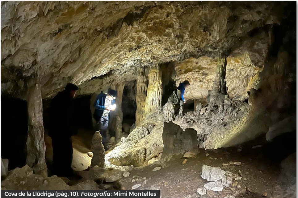
Cova de la Llúdriga (pàg. 10).