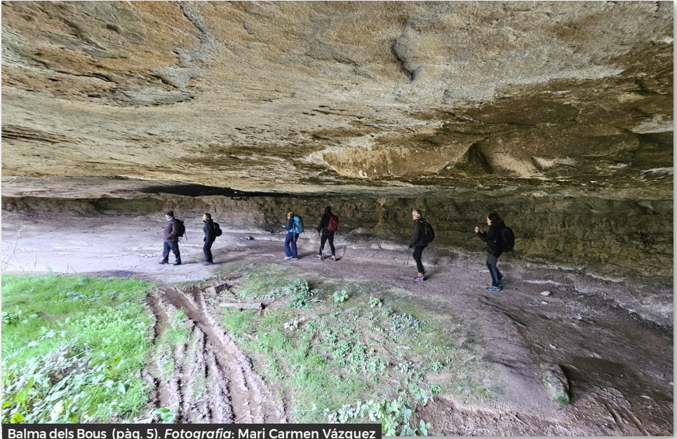
Balma dels Bous (pàg. 5).