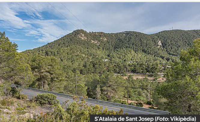
S'Atalaia de Sant Josep

No hi havia aigua corrent però sí una cisterna de la que la poàvem amb un cubell metàl·lic. Amb totxanes, vam fer una dutxa a l'exterior de la casa i per la llum, fèiem servir un parell de làmpades de càmping gas, d'aquelles de color blau amb les samarretes que s'havien de cremar perquè es possessin en funcionament la primera vegada. Aquell any