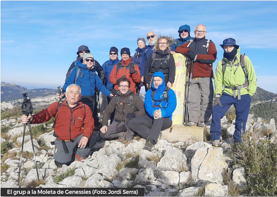
El grup a la Moleta de Genessies

Lúdriga, una cavitat ampla amb diferents espais plens d'estalagmites i estalactites; tot i el terra relliscós, és un plaer recórrer els seus racons. Després d'alguna relliscada sortim a l'exterior i desfem el camí equipat fins el Barranc de Jovara.