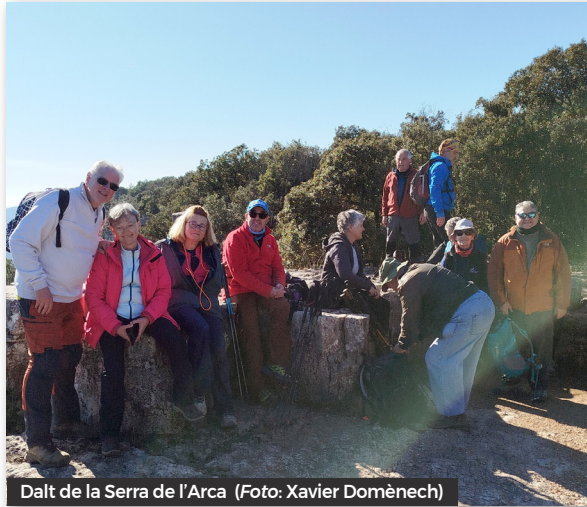
Dalt de la Serra de l'Arca

de l'Arca, i d'una cabana de pedra seca i, finalment entrem a Aiguafreda per dirigir-nos a l'estació de Sant Martí de Centelles, el punt d'inici. A banda del GR2 que hem anat seguint bastants trams durant la segona meitat de la ruta, a l'inici fins a l'Afrau hem seguit el sender local SL-C 88. Hem caminat majoritàriament per corriols ben fresats. Fins el Mongrós hem caminat per corriols ben fresats i per alguns trams de pista. La distància total recorreguda ha estat de 18 km amb un desnivell de 540 m