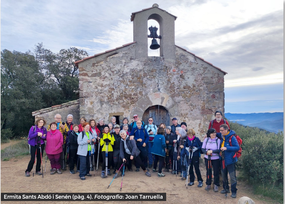
Ermita Sants Abdó i Senén (pàg. 4).