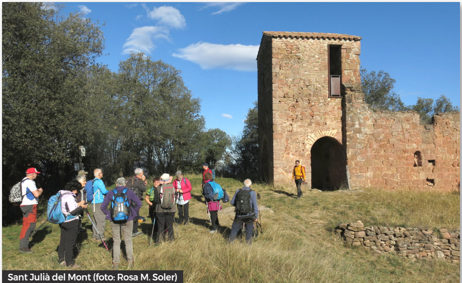
Sant Julià del Mont