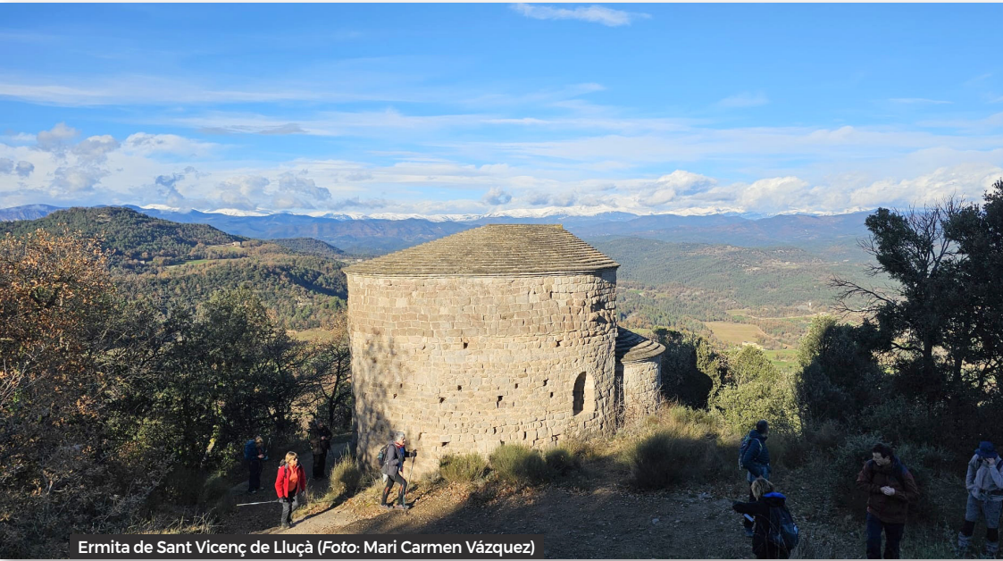
Ermita de Sant Vicenç de Lluçà

cidim baixar pel dret fins a sortir als camps del Pla de la Serra.