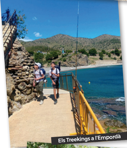
Els Treakings a l'Empordà