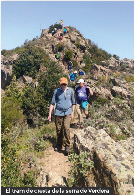
El tram de cresta de la serra de Verdera

temps ens ofereix una panoràmica espectacular de 360°.