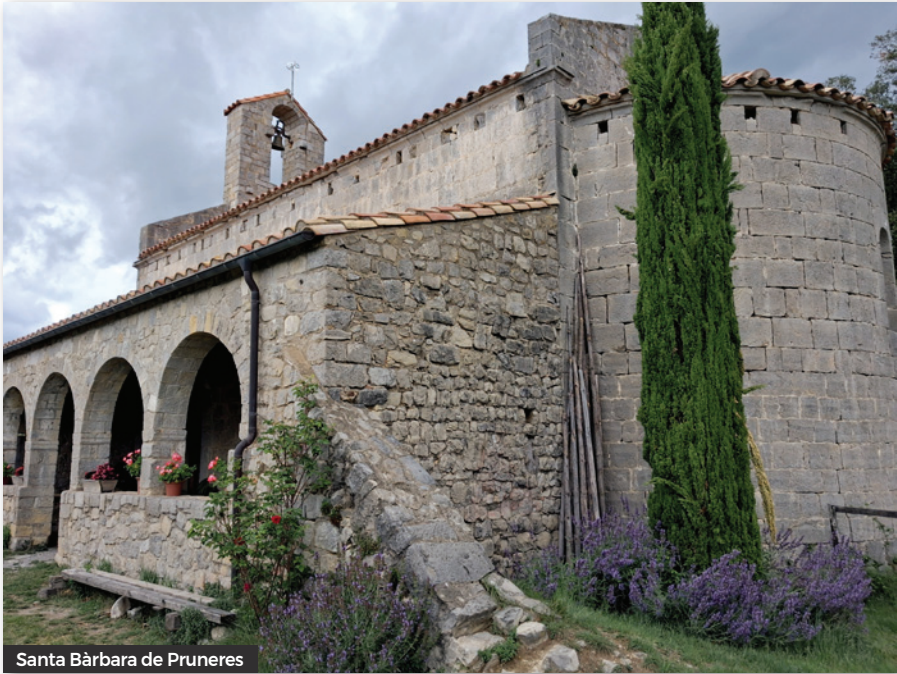
Santa Bàrbara de Pruneres