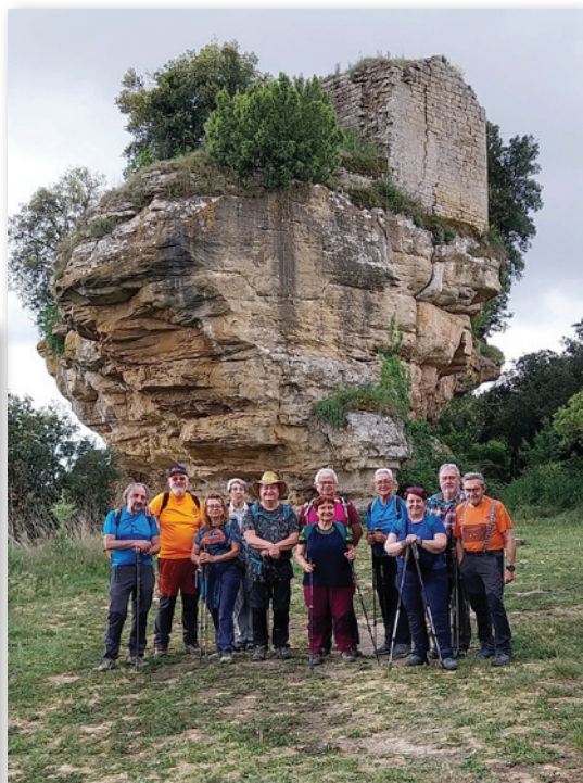
El grup al castell de la Popa