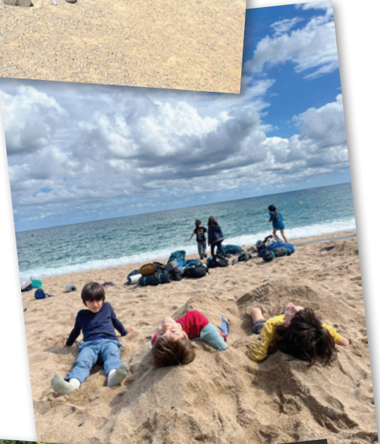
Els Txeiens al Maresme