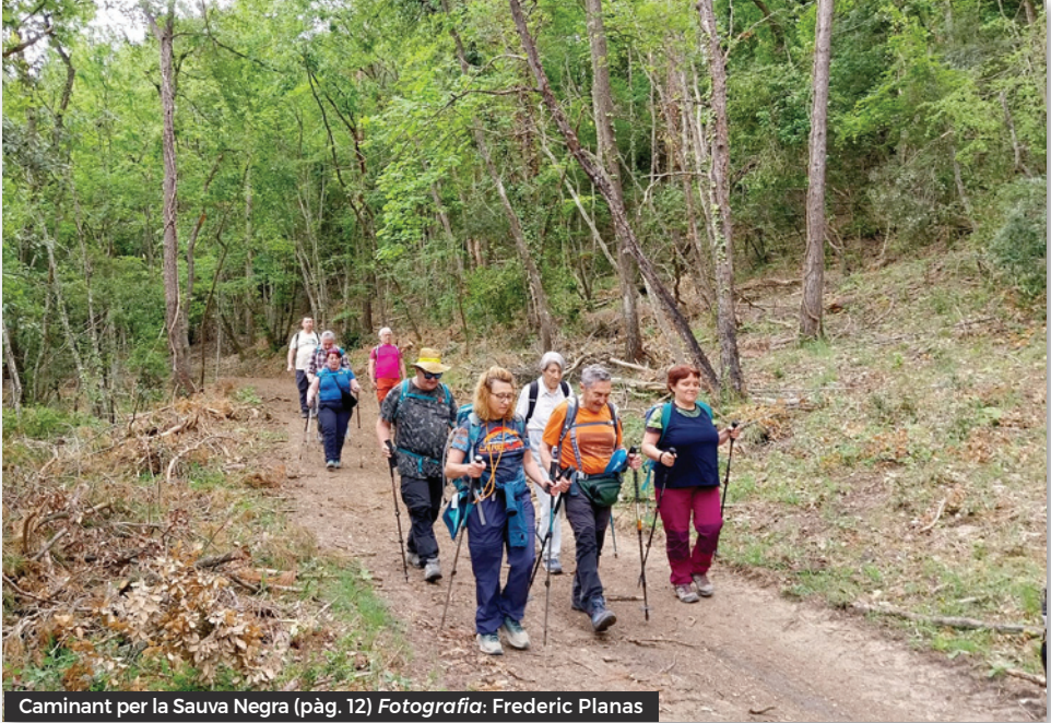
Caminant per la Sauva Negra (pàg. 12)