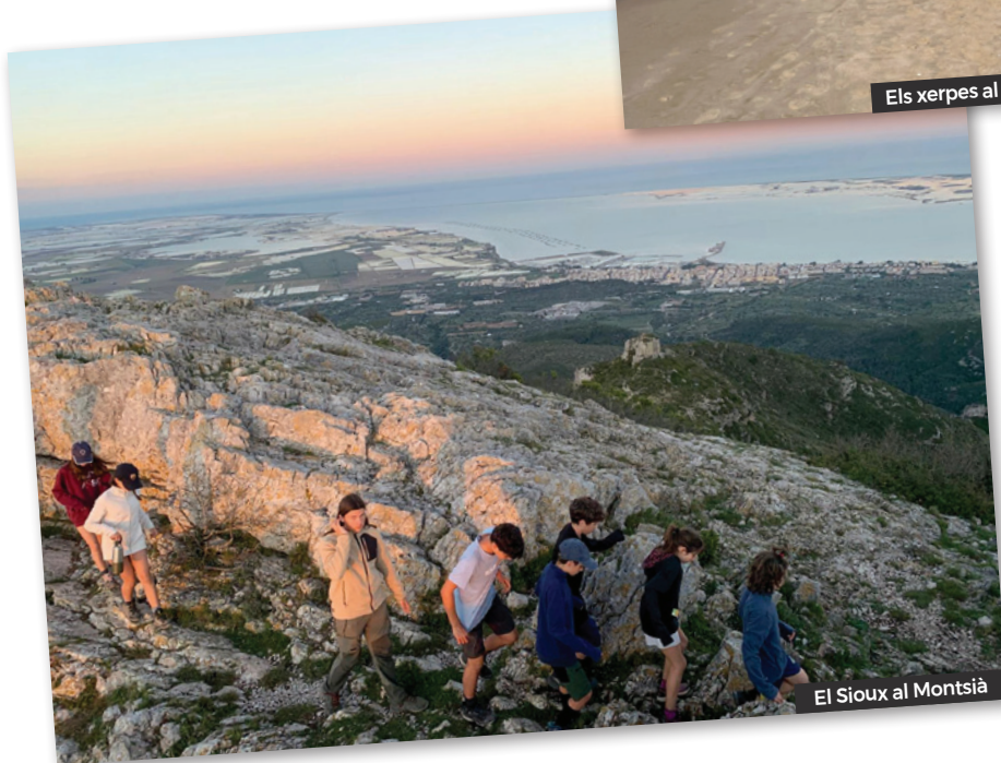
El Sioux al Montsià