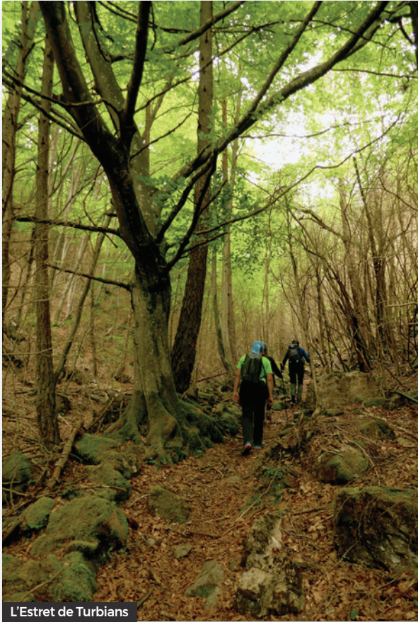
L'Estret de Turbians

apropant a la base de la cinglera, mentre ens endinsem al torrent anomenat Estret de Turbians, per un bosc ben bonic, on destaca un immens faig de vuit branques.