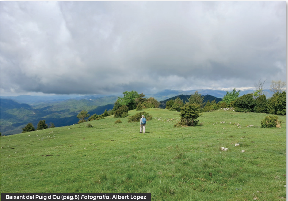
Baixant del Puig d'Ou (pàg.8)