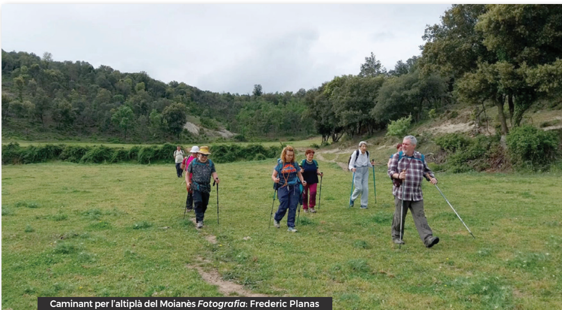
Caminant per l'altiplà del Moianès

1462-1472, el castell capitula el 1465, aleshores el rei Pere IV disposa la reparació del castell. Després de successives ampliacions a principi del segle XV els senyors de Centelles abandonen el castell. El castell és utilitzat per les tropes en la guerra dels segadors 1640-1659.