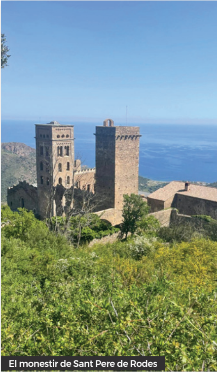
El monestir de Sant Pere de Rodes