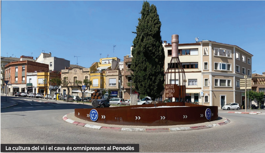
La cultura del vi i el cava és omnipresent al Penedès

Ahir vam anar a una Cava a Sant Sadurní, els grans van poder provar el cava i els avis em van dir que estava molt bo. També vam menjar coca que era igual per a tots, però els petits vam fer un suc.