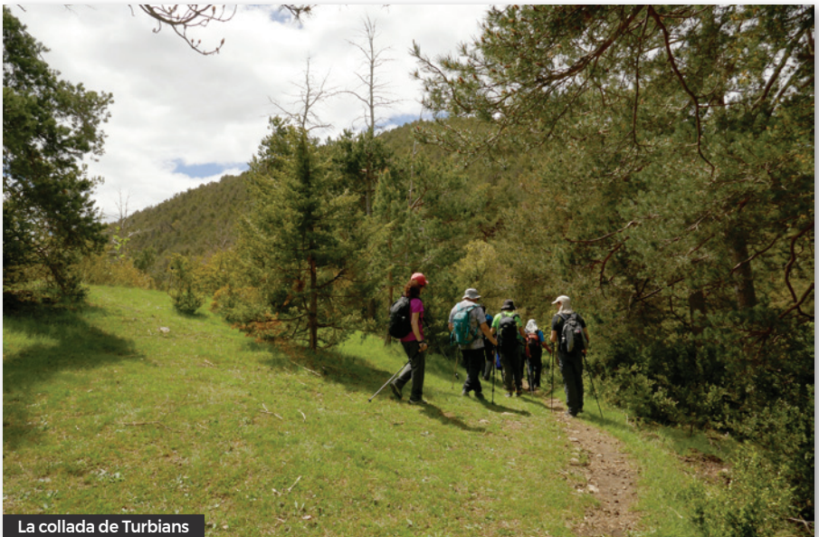
La collada de Turbians

No obstant, de moment el camí es presenta força planer i ens anem