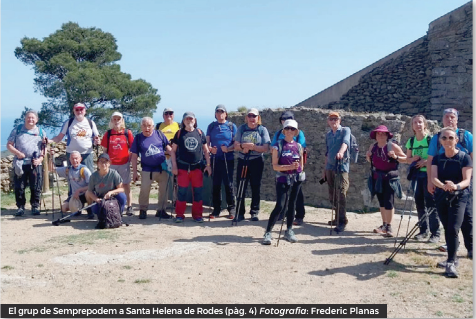
El grup de Semprepodem a Santa Helena de Rodes (pàg. 4)