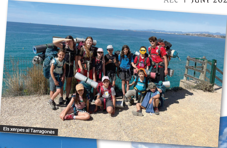
Els xerpes al Tarragonès