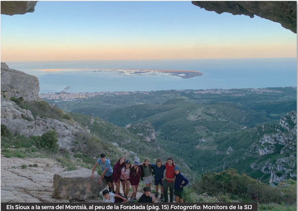
Els Sioux a la serra del Montsià, al peu de la Foradada (pàg. 15)