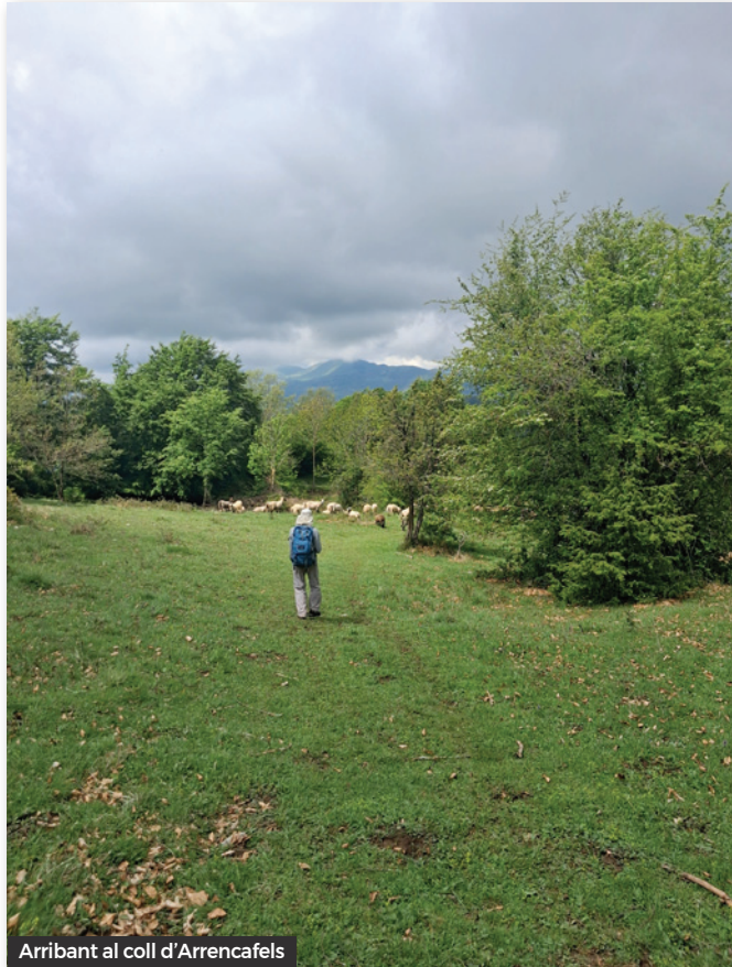
Arribant al coll d'Arrencafels

Un cop superat el Puig d'Ou, la vegetació es transforma. Les alzines deixen pas a les fagedes majestuosos i prats de muntanya. El descens el realitzem buscant el coll de la