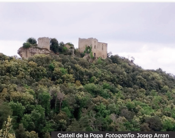
Castell de la Popa

A la tornada no volíem baixar per el mateix camí aleshores baixant per la pista i agafant dreceres per evitar arribar a la carretera vam arribar els cotxes i cap a dinar.