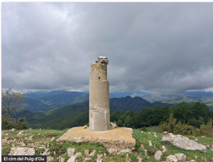
El cim del Puig d'Ou

Buscant la carena que ens portar cap a la Muntanya del Talló (1.276