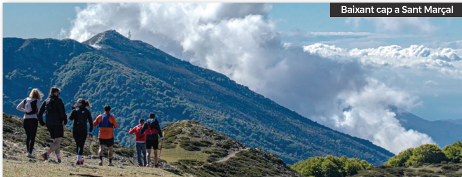
Baixant cap a Sant Marçal

Des d'aquestes ratlles volem felicitar als amics de Vilamajor, per haver assolit una fita tant important, com són les 50 edicions.