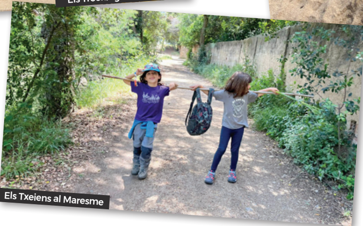
Els Txeiens al Maresme