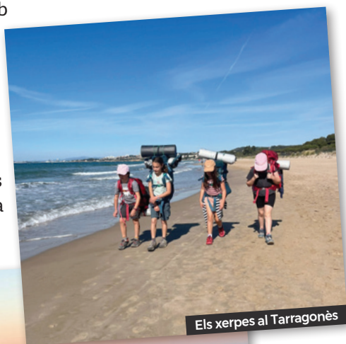
Els xerpes al Tarragonès

Cap de setmana de mar, muntanya i fins i tot alguns han fet el primer bany de l'any.