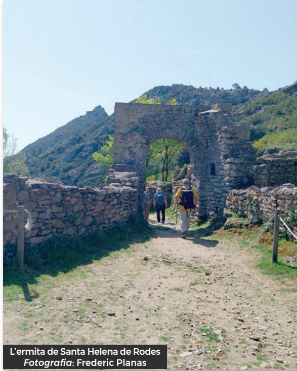
L'ermita de Santa Helena de Rodes