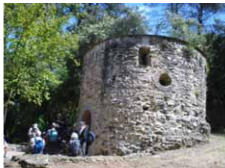
Ermita Sant Adjudori

Així arribem a Can Borrell, a la Torre Negra i al pi d'en Xandri, ja a les envistes de Sant Cugat. Trevessem la població fins la plaça del Monestir i cap al restaurant on posem fi a una llarga passejada per la serra de Collserola i on, a més de la caminada, ens hem culturitzat una mica més.