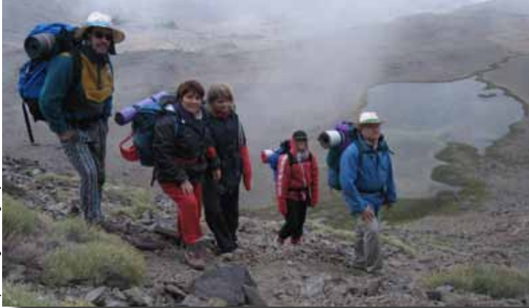
Lagunas Jumillas (2.940 m), Sierra Nevada, agost 2007.

En principi, el campament base s'establirà al càmping de Trevélez, població més alta de Sierra Nevada (1.476 m), al vell mig de Las Alpujarras i famós pel seus pernils. Depenent dels participants, es podran considerar altres opcions.