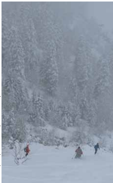
Baixant per la pala del Mesilla

E n arribar al Refugi ens el trobem ja tancat i entrem a la part lliure per descansar i menjar una mica. Ara només ens resta baixar fins als cotxes. El dia abans el Guarda ens havia explicat que no calia baixar pel bosc, sinó que es podia baixar per la Pala del Mesilla. Es tracta d'una pala amb molt pendent, però sense arbres, que baixa directament cap a la pista. Això sí, cal anar molt amb compte amb les pedres, que a la part baixa hi són força abundants.