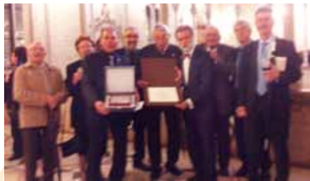
Grup de participants

Avui és 15 de maig de 2013, encara no és 1/4 de 8 i ja fa una estona que hi ha cua al carrer del Bisbe per entrar al palau de la Generalitat.