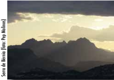
Serra de Bèrnia