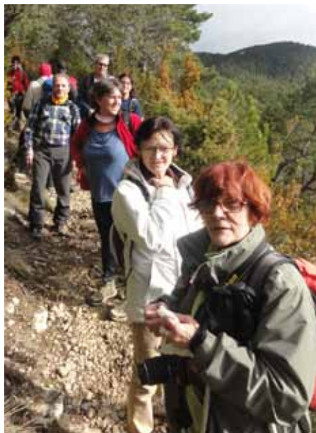
Embaixadors AEC. Camí del cim del Tossal