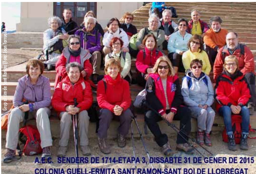
Grup al cim de Sant Ramon

A.E.C. SENDERS DE 1714-ETAPA 3, DISSABTE 31 DE GENER DE 2015 COLONIA GUELL-ERMITA SANT RAMON-SANT BOI DE LLOBREGAT