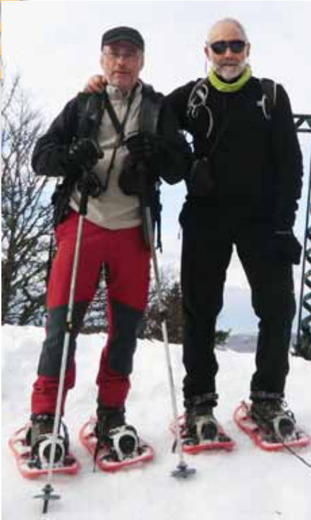
Cim del Gros Martel

Aquest hivern hem triat per fer esqui de fons i raquetes el massís de Vercors. Les precipitacions de neu han estat abundants i la meteorologia apunta que farà un període de bon temps.