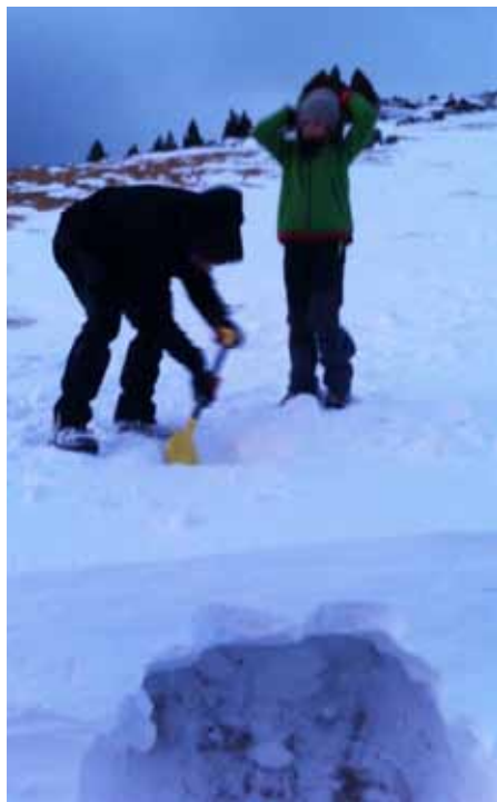
Tot fent el tunel

llar de foc. La nit era freda i fora el refugi se sentia com bufava el vent.