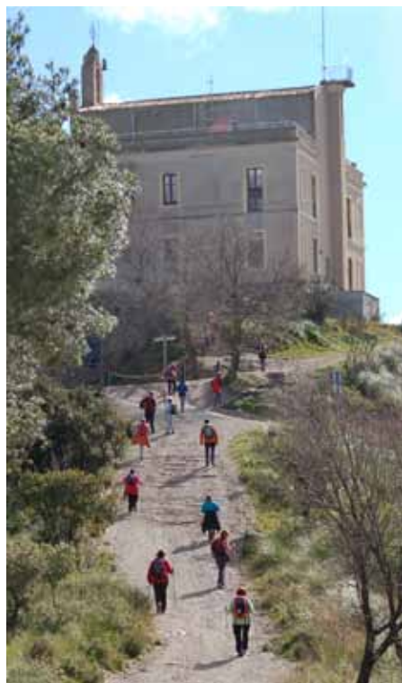
Últim tram fins l'ermita de st. Ramon

Creuem la carretera per un pont de fusta i encarem l'última pujada amb el pas controlat per no bufar massa. A dalt ens trobem amb la sorpresa que ja anàvem intuïnt pel camí: una de les millors vistes del nostre país. L'ermita de Sant Ramon està dalt d'un turó una mica aïllat i suficient alt com per tenir una visió interessant de 360 graus. Es veu Barcelona des d'un altre angle; el delta del Llobregat amb tots els seus pobles, l'aeroport...; el mar i