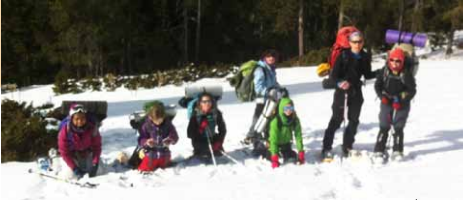
Grup de participants

Aquest gener els Xerpes hem anat a la neu! Vam quedar dissabte ben d'hora a l'Agrupada i vam pujar a l'autocar, compartit amb els Trekkings i els Juvenils: Som-hi cap amunt al Ripollès, on cada grup feia diferents excursions!