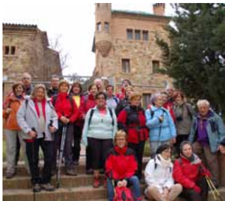
Davant l'escola de la Colònia Güell

Boi que encara és dintre d'una zona. Caminem fins a la colònia Güell. És un barri que a aquelles hores s'hi respira serenor, tranquil·litat... que se'ns va enganxar a la pell i ens va acompanyar tot el dia. Aquesta harmonia va fer que un del grup ens pagués el cafè a tots perquè havia arribat una mica tard al tren. Admirem alguns dels edificis més significatius que ens anem trobant. Arribem a la conclusió que un dia que hi hagi un forat en el calendari organitzarem una visita cultural amb paciència per degustar l'arquitectura modernista.