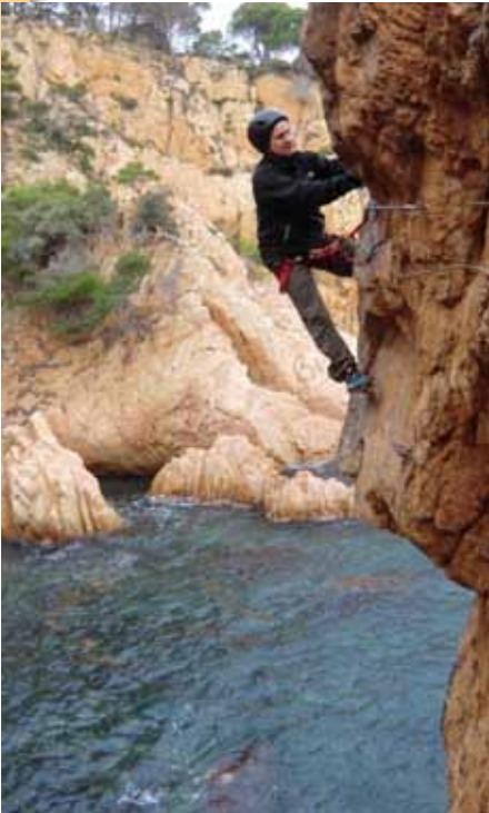
Sobre el mar

Els caps de setmana acostuma a tenir força gent.