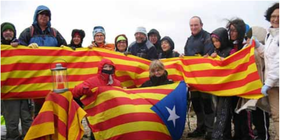
Participants al dalt del cim del Tossal

El mes de febrer de 2013, amb motiu del protagonisme de l'Agrupació Excursionista "Catalunya" en la Renovació de la Flama de la Llengua Catalana, en el cim del Tossal del Rei, que amb els seus 1.349,8 metres és el punt d'unió de Catalunya, País Valencià i la Franja, ens vam comprometre amb el Centre Excursionista de Castelló a vetllar ambdós perquè la reunió d'excursionistes dels tres territoris, es repetiria cada any, per així poder repartir el foc de la nostra llengua, pels tres territoris.