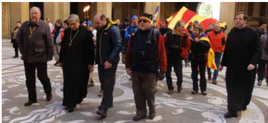
Encapçalament de la marxa de la Flama

Una representació de l'Agrupació Excursionista "Catalunya" encapçalada pel president, va participar en els actes de la 46 Renovació de la Flama de la Llengua Catalana a Montserrat.