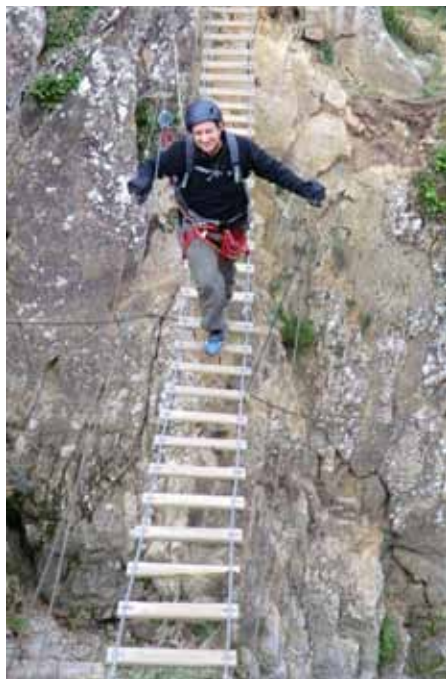
Equilibris sobre el pont

I niciem la via i ben aviat arribem a un estretament de la riera on l'aigua baixa encaixonada, és l'anomenat Pou de Gorgues. La via ho supera a mitja alçada. Seguim amunt i anem trobant passos equipats i diferents ponts tibetans, algun d'ells força bellugadís, però que a la llarga et vas acostumant.