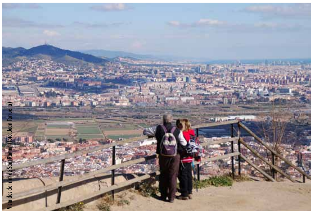
Vista des del cim de Sant Ramon