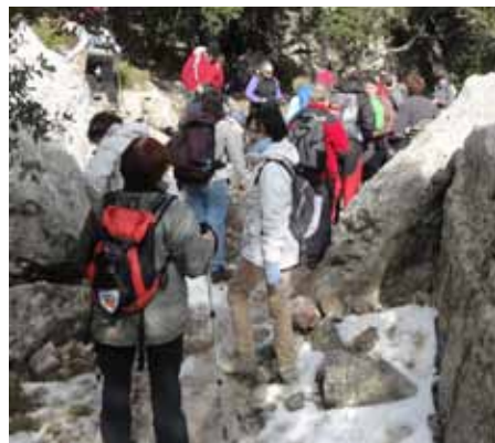
Grup camí del cim

Una vegada al cim petits parlaments de representants del C.E Castelló i de l'AEC, van donar pas al lliurament de la Flama i l'entonació dels Segadors i l'Estaca i ja tots junts fins al coll de Tumbadors on els que havien pujat en el 4x4 van fer el propi