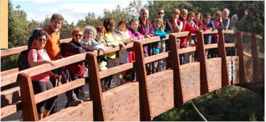
Participants al pont sobre la carretera

A rebuf del Tricentenari, aquest any anem visitant alguns llocs significatius de la geografia catalana que van tenir rellevància durant la guerra de Successió Espanyola.