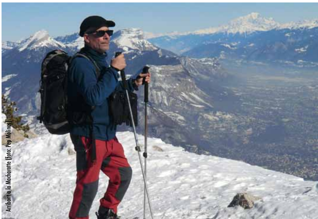
Aribant a la Madarrotte