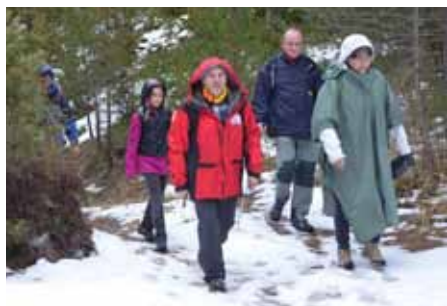
Camí del cim

L'Agupa la vam representar nou socis que, en transport particular, ens van desplaçar a Fredes, punt de trobada amb els representants del Centre Excursionista de Castelló i en aquesta ocasió també de Centre Excursionista de Benicàssim amb els que, des de la població de Castelló, la major part dels assistents iniciarem una interessant ascensió al cim del Tossal del Rei mentre la Flama pujava en 4x4 en direcció al cim.