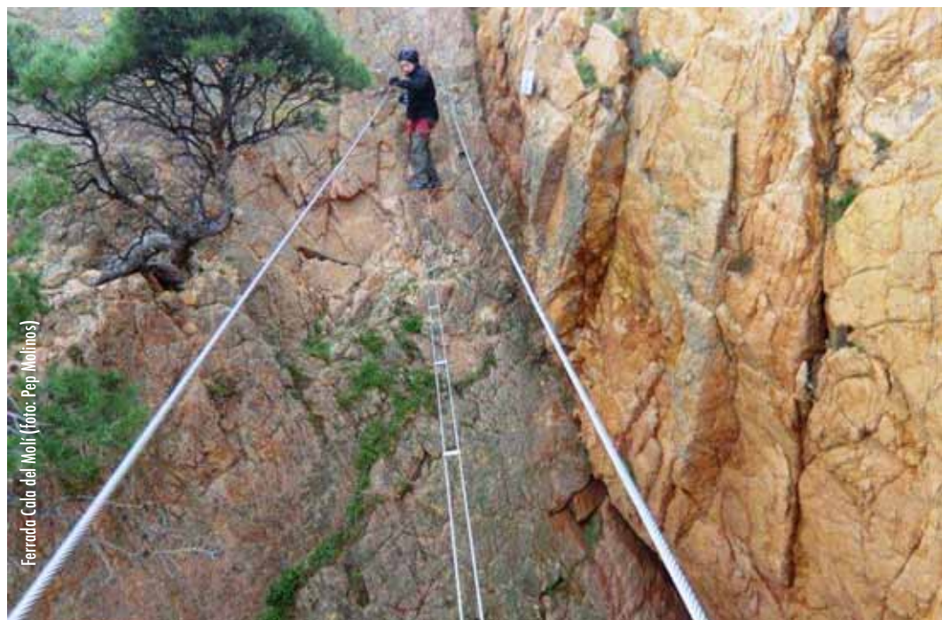
Ferrada Cala del Molí