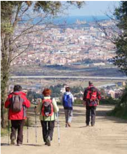
Baixant de l'ermita de st. Ramon

A lguns companys ja han de marxar cap a casa i la resta recorrem