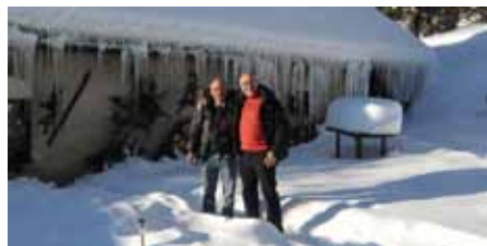
Gite l'Essendole

Segueix l'anticicló i les baixes temperatures. Avui canviem els esquis per les raquetes, i ens traslladem a la població veïna de Lans-en-Vercors. Deixem el cotxe al parking de La Sierre, i ja amb raquetes als peus iniciem la pujada cap els Rocher de Sant Michel-Mucharotte. L'itinerari alterna trams de pista i corriols. A partir de la Combe de St. Nizier, tirem pel dret de cara a la carena i primer cim. Arribats al cim la vista és fantàstica: del Montblanc, al Tabor, passant pel Ecrins